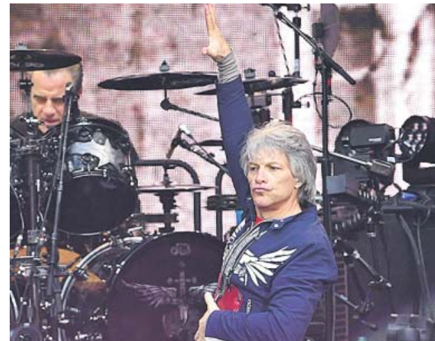
Bon Jovi durante uno de sus conciertos recientes.

El grupo está girando con una selección de 95 canciones que pueden rotar y cambiar cada noche en cada actuación, pero seguro que no faltarán los clásicos de su carrera, como You give love a bad name , It's my life , Wanted dead or alive , Bad medicine o la siempre coreada Livin' on a prayer . ● L. B.