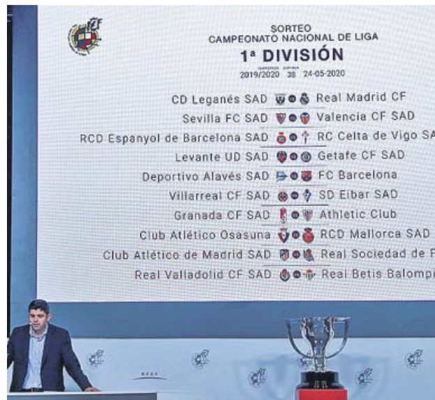
Sorteo del calendario con la copa para el campeón.

Los derbis sevillanos prometen ser, un año más, apasionantes. Los nuevos proyectos de Julen Lopetegui y Rubi se verán las caras por primera vez en la jornada 13, en el Be-