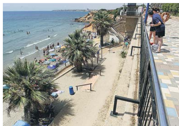
Paseo marítimo de Orihuela, donde se produjo el accidente.

La aseguradora Línea Directa presentó ayer sus nuevos servicios digitales para mejorar la experiencia de sus clientes. A partir de ahora ya es posible obtener un presupuesto del seguro simplemente fotografiando con el móvil el carné de conducir y la matrícula del coche, o recibir una indemnización por la rotura de una vitrocerámica con solo enfocarla con el móvil y gracias al vídeo peritaje, así como gestionar y cerrar una cita con el médico que más convenga al cliente utilizando un asistente de voz. Además, a la hora de renovar el seguro, los clientes podrán recibir descuentos personalizados.