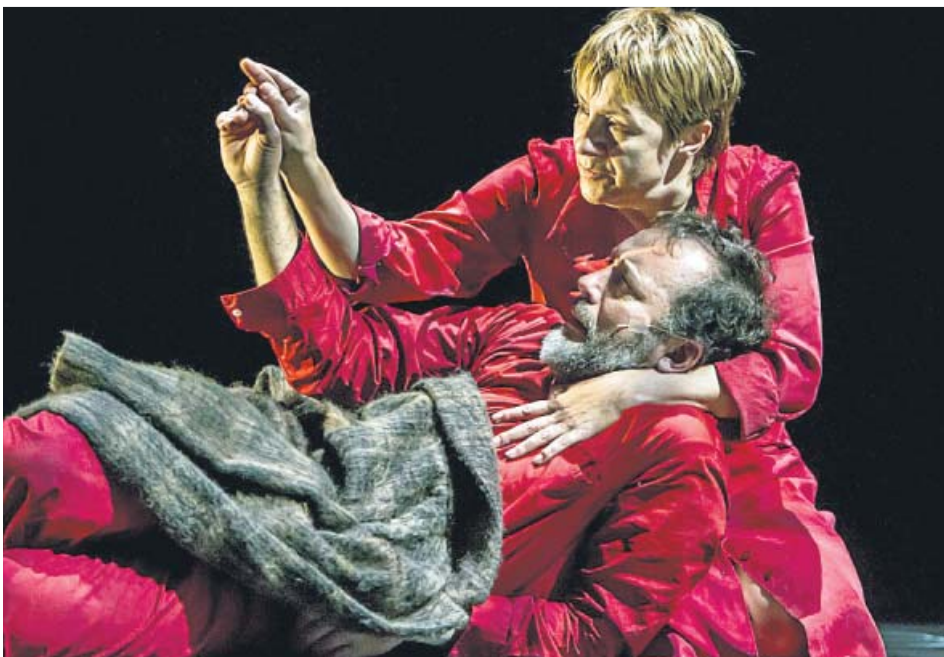
Los actores Blanca Portillo y José Luis García-Pérez en El Cartógrafo.