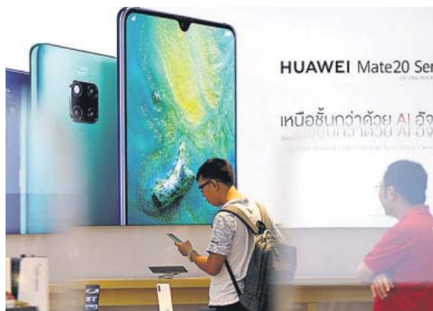
Un cliente revisa un móvil Huawei en una tienda de la marca.

El veto de Trump, que parece seguir en vigor, ha hecho que la compañía pierda un 50% de cuota en España, lo que ha beneficiado a su competencia directa