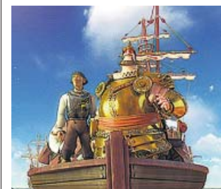
Una aventura que hace justicia histórica. FILMAX

Elcano y Magallanes. La primera vuelta al mundo estimulará la curiosidad de niños y mayores gracias al espíritu lúdico y divulgativo de sus crea-