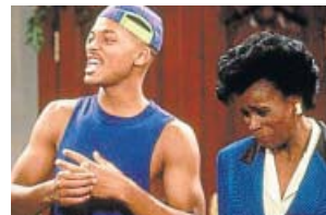
El príncipe de Bel Air NEOX. 11.35 H

Versión restaurada de la mítica serie de los noventa sobre la vida de Will (Will Smith) en el exclusivo barrio de California Bel-Air. Él viene de un barrio del centro de Filadelfia y se marcha con sus adinerados tíos para recibir una exquisita educación.