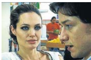
'Se busca' CUATRO. 22.50 H

Jack (George Clooney) es un asesino a sueldo. Tras un problema en un trabajo en Suecia, se refugia en un pueblo italiano para realizar una última misión para una mujer. Después se retirará. Allí traba amistad con el cura del pueblo (Paolo Bonacelli).