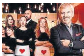
TELERREALIDAD First Dates CUATRO. 21.35 H

La historia de las dos Coreas comienza con la colonización japonesa. Este documental permite comprender la situación actual, lejos de los clichés que persiguen al Norte y al Sur.