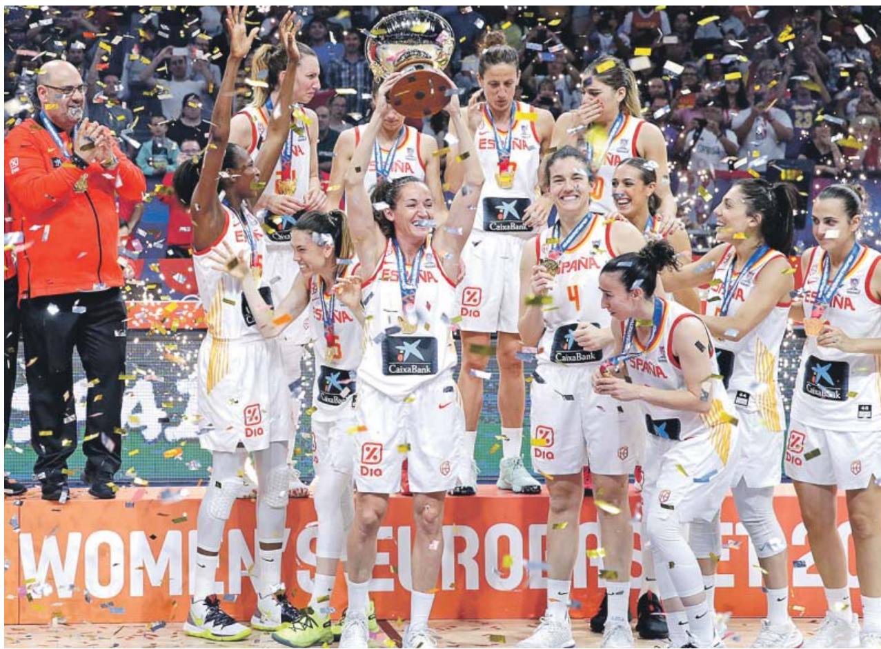
Las jugadoras de la selección española celebran su victoria en el Eurobasket.

Tras las dudas iniciales, la fluidez volvió al juego de las