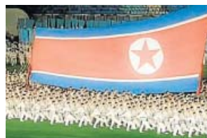
DOCUMENTAL Corea, ¿la reunificación imposible? LA 2. 23.25 H

Estreno este lunes del programa de actualidad y entretenimiento presentado por Màxim Huerta, que abre su terraza de verano para recibir a variedad de invitados y conversar sobre temas de interés social.