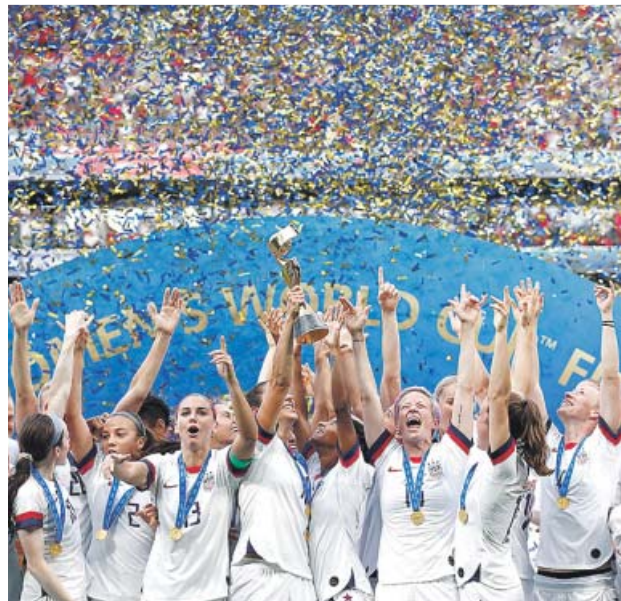
La selección de Estados Unidos celebra el Mundial.

que tenía que ser suyo. Ella venció no solo una batalla futbolística a los restantes 23 equipos, sino también un pulso dialéctico a Donald Trump. No pisará la Casa Blanca, pero a su vuelta a EE UU se sabrá heroína para muchos compatriotas suyos. Ella decantó la final