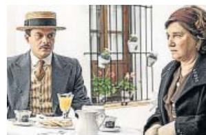
La otra mirada LA 1. 22.45 H

Versión restaurada de la mítica serie de los noventa sobre la vida de Will (Will Smith) en el exclusivo barrio de California Bel-Air. Él viene de un barrio del centro de Filadelfia y se marcha con sus adinerados tíos para recibir una exquisita educación.