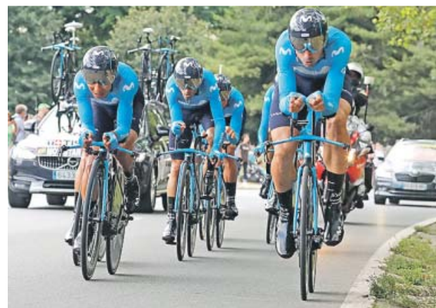
El Movistar, en acción en la crono por equipos.

Los corredores del Jumbo-Visma aventajaron en 20 segundos al segundo equipo en meta, el Ineos - antiguo Sky - del vigente campeón del Tour, Geraint Thomas. De este modo, el galés empieza pronto a