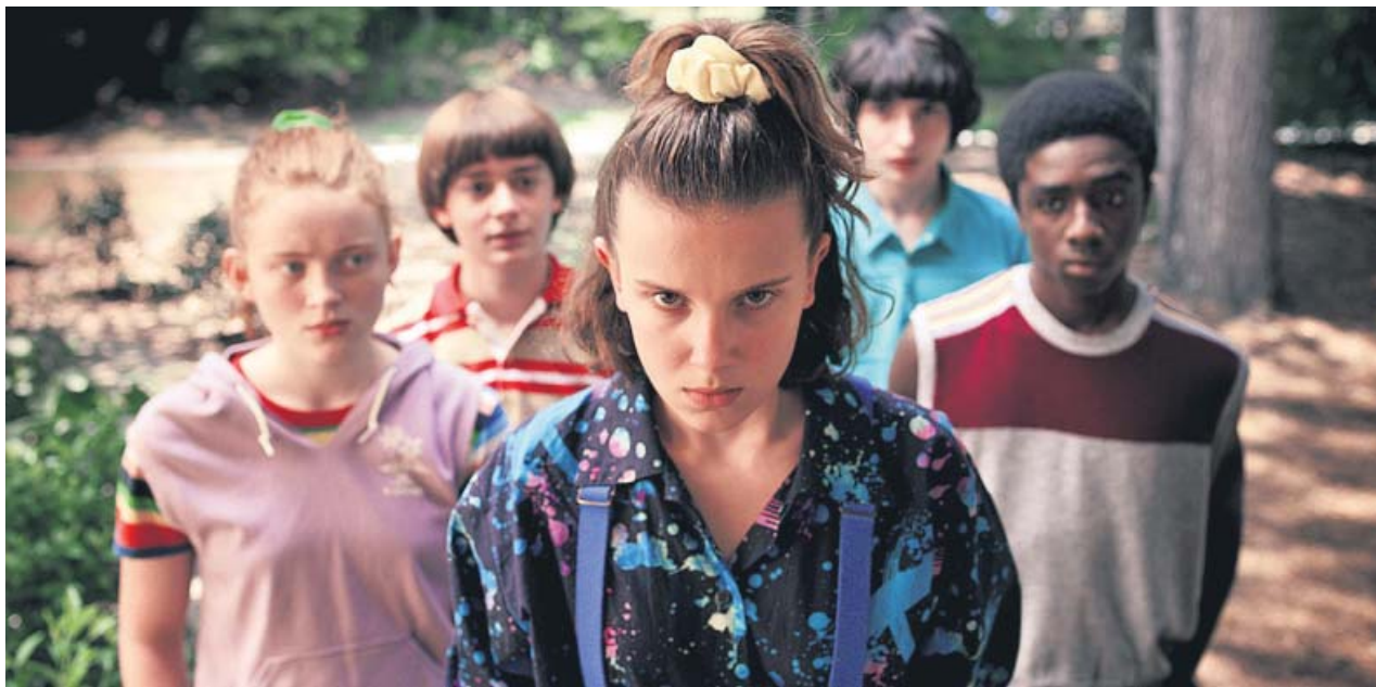
Max (Sadie Sink), Will (Noah Schnapp), El (Millie Bobby Brown), Mike (Finn Wolfhard) y Lucas (Caleb McLaughlin).