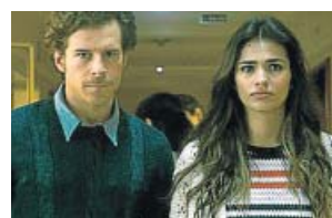
Brigada Costa del Sol TELECINCO. 22.40 H

Luisa recibe la visita de su hijo Arcadio acompañado de Catalina, su prometida, una mujer de la misma edad que Luisa. Arcadio quiere reconciliarse con su madre y retomar el tiempo perdido, pero la profesora no sabe qué pensar.