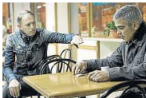
'El americano' LA SEXTA. 22.30 H

Jack (George Clooney) es un asesino a sueldo. Tras un problema en un trabajo en Suecia, se refugia en un pueblo italiano para realizar una última misión para una mujer. Después se retirará. Allí traba amistad con el cura del pueblo (Paolo Bonacelli).