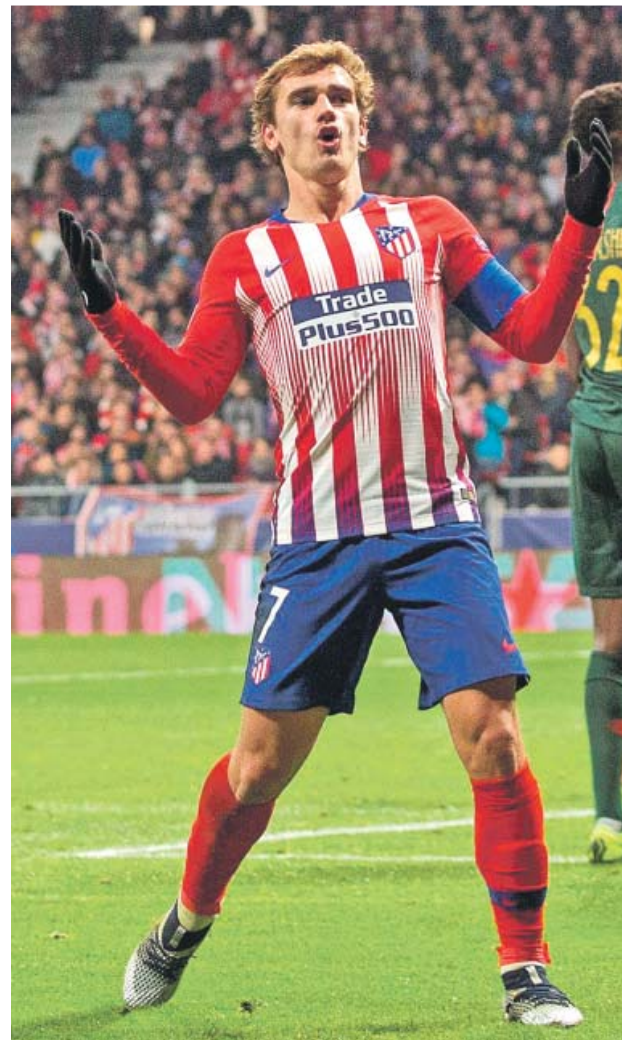
Antoine Griezmann en un partido con el Atlético.