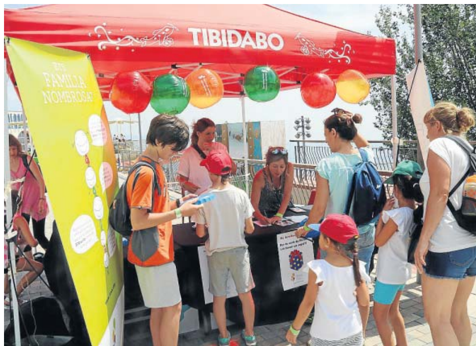
Famílies demanant informació ahir, insten al Parlament a recuperar les prestacions universals.