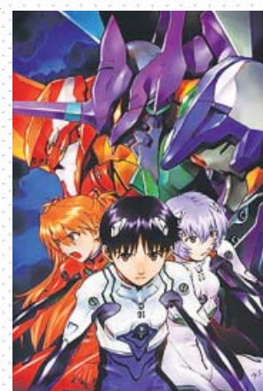
Los protagonistas de Neon Genesis Evangelion . NETFLIX

Podríamos concluir hablando de la película-epílogo-corte de mangas The End of Evangelion , o de ese