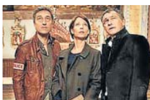
'Los crímenes de Carcassonne' ANTENA 3. 00.15 H

Un joven (James McAvoy) que daba por muerto a su padre, descubre que era un sicario y que ha sido asesinado. Es reclutado por Fox (Angelina Jolie) para la misma organización de su padre. Sloam (Morgan Freeman) se encarga de entrenarlo.