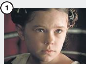
1 Anna Paquin

Su carrera despegó con el Óscar por El piano , en 1993. Aunque siguió trabajando, su regreso a la primera línea fue a partir del año 2000 como Pícaro en la saga X-Men . Ahora está en cartelera con El secreto de las abejas .