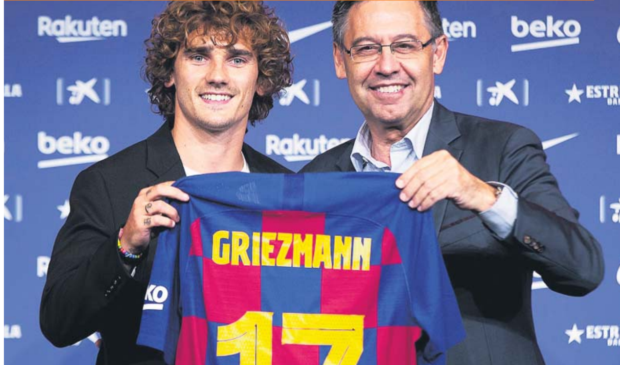
Griezmann posa, junto a Bartomeu, con la camiseta con el número 17.

«Si hay que pedir perdón, lo haré en el campo», dijo en su presentación el '17' del Barça sobre el documental del año pasado