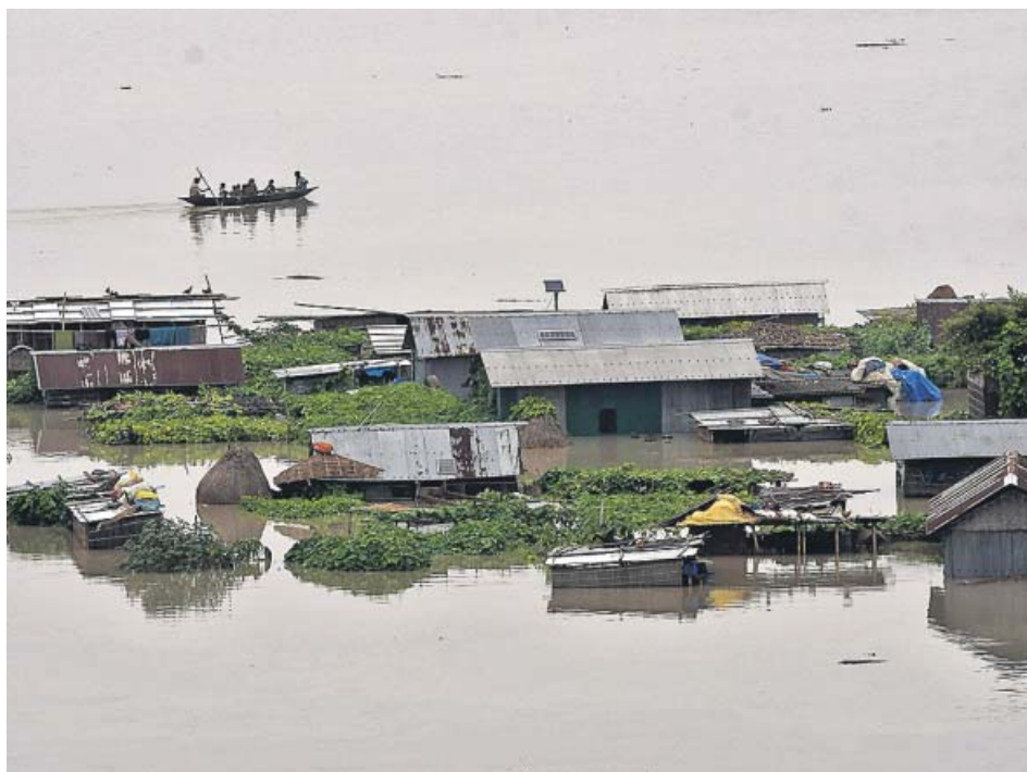
Vista aérea de una de las regiones afectadas por las inundaciones, en la India.

Las lluvias torrenciales que ha traído de la mano el monzón —un viento marino que sopla particularmente en el océano Índico— dejan ya 59 muertos, decenas de desaparecidos y más de dos millones y medio de afectados en Nepal y el noreste de la India. Las precipitaciones provocaron corrimientos de tierras e inundaciones en varias regiones de los dos países. Los incidentes relacionados con el monzón son habituales en el sur de Asia entre julio y agosto. ●