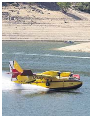
Un hidroavión cogiendo agua en El Burguillo.

Este mismo motivo habría ocasionado el de Sotillo de la Adrada (Ávila). Poco antes de las 16.00 horas del sábado comenzó este incendio de nivel 1, cuyas labores de extinción, a pesar de avanzar adecuadamente, se complicaron en la madrugada del domingo por el