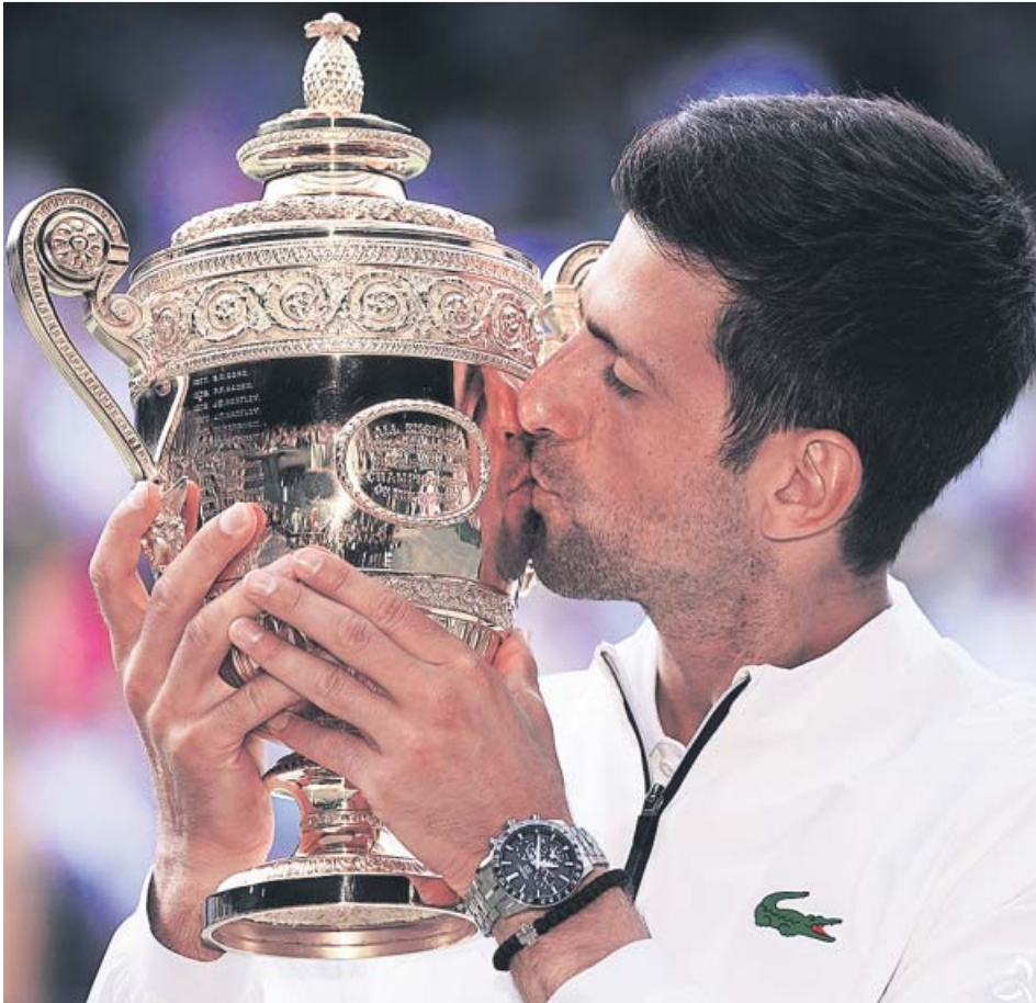
Djokovic besa el trofeo de campeón de Wimbledon tras derrotar en la final a Federer.

EL SERBIO conquistó el título en Londres ante un Federer que tuvo dos bolas de partido para ganarlo FUE LA FINAL MÁS LARGA de la historia del torneo, en la que Nole se impuso en cuatro horas y 57 minutos