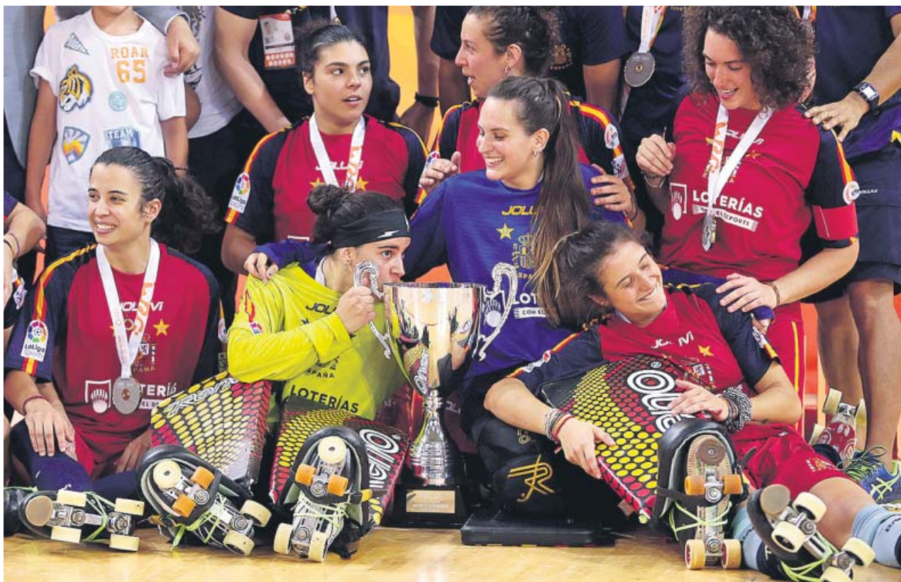
Las jugadoras de la selección española de hockey patines celebran su triunfo en el Mundial.

En cuanto a Carlos Sainz, fue de nuevo un fin de semana de menos a más para el piloto español. Después de quedarse fuera de la Q3 del sábado, y salir decimotercero ayer, acabó la prueba sexto, con una gran defensa final sobre Daniel Ricciardo, que ya avisaba antes de la salida que le iba a tocar los bemoles (lo hizo de manera literal mientras el español comparecía en Movistar+). El otro piloto de McLaren, Lando Norris, que empezó muy bien, se fue desinflando y acabó fuera de los puntos. Todo lo que el británico ganó el sábado, lo perdió el domingo. ●