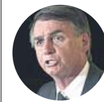
JAIR BOLSONARO Presidente de Brasil

«¿Qué dijo Messi? Ah, sí. Eso es un 'show' de los jugadores de fútbol. Se cansaron de cobrar boludeces en esta Copa»