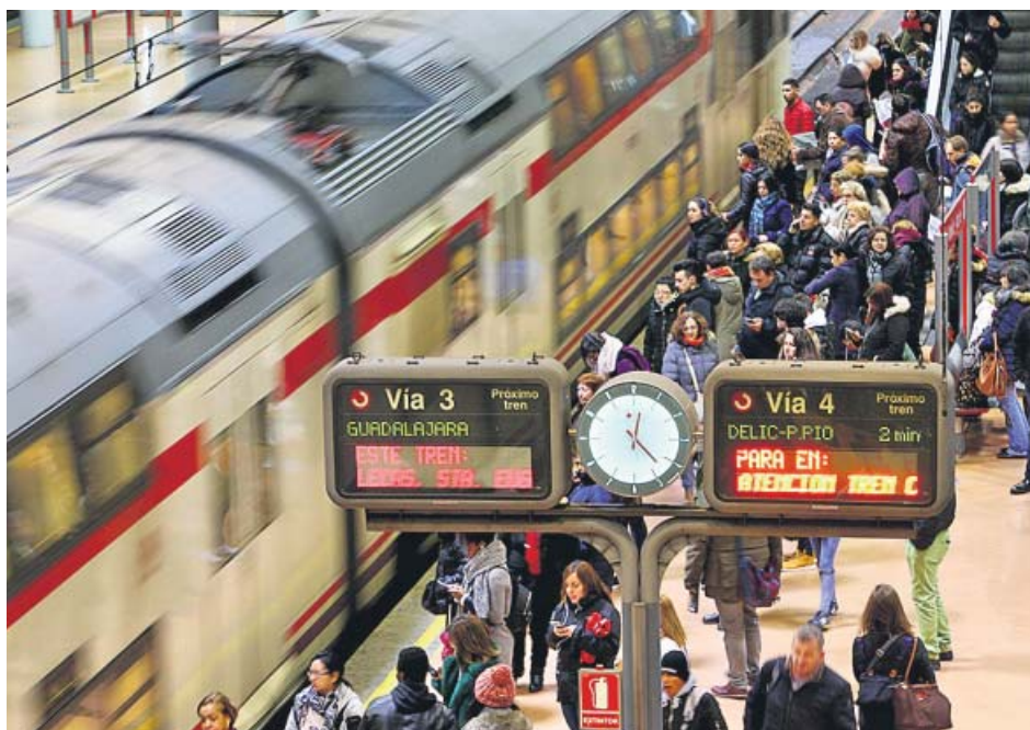
Usuarios de Renfe esperan en el andén de la estación de Atocha para coger el tren.

En el mismo texto en que arremetieron contra los porcentajes establecidos por el Gobierno, recordaron que estos mínimos «son similares a los impuestos con ocasión