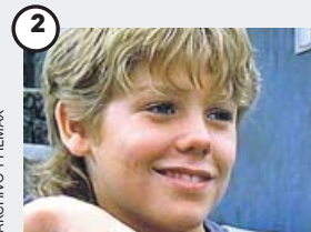
2 Jason J. Richter

Su carrera despegó con el Óscar por El piano , en 1993. Aunque siguió trabajando, su regreso a la primera línea fue a partir del año 2000 como Pícaro en la saga X-Men . Ahora está en cartelera con El secreto de las abejas .