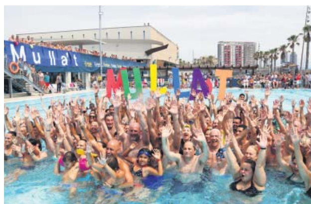
L'acte que va tenir lloc al Club Natació Atlètic-Barceloneta.

El president de la Generalitat, Quim Torra, que va as-