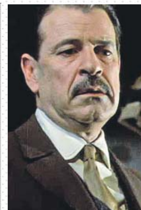
Un fotograma de la serie La huella del crimen.

Por episodios como El crimen de las estanqueras de Sevilla (Ricardo Franco), Jarabo (Juan Antonio Bardem) o El crimen del capitán Sánchez (de Vicente Aranda, quien planeó su Amantes como un capítulo de la serie) desfilan policías brutales, psicópatas de clase alta, militares que violan a sus hijas y confidentes mezquinos, habitantes