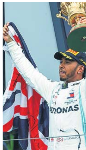
Lewis Hamilton tras su victoria en Silverstone.

Una defensa numantina del monegasco, unos arreones al límite del reglamento (como casi siempre) del neerlandés y la grada de Silverstone chillando de emoción, al igual que los miles de aficionados