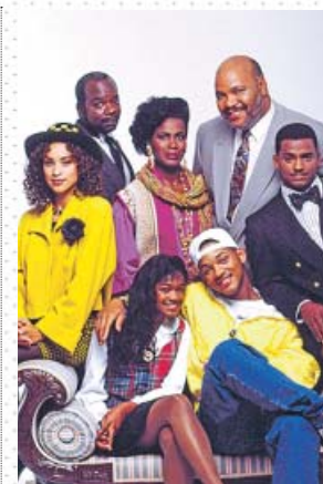
La familia protagonista de El príncipe de Bel-Air.

cierta edad tendrán que sobreponerse al recuerdo de sus reposiciones en los mediodías de Antena 3. Entonces, ¿por qué la recomendamos? Muy sencillo: porque El príncipe de Bel-Air nos sigue haciendo gracia. Si bien Smith se reveló aquí como un actor muy solvente (y no solo cómico), el show no sería lo mismo sin los secundarios, empezando por James Avery como el tío Phil. Asimismo, su humor amable da envoltorio