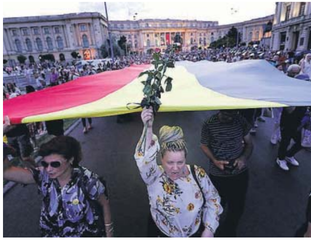
Protestas en las calles de Bucarest contra la Policía del país.