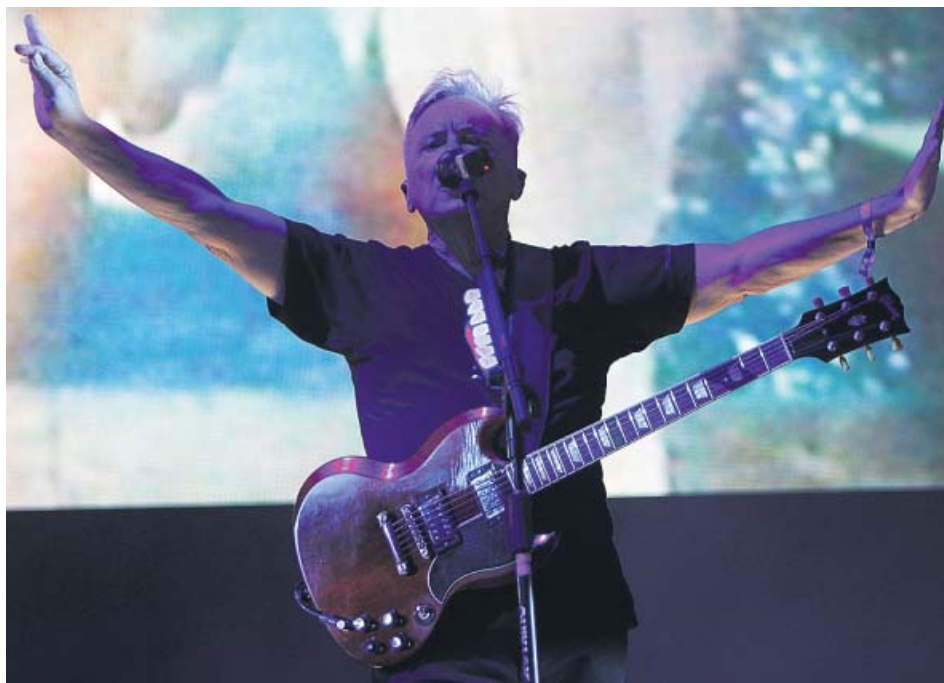
El cantante y guitarrista Bernard Sumner, de New Order, en el festival Low de Benidorm.

El Low Festival de Benidorm despidió ayer su edición 2019. Si la primera jornada cumplió con creces las expectativas, la segunda la superó. El sábado, cuando se colgó el cartel de entradas agotadas, casi todas las miradas estaban puestas en New Order, la banda británica cuyo rock alternativo y electrónico fue una referencia mundial en los ochenta. Los de Bernard Sumner se entregaron a un público que cantó y bailó todo lo que se le ofreció. ●