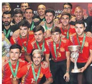
Luis Rubiales con los sub-19 campeones europeos.

La selección española sub-19 fue recibida con honores en el aeropuerto de Madrid-Barajas Adolfo Suárez nada más aterrizar desde Armenia, donde el sábado derrotaron a Portugal (0-2) para levantar el octavo título en esta categoría y consagrar a una generación, la del 2000, que ya fue cam-