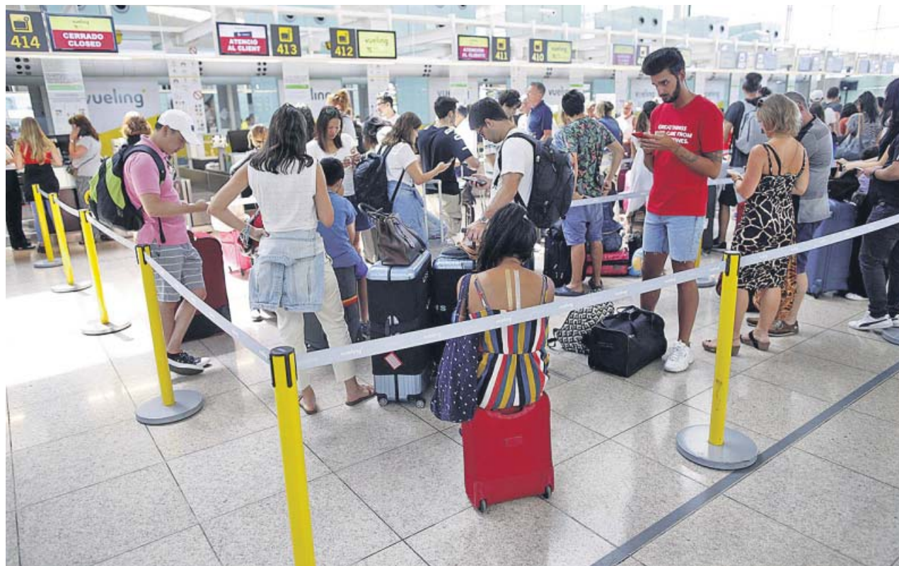
Un grupo de pasajeros espera para facturar en el aeropuerto de Barcelona-El Prat, ayer.