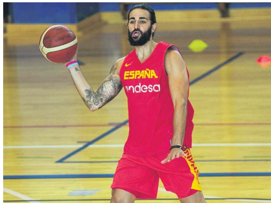
Ricky Rubio en el entrenamiento de ayer de la selección española de baloncesto.

Marc Gasol, Willy y Juancho Hernangómez y Ricky Rubio ya están al 100% a las órdenes de Sergio Scariolo tras haber superado las restricciones impuestas por la NBA para estos primeros días de concentración con la selección española de cara al Mundial de basket. «Tenemos que poner el objetivo muy alto, conseguir medallas», afirmó ayer Ricky, nuevo base de los Suns. «No tenemos que pensar en los que no están, somos los que estamos aquí», añadió sobre las importantes bajas. ●