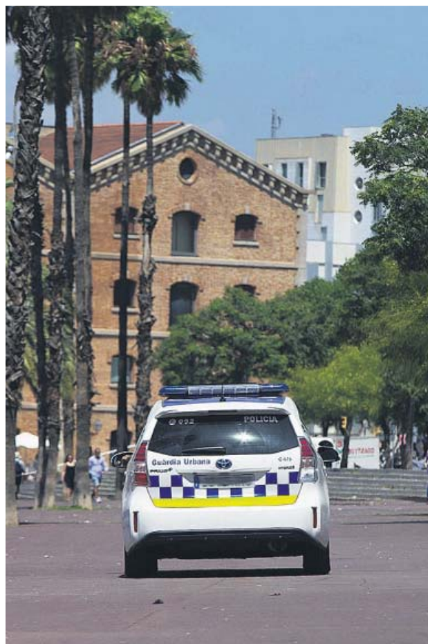
Un coche de la Urbana patrullando ayer por la Barceloneta.

El dispositivo, que llega después de un mandato municipal en el que la venta ambulante irregular se ha multiplicado —se desconoce por cuánto porque no hay un