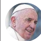
PAPA FRANCISCO Máximo responsable de la Iglesia Católica

«Cualquier forma de prostitución es una reducción a la esclavitud, un acto criminal, un vicio repugnante»