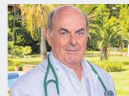
Jefe de la Unidad de Oncología de HC Marbella

«El protón ataca el tumor sin dañar tejidos vecinos»