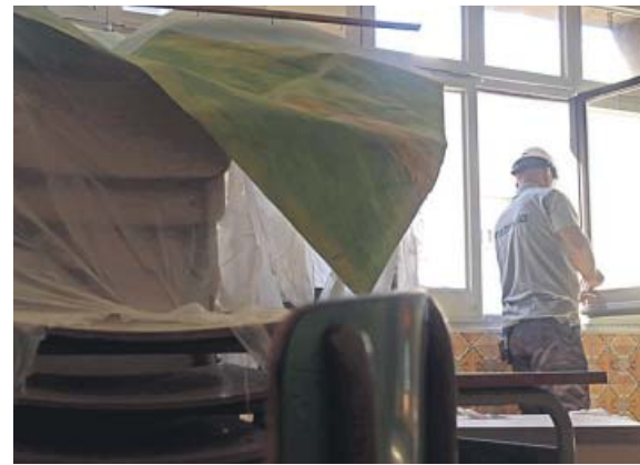
Un operari ahir al nou Institut Escola Arts de Sants.

cursaran estudis de Batxillerat , 1.140 més que els 92.584 del curs anterior. L'FP acollirà en total 123.363 alumnes, 1.334 més.