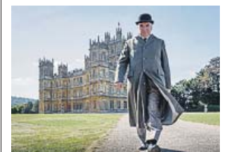
Bienvenidos de nuevo a Downton Abbey.

Para qué sirve la monarquía si no es para animar la vida y darle glamur? Algo así dice Lady Grantham cuando debaten brevemente la inesperada y deseada visita real a su mansión provincial. Y es una perfecta pregunta retórica para la propia película: ¿Para qué sirve Downton Abbey si no es para animarnos la vida y darle glamur? Más glamur que nunca. Las sedas de los vestidos son aún más brillantes, la espléndida casa se ve desde unas perspectivas aéreas muy