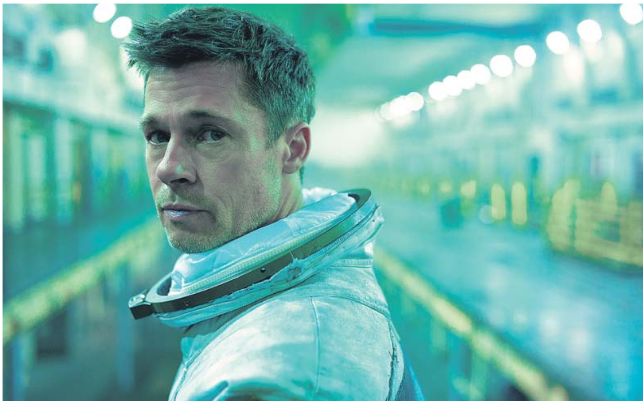
El astronauta Roy McBride (Brad Pitt) busca a su padre en la inmensidad estelar.