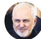
MOHAMMAD JAVAD ZARIF Ministro de Asuntos Exteriores de Irán

«Un ataque contra Irán podría conducir a una guerra total. No dudaremos en defender nuestro territorio»