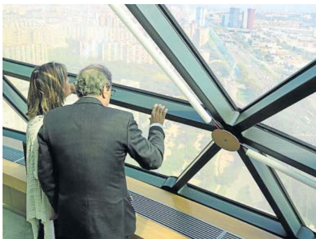
Torra i Marín, ahir, observant L'Hospitalet.

El catalanisme moderado, heredero en parte del espacio que ocupaba CiU, se está reorganizando en dos nuevas iniciativas, la Entesa Catalana de Centre y El país de demà, que, con diferentes finalidades e impulsores, coinciden en reclamar consensos y concordia. En el caso concreto de El país de demà, celebrará mañana su primer gran cónclave en el Monasterio de Poblet (Tarragona) para debatir y cerrar los documentos en los que se rechaza el «procés» porque, tal como está planteado, «perjudica» a Catalunya. Según el portavoz y principal impulsor de esta plataforma, Antoni Garrell, el documento solo avala la independencia como opción «legítima y válida si se canaliza dentro de una estrategia posibilista», es decir, «con 'seny', perseverancia y paciencia», sin «unilateralidad», con una «amplia mayoría» de la ciudadanía que lo apoye y «respetando las leyes de la UE». ● R.B.