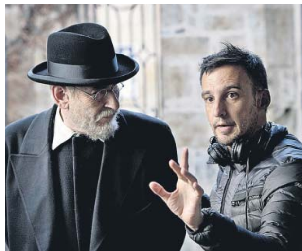
Karra Elejalde y Alejandro Amenábar, en el rodaje de Mientras dure la guerra.