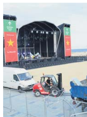
Instal·lació de l'escenari ahir al Bogatell.

El punt de Maria Cristina compta amb dos professionals fixos i amb tres parelles