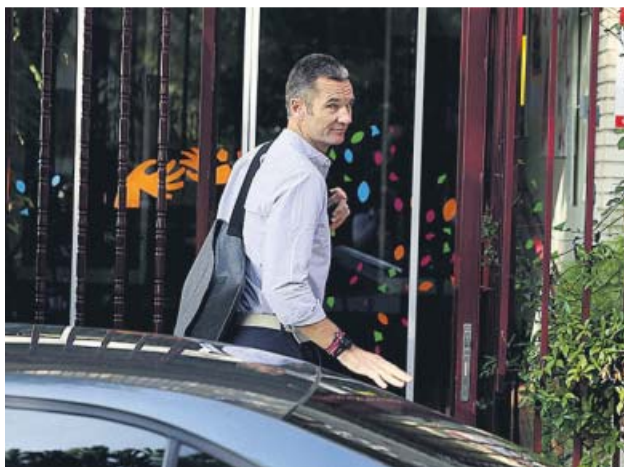
Iñaki Urdangarin, a su llegada al Hogar Don Orione.

TRANQUILIDAD Vecinos de la zona afirman que la situación en el barrio es de total normalidad