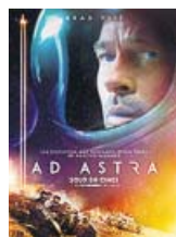
2019. Director James Gray Reparto Brad Pitt, Liv Tyler, Ruth Negga, Tommy Lee Jones

Hasta que, tras burlar a la muerte en un accidente insólito colgando de una antena gigante —píldora de acción que Gray filma con la gracia del caos inevitable,