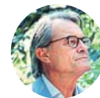
ARTUR MAS President de la Generalitat

«La direcció del PDeCAT no es decideix a Waterloo ni passa per Carles Puigdemont»