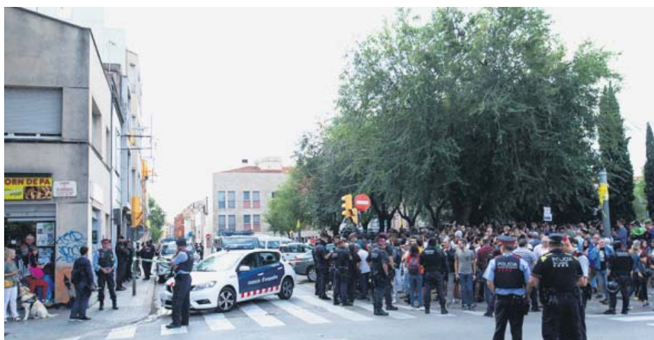
Arriba, la detención de uno de los miembros de los CDR. Abajo, concentración de protesta.