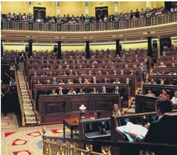
Diputados en el hemiciclo durante una sesión de control.

La legislatura finaliza con un gasto en salarios de 5,2 millones, pese a la escasa actividad: solo cinco sesiones plenarias