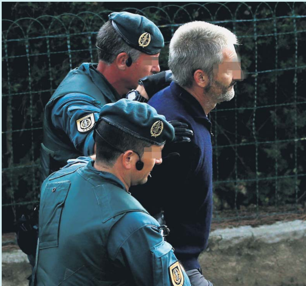
La Guardia Civil detiene a uno de los nueve miembros de los CDR en Sant Fost de Campsentelles.