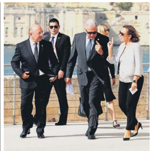
Algunos de los dirigentes que asistieron a Malta.

«Tengo un amigo que tuvo un susto gordo por mirar el teléfono móvil mientras conducía. Después de eso, lo que hace es guardar el smartphone en la chaqueta y dejarlo en la parte de atrás del coche, así no tiene la tentación de mirarlo», relata Valencia, que insiste en evitar tener el móvil a la vista, porque «que tire la primera piedra» quien no lo haya mirado teniendo delante. ●