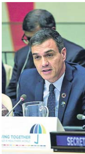
Pedro Sánchez, en la ONU.

Así, gobernantes de casi 70 países debatieron propuestas y se comprometieron a reforzar sus planes de recorte de emisiones de efecto invernadero. Aunque la primera en hablar fue la adolescente sueca Greta Thunberg, líder del movimiento Fridays For Future. Acompañada por jóvenes de varios países, aprovechó para reprochar a los líderes presentes su pasividad, culpándoles de que «estamos a las puertas de la destrucción masiva» y que de lo único que pue-