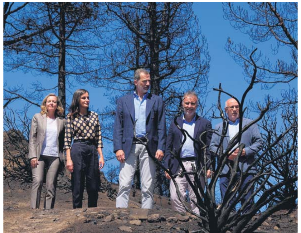
Los reyes conocieron ayer los daños del incendio de Gran canaria del pasado agosto.

La Ertzaintza comunicó que continuará con la investigación hasta esclarecer los hechos cometidos en el piso de la capital vizcaína. ●