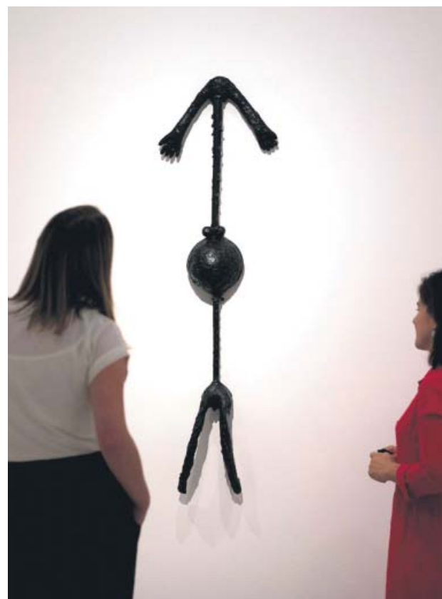
La obra Mujer encinta , de Picasso, en la exposición.

La producción artística de Alberto Dürero se ha recogido en un facsímil de edición limitada, publicado por la editorial CM, con sus obras más importantes. Esta edición de lujo (que tendrá una tirada única de 999 ejemplares cuyas 500 páginas, cosidas a mano, alcanzan los 8 kilos y medio) se presenta mañana por la tarde en la Biblioteca Nacional de Madrid. Incluye fragmentos de sus diarios, 600 imágenes y el resultado de diez años de investigación.