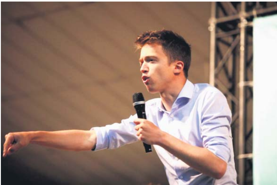
Imagen de archivo del portavoz de Más Madrid en la Asamblea regional, Íñigo Errejón.

LOS COMUNES han reafirmado su alianza con Unidas Podemos y han negado contactos con Errejón