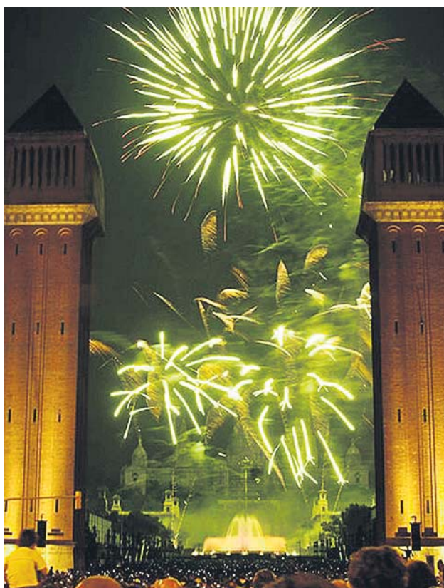
Piromusical amb les torres venecianes en primer terme. AJUNTAMENT

El Piromusical tanca avui a les 22 hores la Festa Major amb un espectacle que va atraure 90.000 espectadors el 2018