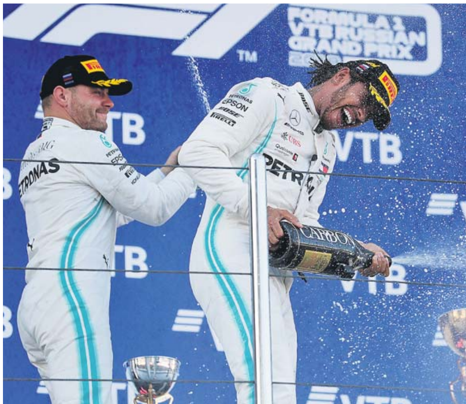
Valtteri Bottas y Lewis Hamilton celebran el doblete de Mercedes en el podio de Sochi.

El equipo italiano arriesgó en busca de un doblete, pero el tiro le salió por la culata y Mercedes lo aprovechó. Sainz fue sexto