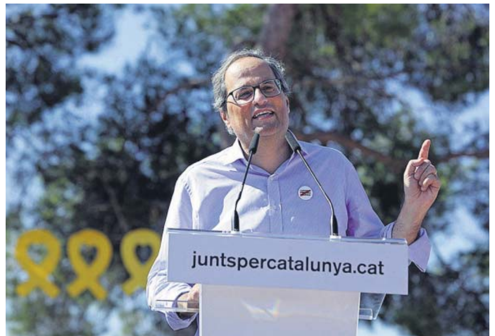
El president de la Generalitat, Quim Torra, ayer en el acto de JxCat en Lledoners.

En este sentido coincidió con él, aunque con un discurso más duro, el expresident Carles Puigdemont, quien participó en el acto por videoconferencia desde Waterloo (Bélgica) y tuvo palabras para el presidente del Ejecutivo. «El Gobierno de Catalunya nunca tendrá a ningún señor de una banda armada como los GAL [...] Existe una estrategia de querer criminalizar a todo el independentismo y eso solo admite una respuesta: que usemos las armas de la democracia, las papeletas y las urnas. Somos gente de paz».