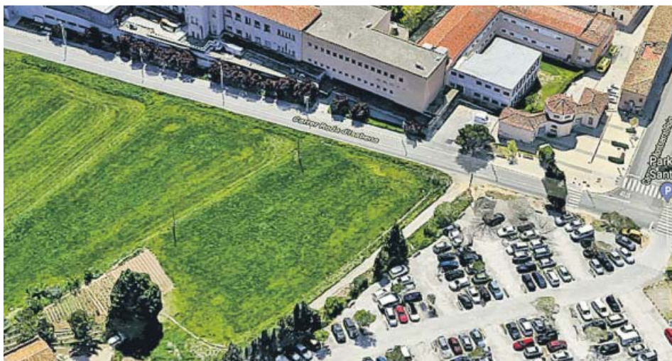
Vista aérea del parking del hospital Sta. Maria de Lleida.