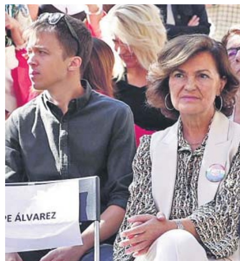
Íñigo Errejón asistió ayer a la clausura del 130 aniversario de UGT, donde coincidió con la vicepresidenta, Carmen Calvo. Pablo Iglesias intervino en la fiesta del PCE.

A pesar de ello, el PP no cedió ayer en su empeño. Casado recurrió al ultimátum al advertir a Rivera de que, sin coalición, el PP competirá con él para salvar con los votos de la ciudadanía «lo que algún