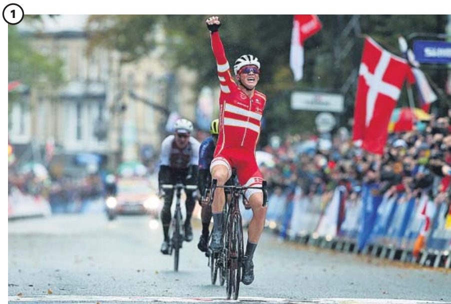
Mads Pedersen sorprende en la meta

El danés Mads Pedersen alza el puño tras cruzar primero la meta de los Mundiales de Yorkshire. El joven ciclista nórdico, de 23 años, sorprendió en el esprint final Matteo Trentin, que parecía el favorito al oro, pero tuvo que conformarse con la plata.