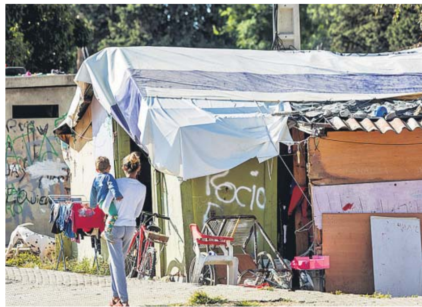
Imagen de una mujer con su hijo en brazos en un campamento de chabolas.

Es el Director General de Gobierno Abierto e Innovación Social en el Gobierno de Aragón. Fue director de Zaragoza Activa