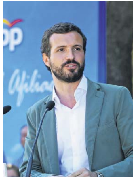
Pedro Sánchez, ayer en la fiesta de la rosa del PSC, en Gavá, y Pablo Casado, en Zaragoza.