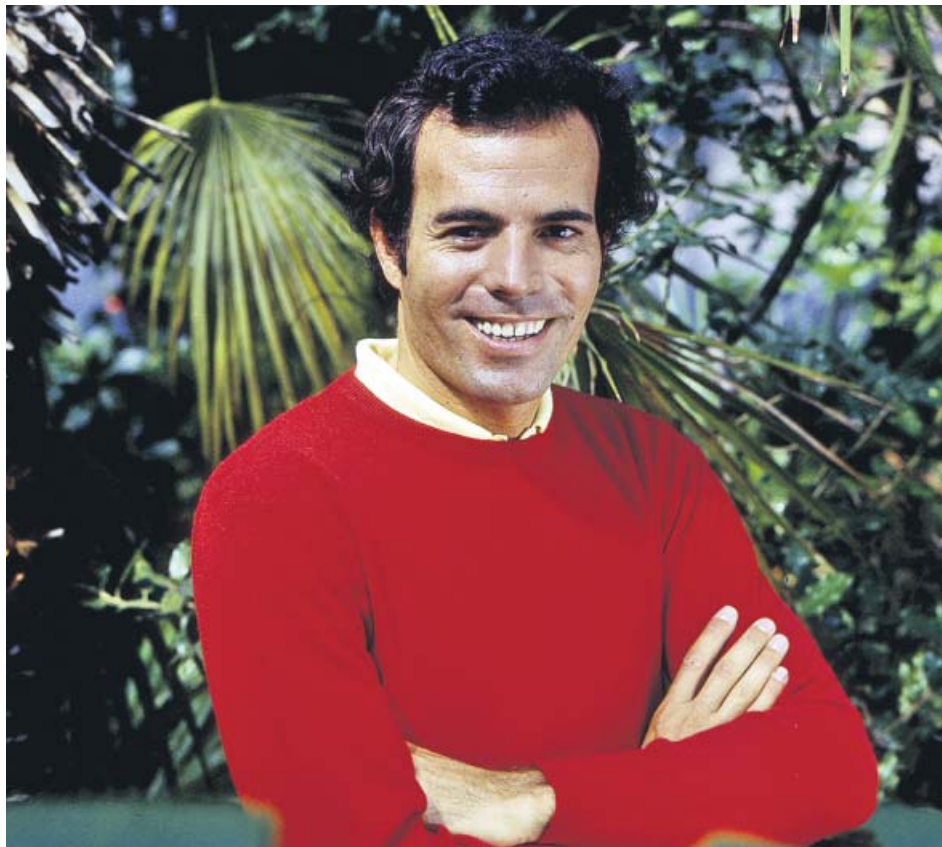
El cantante Julio Iglesias, en una imagen tomada en 1974.