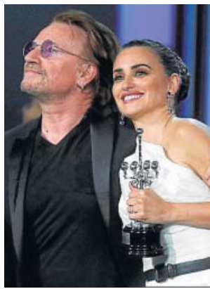
Penélope Cruz recibe el premio de manos de Bono.

El cine español también salió triunfante del Palacio del Kursaal con cuatro premios para La trinchera infinita , incluida mejor dirección, y con la catalana Greta Fernández coronada como mejor actriz por La hija de un ladrón . También la madrileña Penélope Cruz subió al escenario en uno de los momentos más emocionantes de la noche: cuando recibió de la mano del cantante de U2, Bono, el premio Donostia, un galardón con el que recordó a las mujeres que sufren «la violencia de género». ●