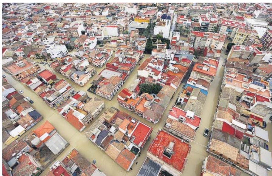
Imagen aérea de Dolores, en la Vega Baja alicantina, tras la última gota fría.