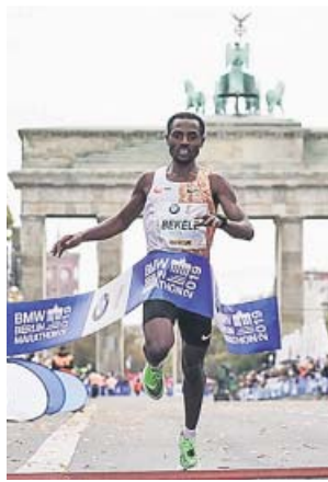
Bekele cruza la meta con casi récord: 2h 01: 41.

Justo un año después de su récord, Kipchoge encontró en el maratón de Berlín unas piernas casi tan rápidas como las suyas. Bekele, el histórico atleta etíope, una leyenda en los 5.000 y los 10.000 a quien siempre se le atragantó esta prueba, resucitó en una carrera de infarto, pues a