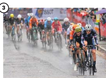
Una carrera bajo la tormenta

Pedersen posa en el podio de Yorkshire con su maillot arcoíris junto a Trentin (izq.), no demasiado satisfecho, y el suizo Stefan Küng, que se colgó la medalla de bronce.