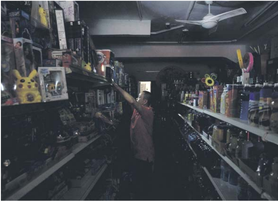
El dueño de una tienda en Santa Cruz coloca luces provisionales durante el apagón.