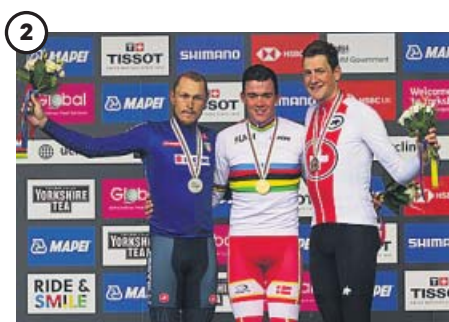
Luciendo el nuevo arcoíris

El danés Mads Pedersen alza el puño tras cruzar primero la meta de los Mundiales de Yorkshire. El joven ciclista nórdico, de 23 años, sorprendió en el esprint final Matteo Trentin, que parecía el favorito al oro, pero tuvo que conformarse con la plata.