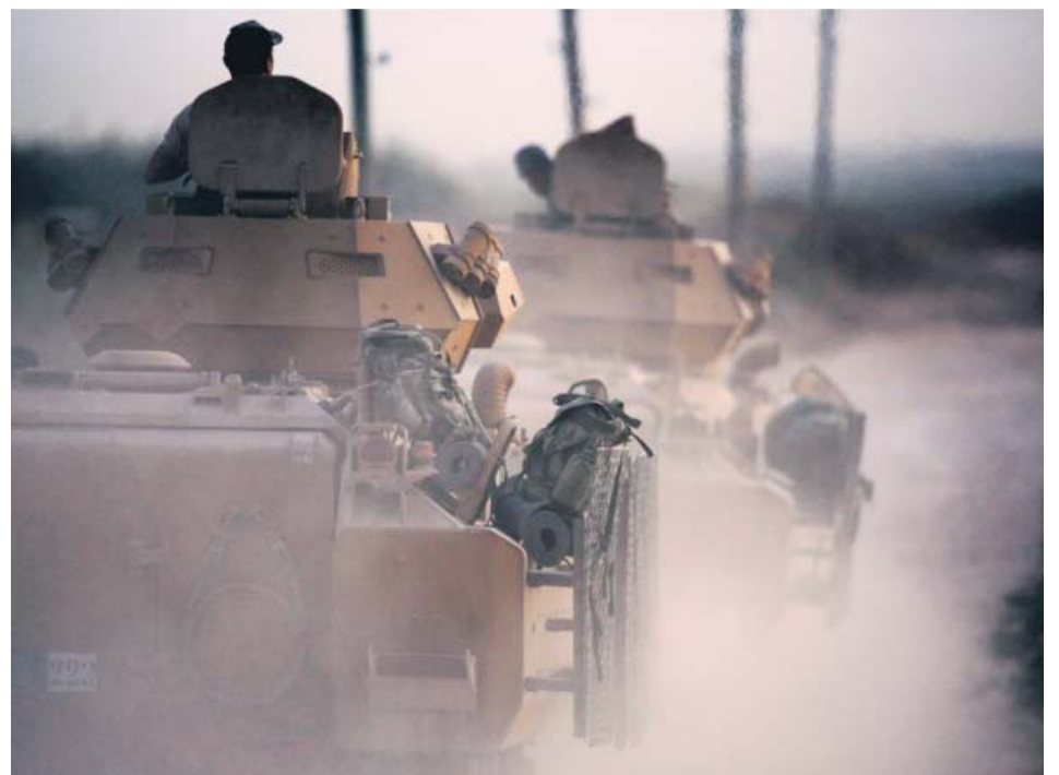
El Ejército de Turquía avanzando hacia el norte de Siria en vehículos blindados.

Un bebé de nueve meses falleció ayer por la tarde tras tener contacto con un cubo que contenía agua con lejía cuando estaba gateando en una vivienda de la localidad valenciana de Gandia. La Policía Nacional investiga lo ocurrido y si existe alguna responsabilidad en la muerte del bebé, que se encontraba con la madre en ese momento.