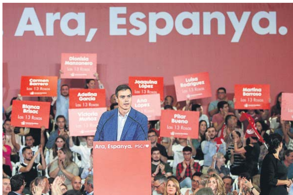
El presidente del Gobierno en funciones, Pedro Sánchez, ayer en Barcelona.

EVITA advertir del 155 o la Ley de Seguridad aunque Torra responderá a la sentencia con «autodeterminación» DESPRECIA PACTOS con el PP, Cs, Podemos o Más País y pide votar al PSOE como única forma de «desbloquear»