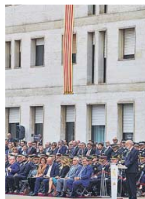
Celebración ayer de la patrona de la Guardia Civil.

La crisis entre los dos cuerpos se produjo justo antes de que se conozca la sentencia del procés y cuando las fuerzas de seguridad están transmitien-