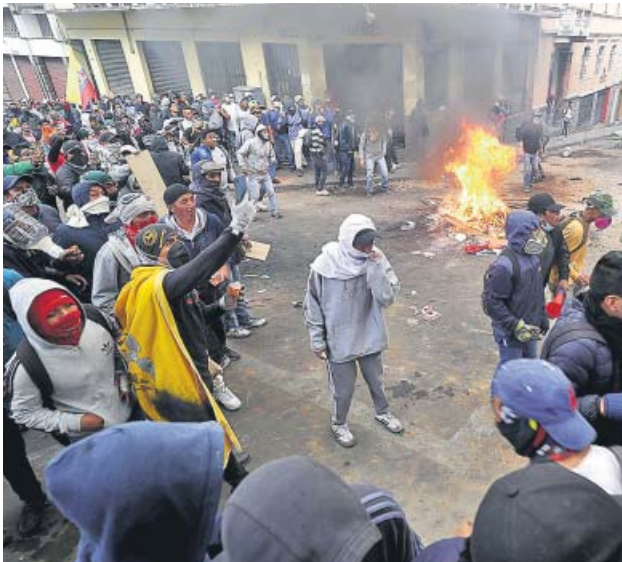
Manifestantes enfrentándose a la policía en Quito.

La crisis por la subida de combustibles alcanzó ayer otro punto álgido, con choques entre policía y manifestantes