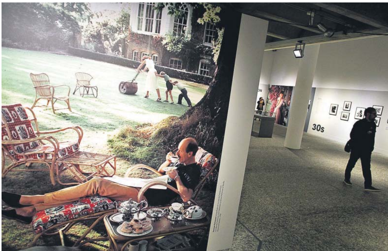
Un hombre pasea por la exposición retrospectiva Norman Parkinson: siempre con estilo.

Será a mediados del mes de octubre cuando la más flamenca del dúo del Azúcar Moreno tenga consigo la resolución judicial sobre el robo que todo el mundo cuestionó. Dicen que habrá sorpresas importantes. ●