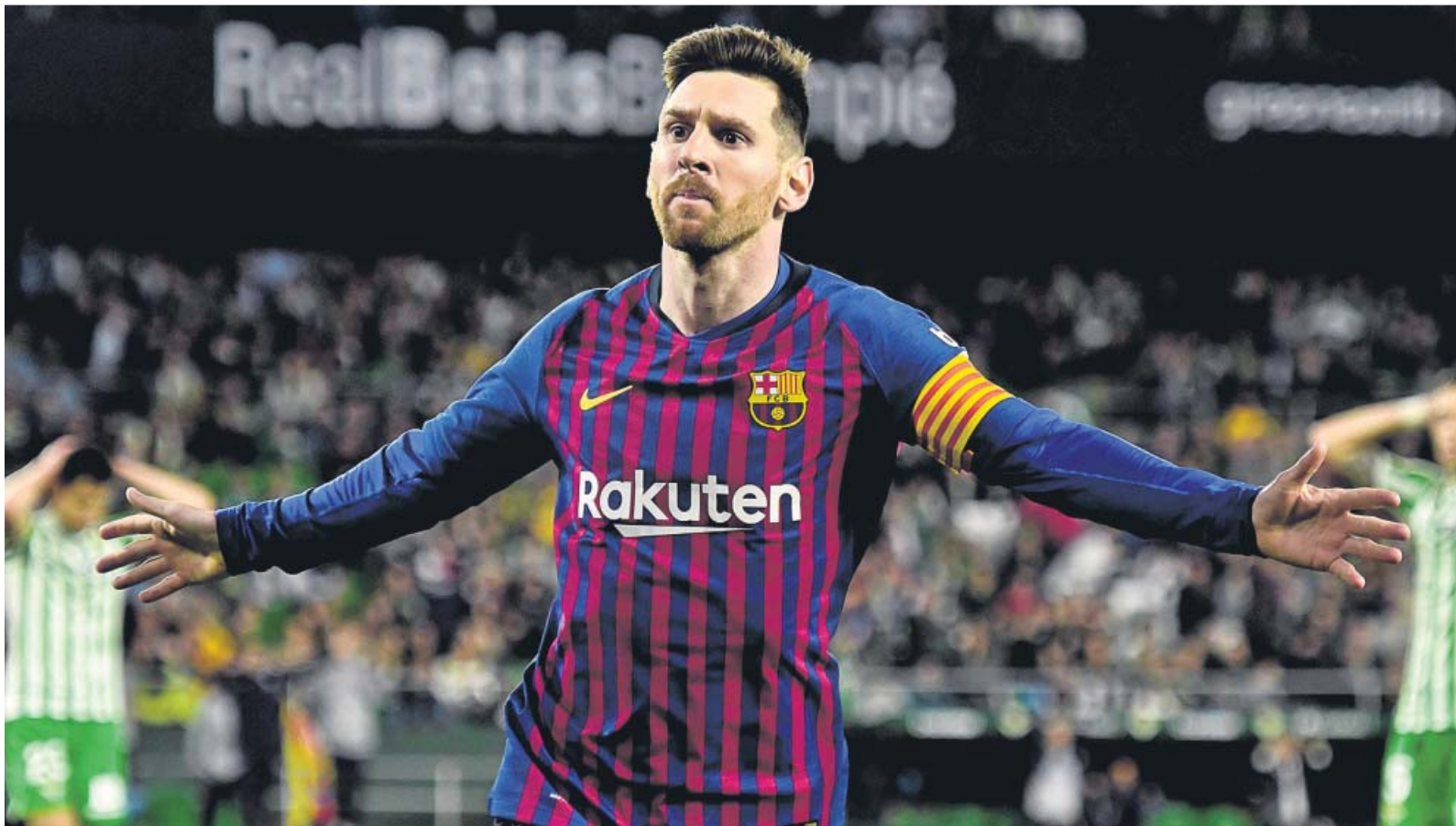
Messi, durante un partido de la pasada temporada.