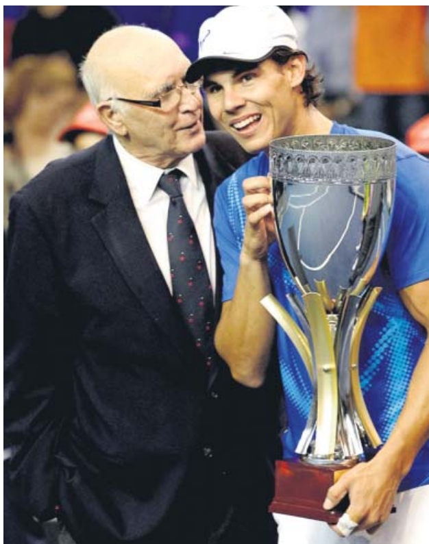
A la izquierda, Gimeno levantando su Roland Garros, en 1972. A la derecha, con Rafa Nadal.