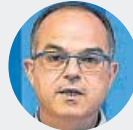
Jordi Turull 12 años de prisión