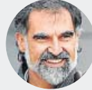
Jordi Cuixart 9 años de prisión