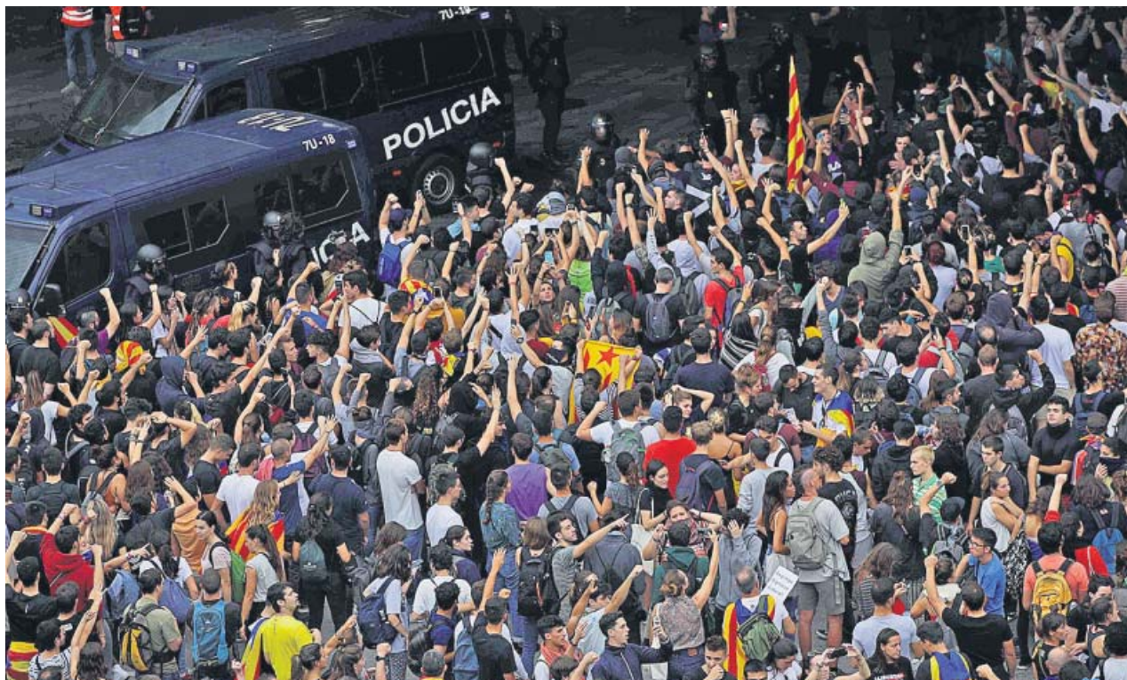
Vista del aeropuerto de El Prat, que ayer concentró la mayor protesta independentista por la sentencia del procés .

La intervención, sin turno de preguntas, de Sánchez se produjo pocos minutos después de que concluyera la que, en los mismos términos, hizo el presidente catalán, Quim Torra, desde el Palau de la Generalitat. Olvidó advertencias previas de que respondería al fallo con el «derecho de autodeterminación» y aunque, como todo el independentismo, lo calificó de «venganza», «un insulto a la democracia y un menosprecio a la sociedad catalana», midió sus palabras para no cometer una ilegalidad. Pidió comparecer en el Parlament y anunció que enviará sendas cartas: una al presidente en funciones y otra al