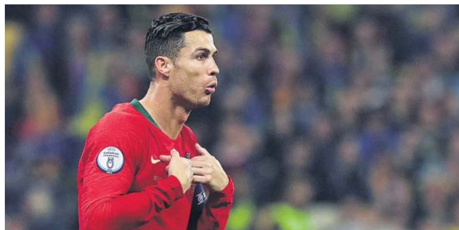
Cristiano protesta una acción durante el partido de ayer.

Sin Sergio Ramos, sancionado, el centro de la defensa estará formado casi con total seguridad por Raúl Albiol e Íñigo Martínez. ● R. D.