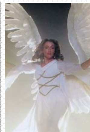
Emma Thompson, angelical en la serie.

Pero el verdadero tesoro de Ángeles en América es Al Pacino, a cargo de un único