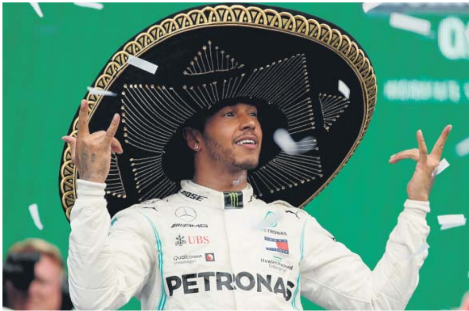
Lewis Hamilton, con el clásico sombrero mexicano, celebra su victoria.