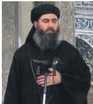
Imagen de Al Baghdadi, líder del Isis.

«Abu Bakr Al Baghdadi está muerto. Murió como un perro, como un cobarde», declaró el presidente Trump ante los medios de comunicación.