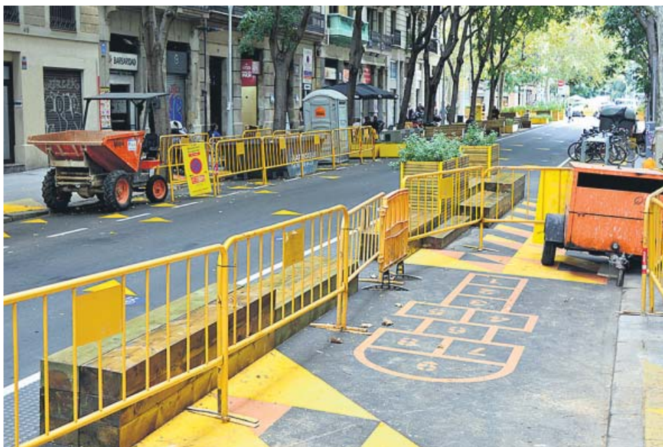
Continúan las obras de la superilla de Sant Antoni, imagen de la calle Borrell.

EL AJUNTAMENT admite que al inicio de la creación de estas áreas con menos tráfico «falló la comunicación»