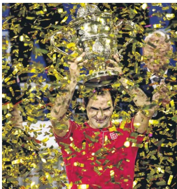
Roger Federer recibió un gran homenaje en su Basilea natal tras conquistar el título por décima vez.