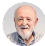
Por Diego Carcedo Periodista

A yer se celebraron elecciones presidenciales en Argentina y a la espera de los resultados, que probablemente también serán polémicos, un vistazo a la situación global del continente latinoamericano ofrece un panorama preocupante. Las manifestaciones en Chile —un país que gozaba de estabilidad política desde Pinochet— son, quizás, la prueba más elocuente de que las diferencias sociales, para las cuales los gobiernos no ofrecen soluciones y empiezan a calar en unas sociedades cada vez más agobiadas.