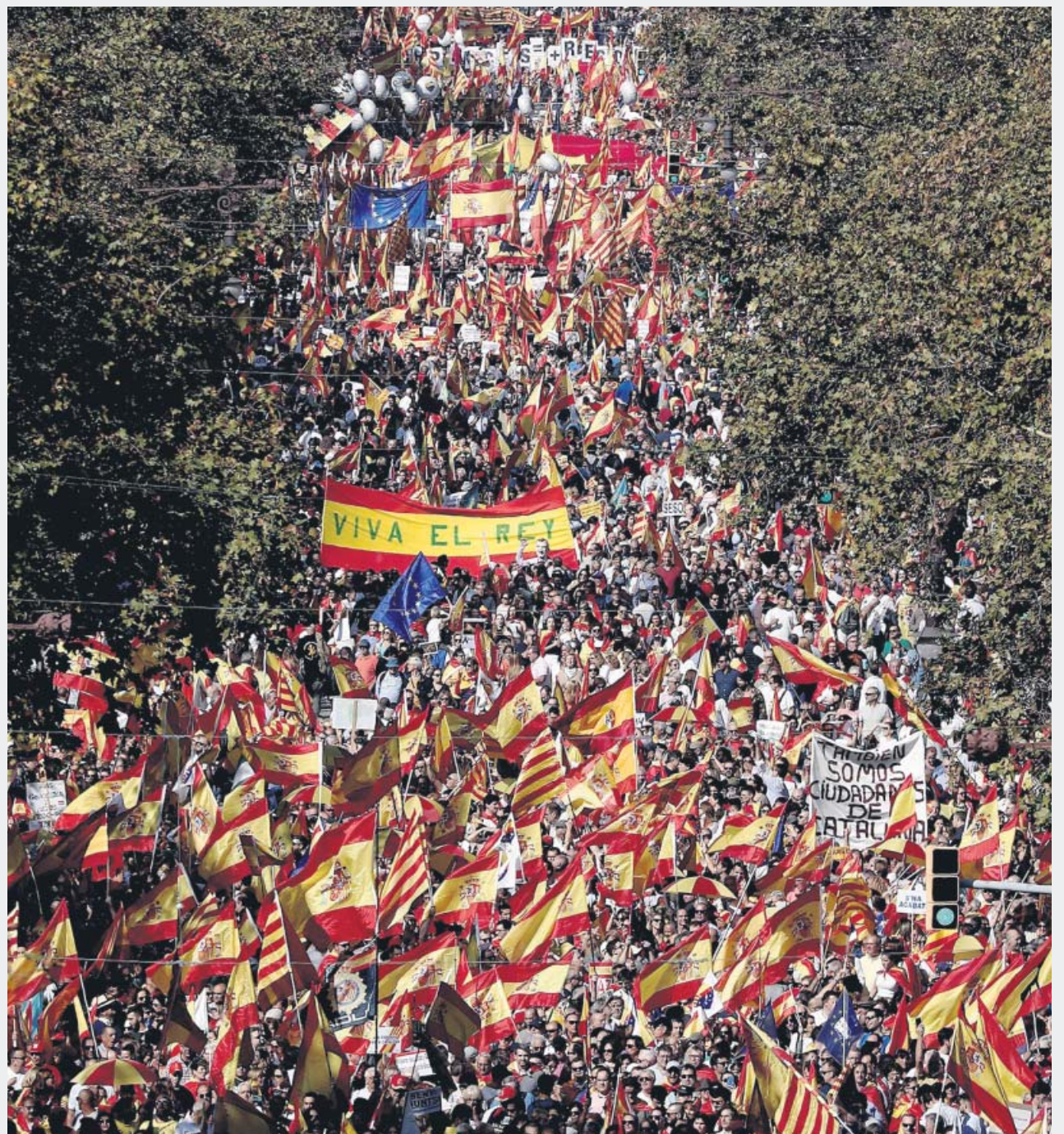
Los manifestantes ondearon ayer banderas de España y de Cataluña por el centro de Barcelona.