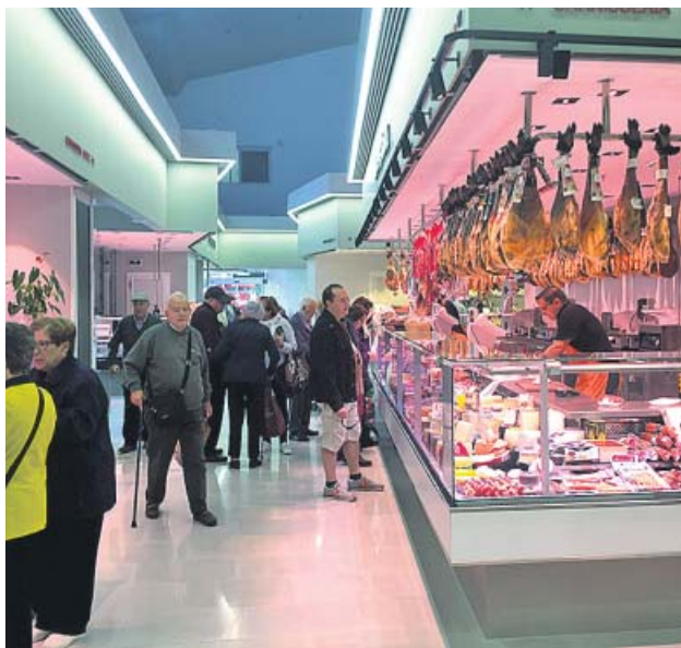
Interior del nuevo mercado de Bon Pastor. ADRIÀ MARTÍ

Los comerciantes llevaban desde 2009 en una carpa provisional. El nuevo edificio cuenta con 12 puestos y 9.340 m 2