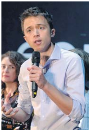
De izquierda a derecha y de arriba a abajo: Pedro Sánchez, Pablo Casado, Albert Rivera, Pablo Iglesias, Santiago Abascal e Íñigo Errejón.

tos fuertes para el PSOE en el camino al 10 de noviembre.