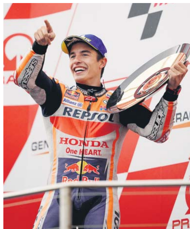
Márquez celebra en el podio su victoria en Phillip Island.

En la cilindrada menor, el italiano Lorenzo Dalla Porta logró un triunfo que sirvió para lograr de manera matemática el campeonato del mundo. ●