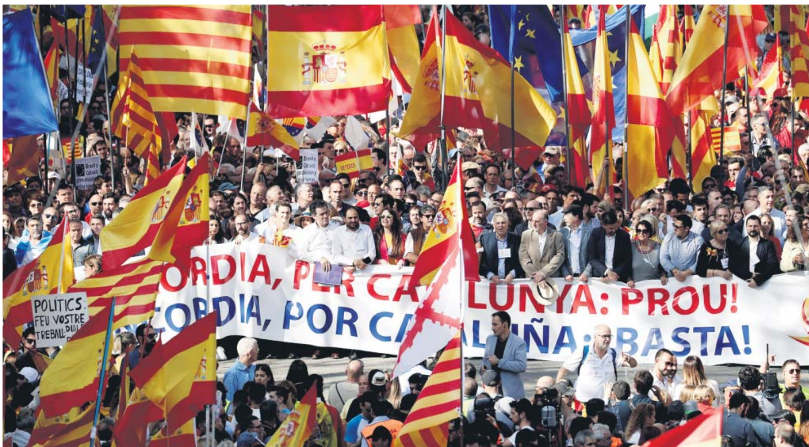
Imagen de la cabecera de la manifestación ayer convocada por Societat Civil Catalana bajo el lema: 'Por la concordia, por Cataluña: ¡Basta!'.