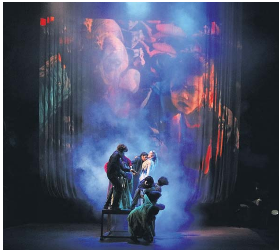
Escena del musical de Dagoll Dagom Maremar , des d'avui al Poliorama.

La Marina és una nena que es troba en un camp de refugiats perquè ha perdut els seus pares. Un personatge fantàstic que es creua en el seu camí la consola i li expli-