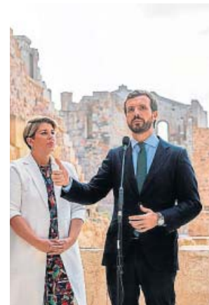
Pablo Casado, ayer, en su acto de campaña electoral en Cartagena (Murcia).

PP Pablo Casado afronta el final de la campaña centrándose en hablar de economía. Ayer, en Cartagena (Murcia), lo hizo elevando el tono contra Pedro Sánchez y acusándolo de negar la crisis para intentar «ganar dopado» el domingo, 10 de noviembre, y «adulterar las elecciones». Y subrayó con vehemencia: «La crisis está aquí. Hay una crisis como la copa de un pino». El candidato del PP lleva varios días poniendo el foco en la posible recesión económica que puede vivir España y ve a los socialistas sin reacción ante esta coyuntura.