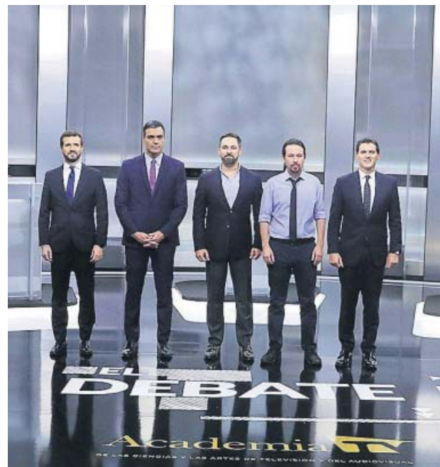
Los principales candidatos, el pasado lunes.

LA CRISIS QUE VIENE SE CUELA EN LA CAMPAÑA. Que la crisis económica que está por venir preocupa a los españoles es un hecho: en el último barómetro del CIS, «los problemas de índole económica»