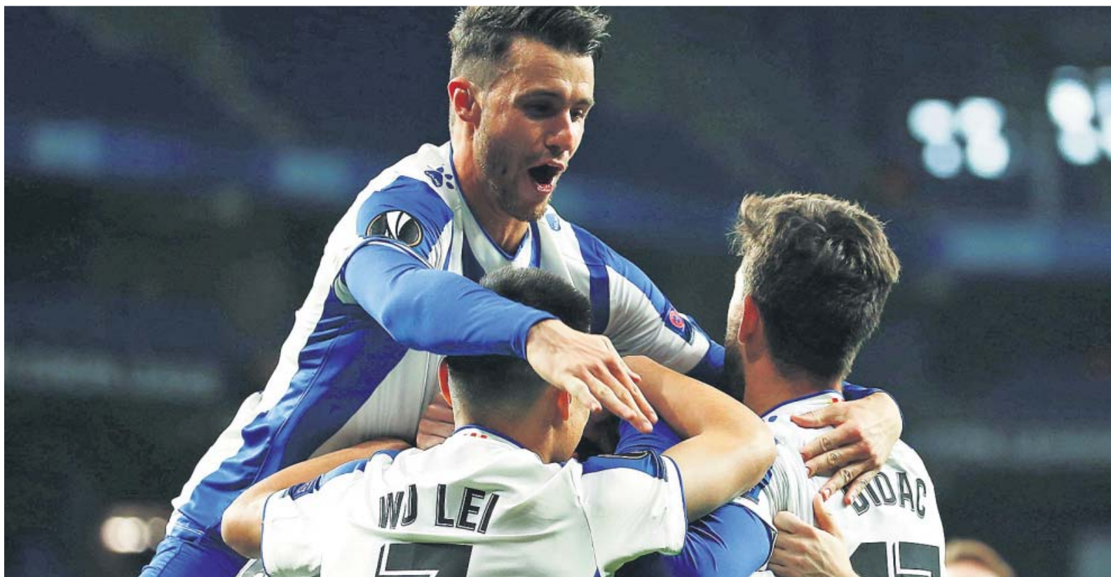
Los jugadores del Espanyol celebran uno de los goles ante el Ludogorets.