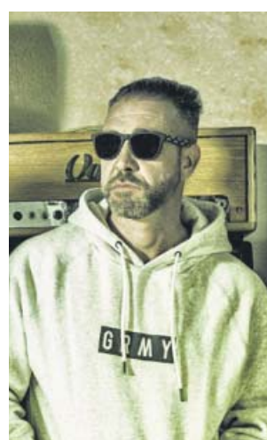
Zatu, el vocalista del grup sevillà SFDK.

Poble Espanyol. Av. Francesc Ferrer i Guàrdia, 13. Avui divendres a partir de les 20 hores. Preu: 22 euros. Més informació: cruillabarcelona.com .