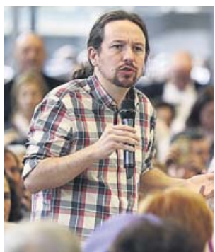
Pablo Iglesias, ayer, en su acto electoral en Bilbao.

En los últimos días, Iglesias ha redoblado sus ataques contra el PSOE y ha realizado actos en Valencia y Barcelona apelando a «muchas gente que votó socialista, que no va a aceptar que le cambien lo de 'con Rivera no' por 'con Casado sí'». Ayer fue el turno de