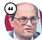
QUIM TORRA En un comunicado de la Oficina del President

«El president desmiente las informaciones y no les da ningún tipo de credibilidad. Asimismo afirma no tener ningún tipo de relación con los detenidos»