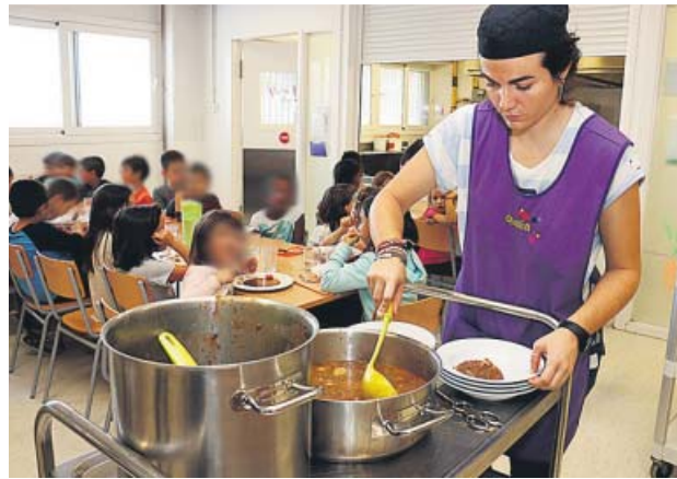
Un menjador escolar, servei amb un preu màxim de 6,20€.

Les famílies aporten anualment 148 milions d'euros, que són els que «s'estalvia la Generalitat» suggereix la FaPaC, que vol traslladar al Govern aquestes conclusions per tal que es prenguin mesures. Les quotes de material escolar sumen 65,3 milions d'euros i les de sortides escolars 78,4 milions d'euros. Les despeses s'imputen a les associacions de pares i mares mitjançant