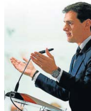
Rivera, ayer, en un acto de campaña de Ciudadanos.

Cs Albert Rivera quiere trasladar el mensaje de que, sean cuantos sean, los escaños de Ciudadanos serán decisivos tras las elecciones del domingo. El presidente naranja explicó ayer que lo importante es «para qué sirven» los diputados que se tengan. Se comprometió, en este sentido, a que el 11-N se «arremangará» para formar Gobierno, en este caso con el PP, o para «desbloquear España». Rivera hizo hincapié en un desayuno informativo en que lo que más le importa