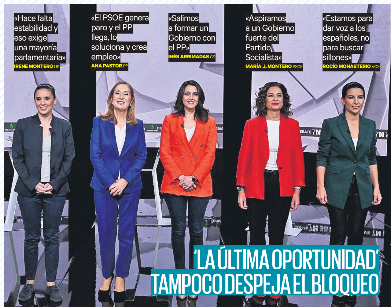
El debate de La Sexta de anoche, bautizado con ese nombre, tuvo pocas propuestas y constantes acusaciones entre las participantes. PÁGINA 2