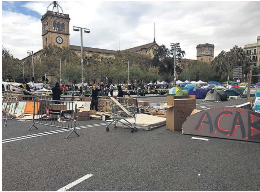
Los jóvenes acampados en la plaza Universitat reforzaron ayer con palés las barricadas que marcan el perímetro. P.C.R.

Asimismo, se ha establecido que todos los puntos de votación tengan vigilancia de los Mossos, en algunos casos dinámica y en otros estática, según informaron ayer fuentes conocedoras, tras una reunión mantenida entre los máximos mandos del cuerpo en el Complejo Central de Sabadell para cerrar los detalles del 'dispositivo Urna' para las elecciones. Con el fin de que estén disponibles todos los agentes que hagan falta, Sallent ha pedido denegar permisos por asuntos personales, horas acumuladas y guardias no presenciales. Además, los servicios de la Comisaría General de Información, del Área de Mediación, del Área de