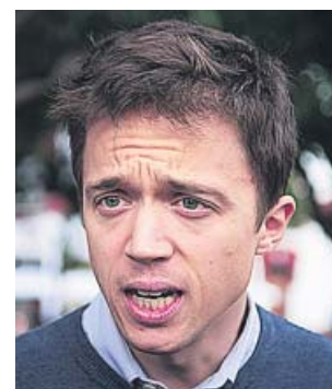
Íñigo Errejón, ayer, en el mitin que dio en Cádiz.

Además, Errejón cargó contra la indefinición de Sánchez a la hora de aclarar cuáles son sus planes para poder pactar tras las elecciones. «El PSOE tiene que dejar de hacer titu-