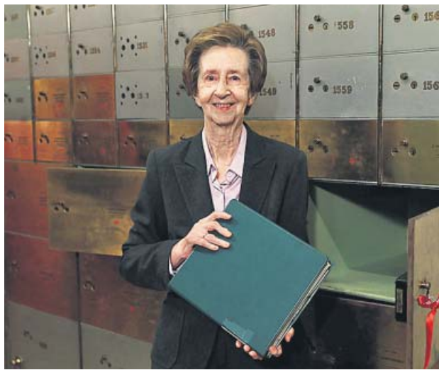
Margarita Salas, en una fotografía de archivo.

Licenciada en Ciencias Químicas y doctora en Bioquímica por la Universidad Complutense de Madrid, amplió sus estu-