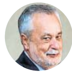
José A. Griñán

De los 21 acusados que se sentaron en el banquillo, solo dos han sido absueltos de todos los cargos que se les imputaban. Diez afrontan penas de prisión, la más alta, de 7 años y 11 meses, y el resto ha sido inhabilitado para empleo o cargo público.