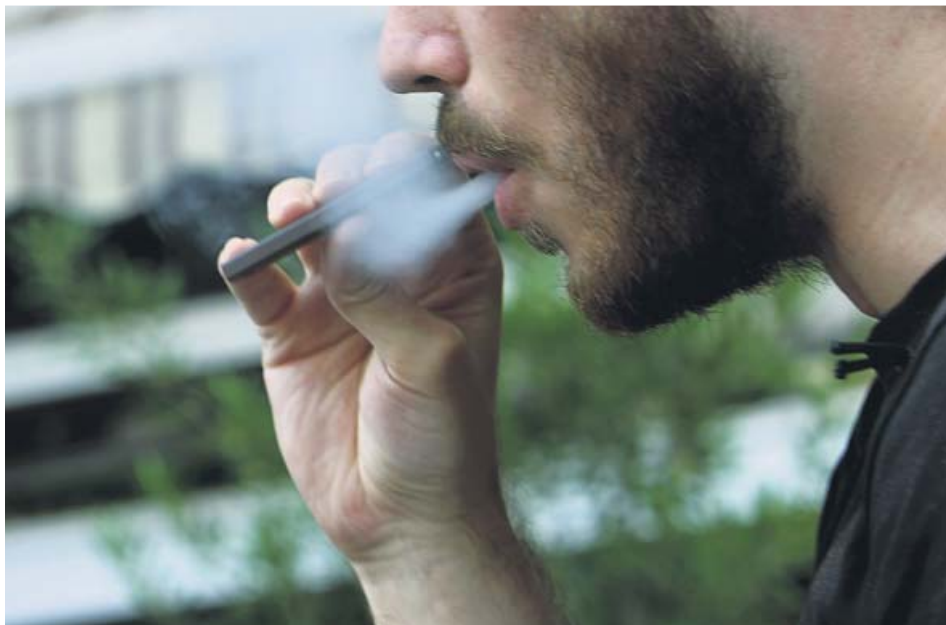
Un joven fuma a través de un cigarrillo electrónico. JORGE PARÍS