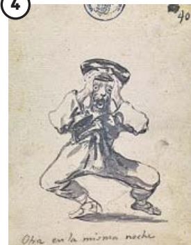
'Otra en la misma noche'

Cuaderno C, hoja 39. Pincel y aguada de tinta de hollín sobre papel verjurado. Madrid, Museo Nacional del Prado