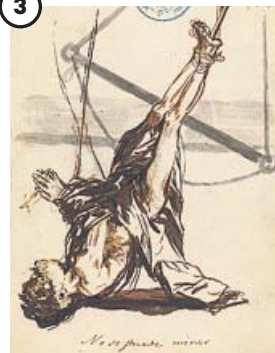
'No se puede mirar'

Cuaderno C, hoja 101. Pincel y aguadas de tinta de hollín, ferrogálica y parda (1808-14). Madrid, M. N. del Prado