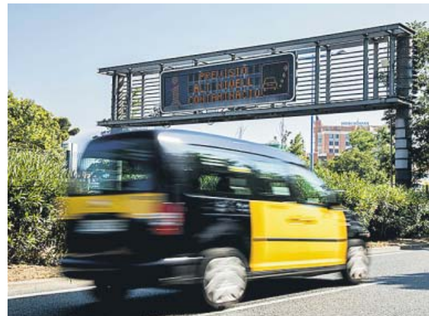
Los paneles luminosos de las Rondas de Barcelona indicarán las zonas de bajas emisiones y la prohibición de circular.