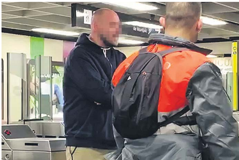
Momento, ayer, en el que el agresor de un vigilante en el metro Paral·lel se resistió a ser retenido.

El segundo caso se dio ayer a las 7 de la mañana en la estación del metro de Paral·lel. Otro vigilante fue apuñalado en un gemelo por parte de un