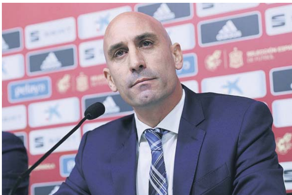
Luis Rubiales, presidente de la Real Federación Española de Fútbol.

El presidente de la Federación se explayó durante más de una hora y media tratando de explicar todo lo sucedido. Rubiales confirmó que habían hablado tres veces con Luis Enrique des-