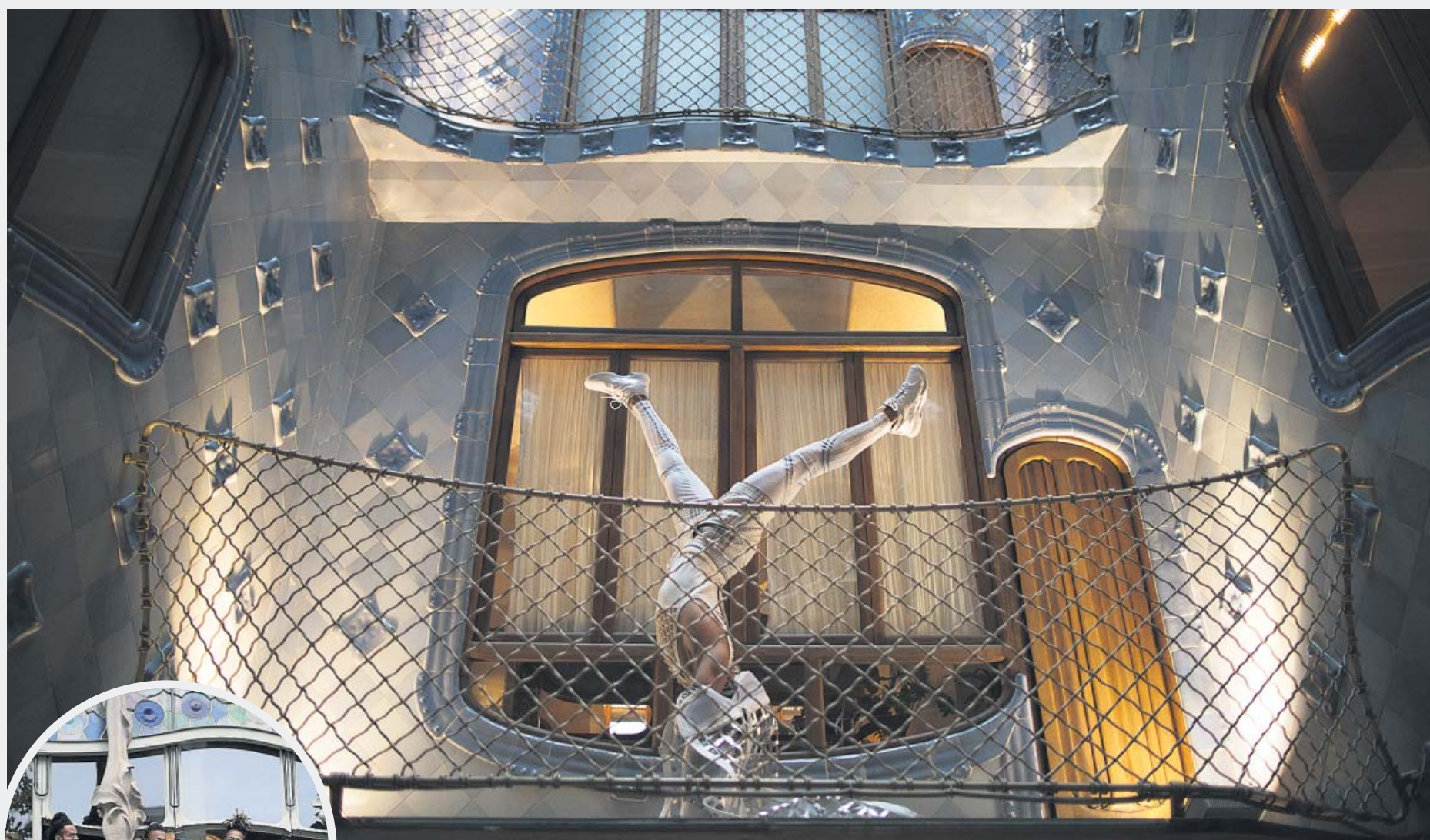
Artista de l'espectacle 'Messi10' al celobert de la Casa Batlló durant la visita promocional de dijous passat. A l'esquerra, més actuacions.