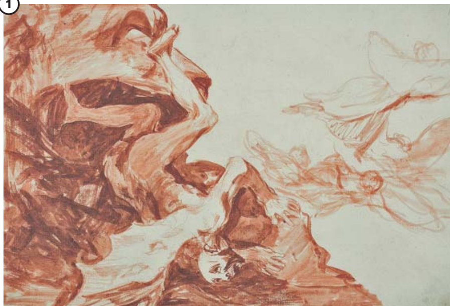
Lo que pudo ser un 'Disparate'... y no fue

La desesperación de Satán (1814-1816), dibujo preparatorio para un Disparate no grabado de Goya. Aguada roja y trazos de lápiz sobre papel verjurado. Madrid, Museo Nacional del Prado.