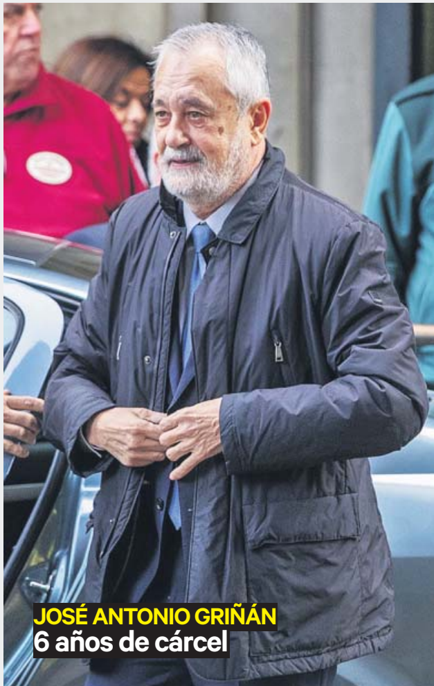
JOSÉ ANTONIO GRIÑÁN 6 años de cárcel

CRÍTICAS El PP pide a Sánchez que dimita e Iglesias dice que el bipartidismo trajo «corrupción y arrogancia» PÁGINAS 4-7