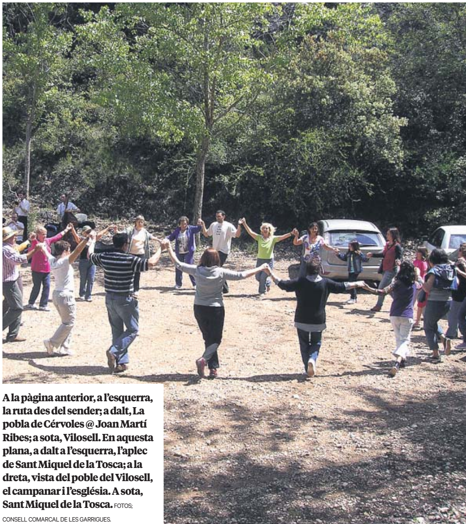
A la pàgina anterior, a l'esquerra, la ruta des del sender; a dalt, La pobla de Cérvoles @ Joan Martí Ribes; a sota, Vilosell. En aquesta plana, a dalt a l'esquerra, l'aplec de Sant Miquel de la Tosca; a la dreta, vista del poble del Vilosell, el campanar i l'església. A sota, Sant Miquel de la Tosca. FOTOS: