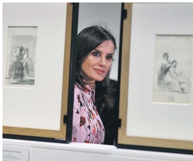
La reina Letizia, durante su visita a la exposición.

Asimismo, dijo que el museo es «la gran institución cultural de este país» y que cuenta con una «impresionante» envergadura, por eso consideró necesario que se siga contribuyendo con él como proyecto cultural. También aseguró que el apoyo de la Corona es permanente.