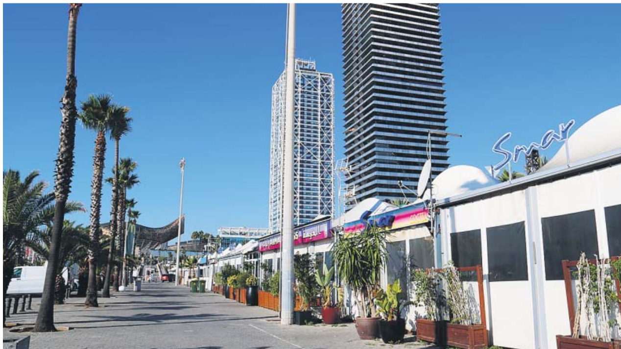
La zona de locales de ocio nocturno del Port Olímpic que desaparecerá antes del verano. ARCHIVO

CARLA MERCADER cmercader@20minutos.es / @20mBarcelona