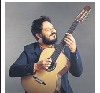
El Kanka está de gira este 2019.

Sant Jordi Club. El sábado a partir de las 21 horas. Precio de las entradas: 27 euros. theproject.es i palausantjordicat .