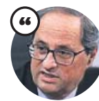
QUIM TORRA President de la Generalitat

«En estos momentos es evidente que votaría 'no' (a la investidura); estamos igual que hace cuatro meses»