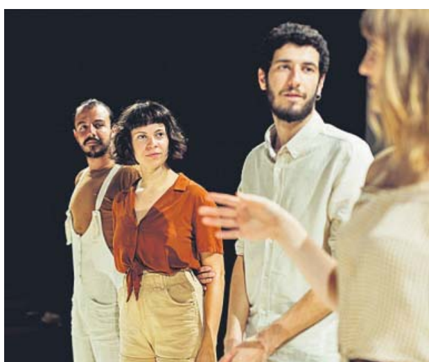
El repartiment de 'Bruels'. SALA BECKETT

Sala Beckett. Del 22 de novembre al 1 de desembre. Preu d'entre 10 a 15€. Web: www.salabeckett.cat