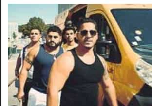
El barrio de Montfermeil y sus vecinos.

No hay malas hierbas, ni malos hombres. No hay más que malos cultivadores». Es la frase de Victor Hugo con la que Ladj Ly cierra Los miserables . Coge prestado el título de la gran obra del escritor porque su historia también tiene como escenario el barrio de Montfermeil, donde Ly creció y donde vivían los Thenardier, y porque, casi 150 años después, las condiciones de miseria siguen haciendo de esta banlieue de París un polvorín constante que solo se sal-