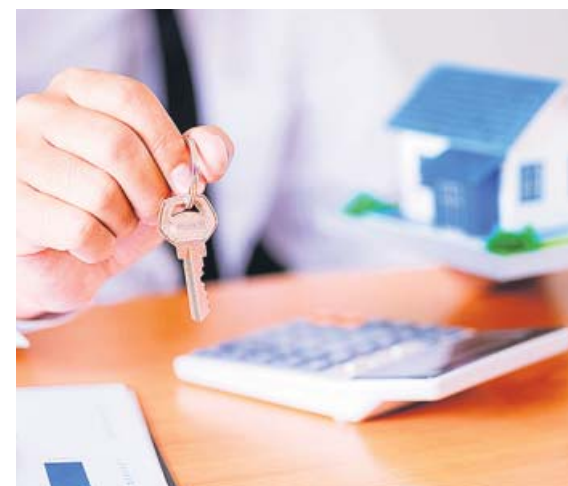
La hipoteca media en España es de 126.250 euros.

Bilbao (156,46 euros) y Sevilla (112,78 euros) forman parte por primera vez de este listado, cuya baja más destacada es la del Ayuntamiento de Zaragoza, que sale por primera vez del ranking. ●