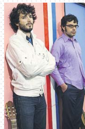
Los protagonistas de Los Conchords . HBO

Para un aficionado a la música pop, Los Conchords