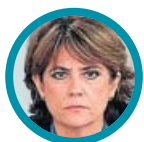
Dolores Delgado Ministra de Justicia