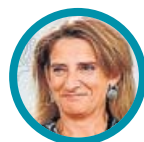
Teresa Ribera Ministra para la Transición Ecológica