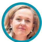
Nadia Calviño Ministra de Economía y Empresa