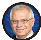
Josep Borrell Exministro de Asuntos Exteriores, UE y Cooperación

○ Ministros actuales que, en principio, continuarían en el próximo Ejecutivo