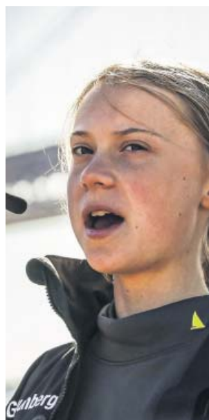
Greta, en Lisboa.

Como defensor de la ciencia por sí misma y de su valor para la sociedad, y por tanto como persona que apoya y difunde el consenso científico sobre la realidad del cambio climático antropogénico, se supone que aquí debería aclamar y elogiar a la joven Greta Thunberg. Se supone, porque si uno atiende a los medios, a la calle y a las redes sociales, parece que solo hay dos equipos a los que apuntarse: el de la preocupación por la crisis climática, pro-Greta, y el del negacionismo de la crisis climática, anti-Greta. Pues bien, aquí va una tercera opción. Vaya por delante que esto solo trata sobre la labor pública de Greta y lo que representa de cara a la lucha contra el cambio climático.