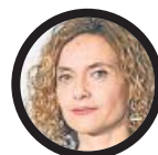
Meritxell Batet Exministra de Política Territorial y Función Pública