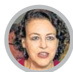
Magdalena Valerio Ministra de Trabajo, Migraciones y S. Social