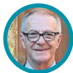
José Guirao Ministro de Cultura y Deporte