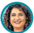
Mª Jesús Montero Ministra de Hacienda