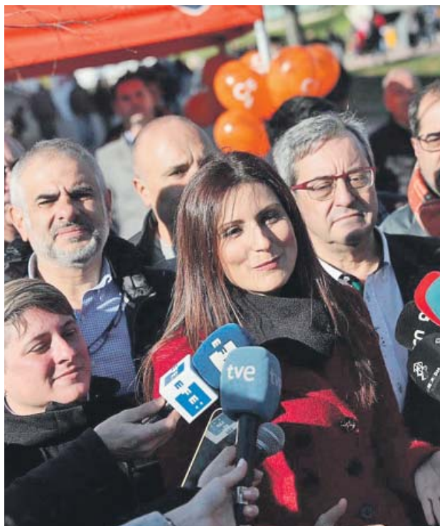
Lorena Roldán (Cs) compareciendo, ayer, ante los medios.

La ronda, que comenzará mañana a las 9:30 en el Palacio de la Zarzuela con la reunión en-