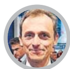
Pedro Duque Ministro de Ciencia, Innovación y Universidades