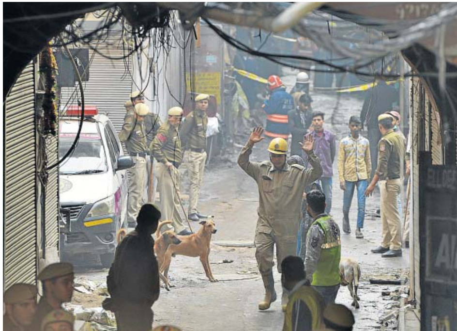
La Policía inspecciona una calle estrecha cerca del lugar del incendio en Nueva Delhi.

El ministro de Aviación Civil de la India, Hardeep Singh Puri, apuntó que «la causa inmediata» del incendio fue un «cortocircuito», aunque insistió en que hay que esperar «a que se completen las investigaciones para conocer la causa de raíz». «Muchas fábricas como esta están en edificios viejos sin elementos de seguridad contra incendios y con instalaciones eléctricas obsoletas». Tanto es así, que la Po-