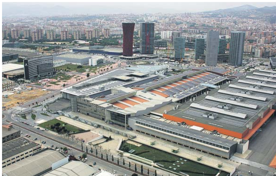
Imatge aèria de l'actual recinte de Fira Gran Via de L'Hospitalet.