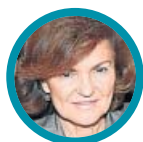
Carmen Calvo Vicepresidenta, RR con las Cortes e Igualdad