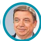
Luis Planas Ministro de Agricultura, Pesca y Alimentación