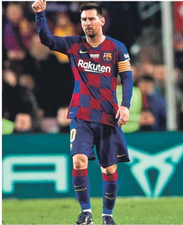
Karim Benzema celebra su gol ante el Espanyol (izquierda) y Messi durante el partido ante el Mallorca (derecha).