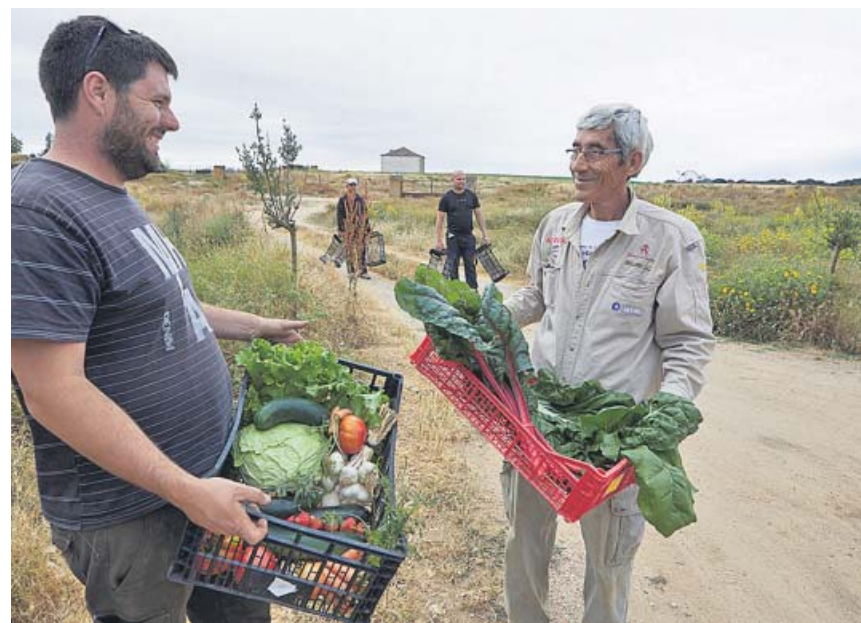
Trabajadores del mundo rural que se han beneficiado de ayudas de La Caixa.

Como resumen, el caso de Greta es ejemplo modélico del viejo adagio: cuando un dedo señala a la Luna, el tonto mira el dedo. En favor de la activista hay que decir que no se le puede negar el esfuerzo en intentar que quienes la escuchan miren a la Luna y no al dedo. Pero al mismo tiempo, ha optado voluntariamente por acaparar tal protagonismo que puede ocultar la visión de la Luna. ●