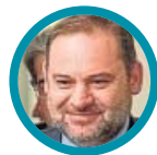
José Luis Ábalos Ministro de Fomento