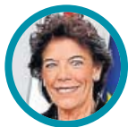
Isabel Celaá Ministra de Educación, Formación Profesional y Portavoz