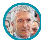
Fernando G. Marlaska Ministro del Interior