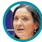
Reyes Maroto Ministra de Industria, Comercio y Turismo