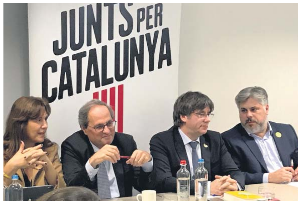
Puigdemont y Torra presidieron ayer una reunión de JxCat en Bruselas (Bélgica).