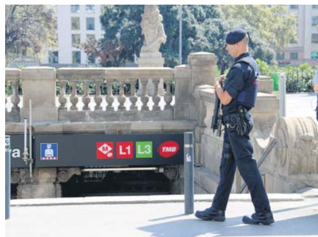
Operatiu de Mossos contra carteristes.

Una de les operacions més destacades va tenir lloc diumenge passat a Sant Andreu quan un vianant va patir la sotració del seu telèfon mòbil. Gràcies a l'aplicació de localització del terminal la víctima va poder seguir al vehicle dels lladres mentre trucava al 112 i