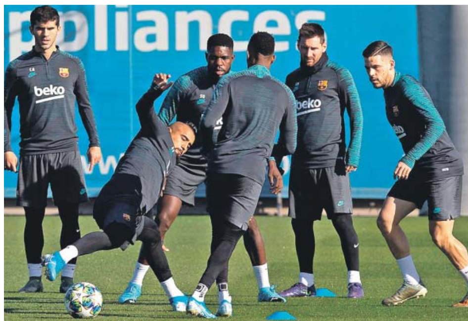
Entrenamiento de ayer del FC Barcelona de cara al partido ante el Inter de Milán.

Los italianos necesitan ganar para lograr clasificarse para los octavos