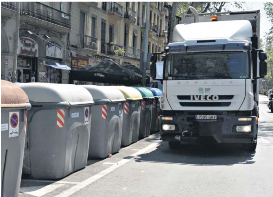
Un camió de recollida d'escombraries al costat d'uns contenidors a ronda Sant Antoni.