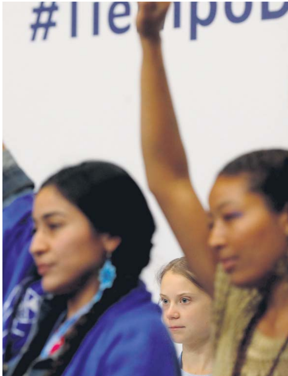
Greta Thunberg, junto a otros asistentes al acto en la Zona Azul de la COP25.