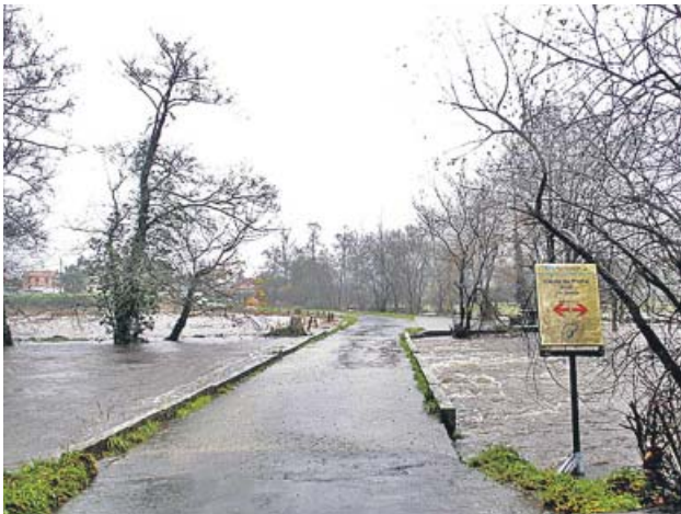
Arriba, mariscadoras faenando en la ría de Potosín (A Coruña). Debajo, un río desbordado en Vimianzo, también en Coruña.

LUIS GARCÍA LÓPEZ actualidad@20minutos.es / @20m