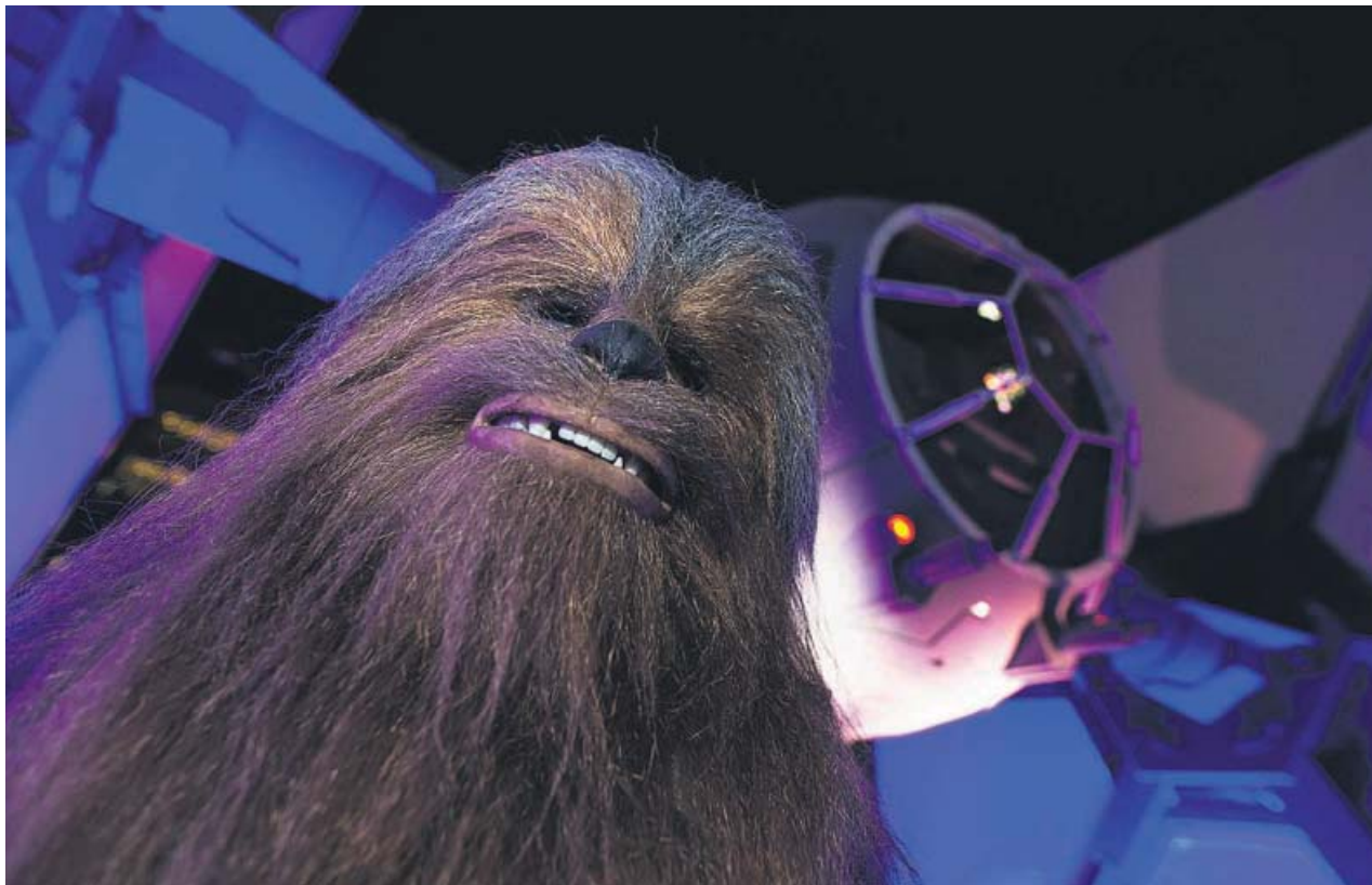
Un fan de Star Wars acude disfrazado de Chewbacca a la premiere de El ascenso de Skywalker en Colonia.

¿Cómo ve el panorama de la música urbana actual? Hay gente nueva que viene pegando fuerte, y también quienes vienen con un discurso más vacío, de carpe diem , que no me representa y me parece de usar y tirar. Después aparecen otros subgéneros, como el trap , que me gusta. Los artistas que tengan algo que decir y un discurso más elaborado serán los que perduren en el tiempo, y los que lo hagan por fama o seguidores supongo que se diluirán. ●