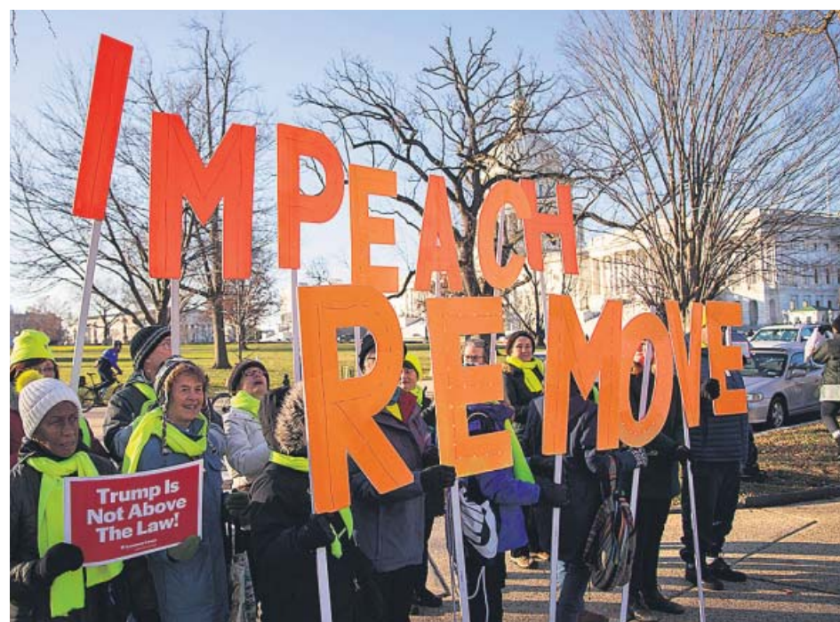
Varios manifestantes se reúnen en las cercanías del Capitolio en Washington.