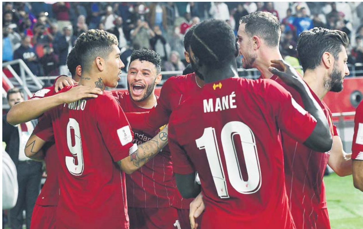
Los jugadores del Liverpool celebran el segundo tanto del equipo inglés, que les metía en la final del Mundialito.

El brasileño Roberto Firmino, con un tanto en el minuto 91, le dio la victoria (1-2) al Liverpool ante el Monterrey de México y el equipo de Klopp pasó a la final del Mundial de clubes. Firmino (m.91) y el guineano Naby Keita (m.12) anotaron por el Liverpool, y el argentino Rogelio Funes Mori (m.14) lo hizo por el Monterrey, que tuvo varias ocasiones para poner en más dificultades al equipo red . Ahora, en la final, el Liverpool se enfrentará el sábado al Flamengo, campeón de la Copa Libertadores, y que ganó su partido al Al Hilal saudí. ●