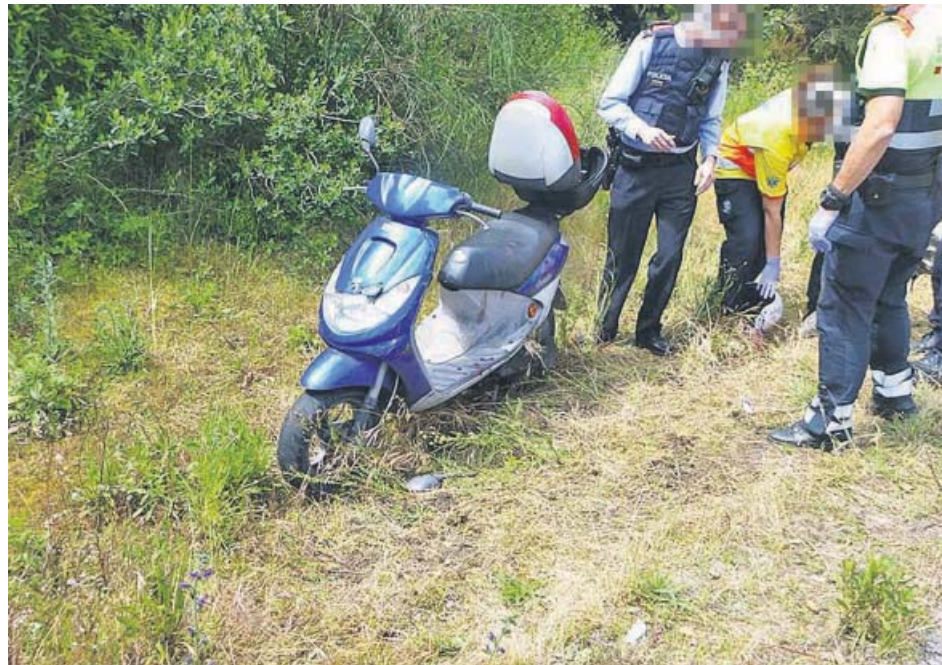
Una imagen de archivo de la moto de un conductor bebido que se salió de la vía.

Los datos, además, reflejan que en los últimos años ha habido un estancamiento en la reducción de víctimas