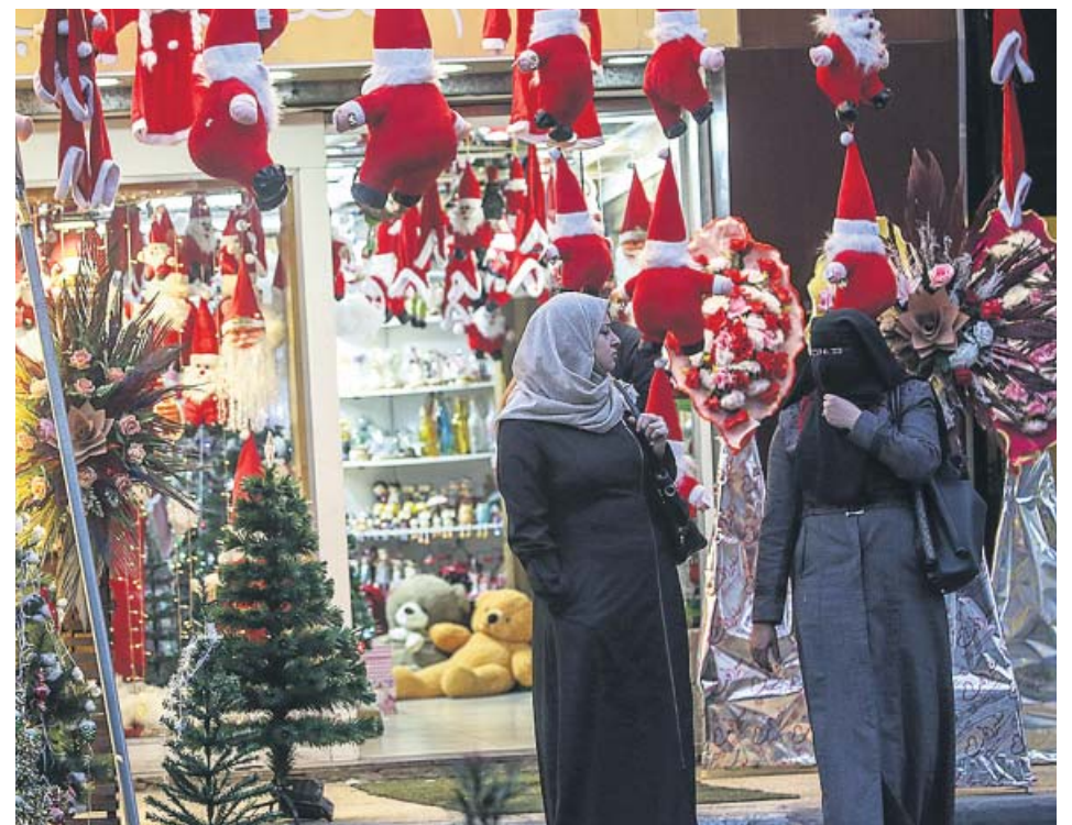
Dos mujeres pasean junto a un mercadillo navideño en Gaza.

Casi el 50 % de los 700 juguetes que se han remitido este año por considerarse sospechosos al Centro de Investigación y Control de la Calidad, dependiente de la Dirección de Consumo, tienen etiquetado o instrucciones deficientes, el marcado de seguridad europeo incorrecto o fallos de seguridad.