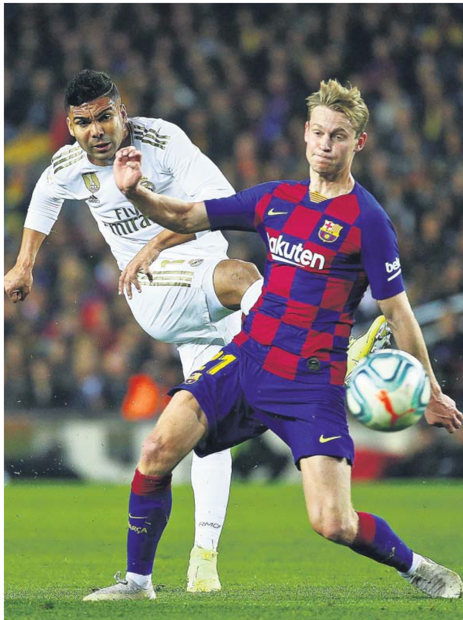
Casemiro dispara a puerta ante Frenkie de Jong en el Clásico.

Un pase de Benzema lo sacó como pudo la zaga azulgrana, y los centros se sucedían sin parar con los de Valverde achicando balones como podían. En otra peligrosa internada de Ka-