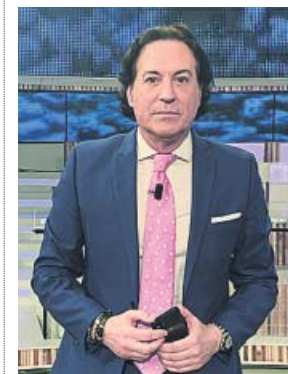
El periodista deportivo Pipi Estrada , s.o.