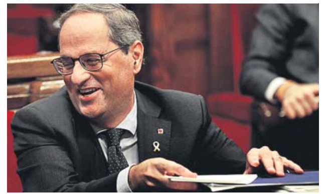
Quim Torra, ayer, en el pleno del Parlament.

la autodeterminación. Riera, no obstante, advirtió al president del «riesgo» de que la conversación con Sánchez sirva para «normalizar relaciones en los marcos estrictamente constitucionales y autonómicos». ●