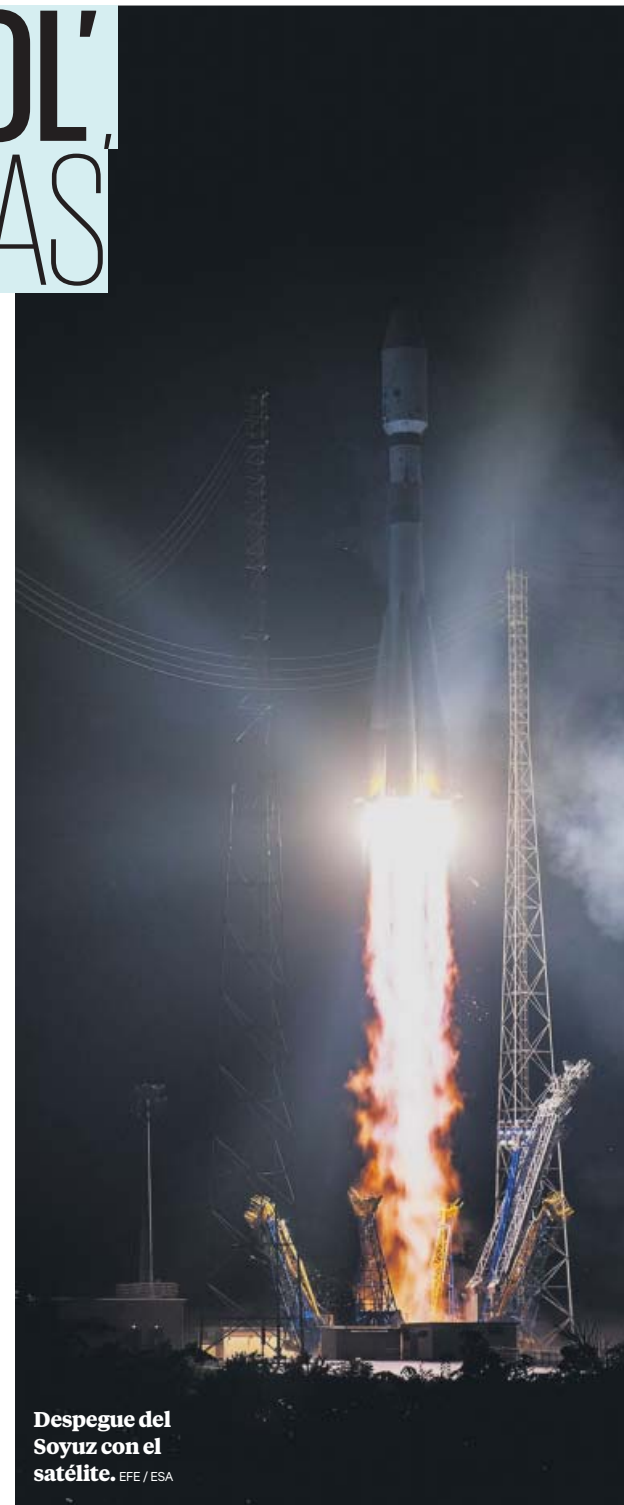
Despegue del Soyuz con el satélite.

UN PLAN A LARGO PLAZO. Este proyecto ha sido posible gracias a la colaboración de varios Estados miembros de la ESA –concretamente Austria, Bélgica, Francia, Alemania, Hungría, Italia, Portugal, España, Suecia, el Reino Unido y Suiza– con un pormenorizado reparto de funciones. Cheops no es más que el primer paso de la ambiciosa estrategia de exploración de exoplanetas de la ESA, que