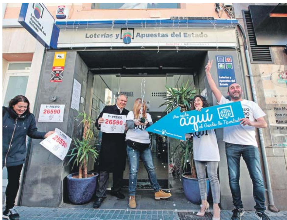
Arriba, un grupo celebra haber ganado el Gordo en el centro aragonés El Cachirulo de Reus. Abajo, otra celebración del mismo premio en Salou.