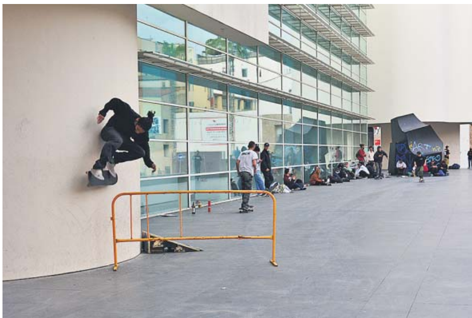
Los skaters aprovechan la arquitectura del Macba para hacer piruetas.

RECLAMAN que la plaza se remodele para delimitar la zona de 'skate' y el Ajuntament afirma que lo estudiará