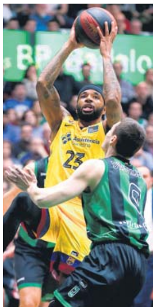
El estadounidense Malcolm Delaney lanza a canasta.

Parciales por cuartos: 14+26+20+20; 21+25+29+20.