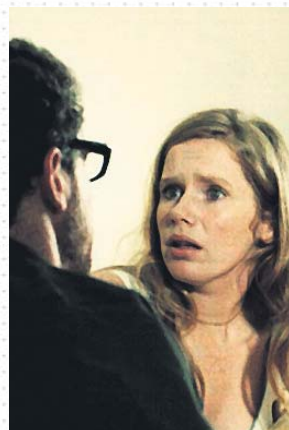
Los protagonistas de la ficción sueca.

Primero fue una serie de 300 minutos y seis capítulos, cada uno con su título (de Inocencia y pánico a En plena noche, en una casa oscura ), en los que Bergman se adentraba en las visceras de la vida conyugal, poniendo especial atención al papel de las mujeres. No sobra nada, pero ahora recuerdo especialmente dos