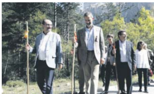
Visita del Rey al Parque Nacional.

Su Majestad el Rey Felipe VI ha estado muy presente en el Centenario de Ordesa y Monte Perdido: visitó el Parque Nacional, presidió la sesión del Senado conmemorativa de los dos parques centenarios (Ordesa y Picos de Europa) y es el presidente de honor del Comité Organizador. El Rey recordó que la conservación de Ordesa es "responsabilidad de todos" y alabó la labor realizada "día a día" por los habitantes del territorio.