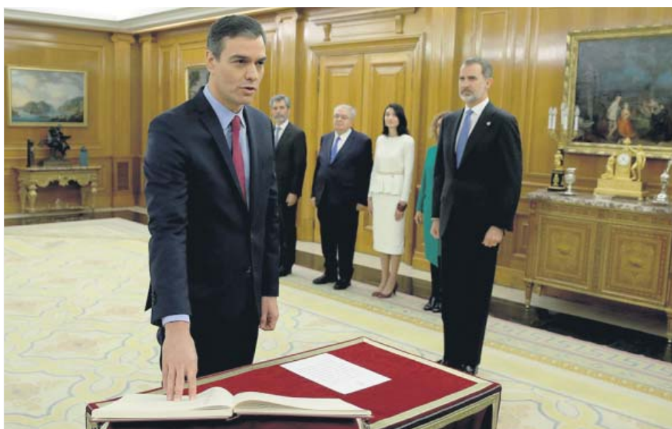
Sánchez prometiendo su cargo sobre la Constitución ante el rey Felipe VI.

nos eche a andar, pero ya se conoce una de las primeras cosas que los separatistas plantearán a Pedro Sánchez: que su Gobierno deje de acusar a los independentistas en las causas judiciales abiertas contra ellos. Según explicó ayer el vicepresidente catalán, Pere Aragonés (ERC), plantearán la retirada del Ejecutivo de las causas abiertas contra el soberanismo. En