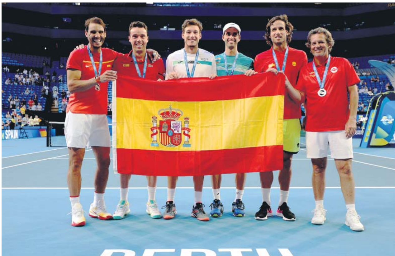
El equipo español posa tras certificar su pase a la siguiente ronda.

El mejor español fue Lorenzo Santolino. El salmantino entró a 6:24 de Cornejo, y se quitó el mal sabor de boca del día anterior, cuando se quedó sin 'top 10' por la eliminación del WP. Acabó décimo gracias al castigo a Caimi, también sancionado. La general mantiene a Ricky Brabec al frente, aunque con menos ventaja de la que tenía, por delante de Kevin Benavides por 2:30. ●