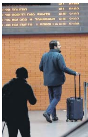
Pasajeros en la estación de Atocha, en Madrid.

La oferta pertenece a la iniciativa Yo voy de Renfe, con la que pretende unirse al periodo de rebajas propio de estas fechas. Los billetes están disponibles desde ayer y podrán adquirirse