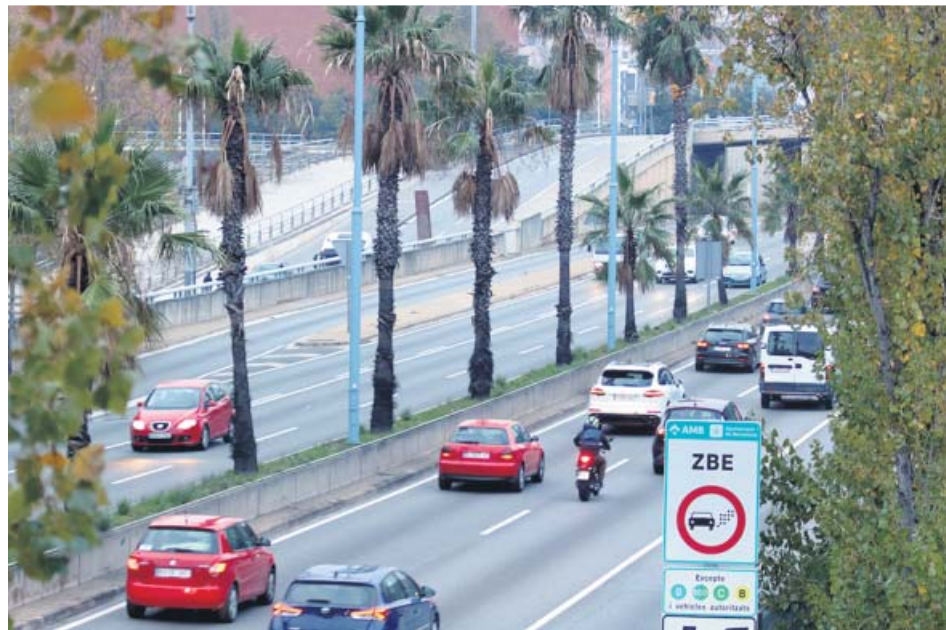
Un cartel en la Ronda de Dalt alerta a los conductores de la existencia de la ZBE.

conductores han inscrito sus coches en el registro de vehículos contaminantes