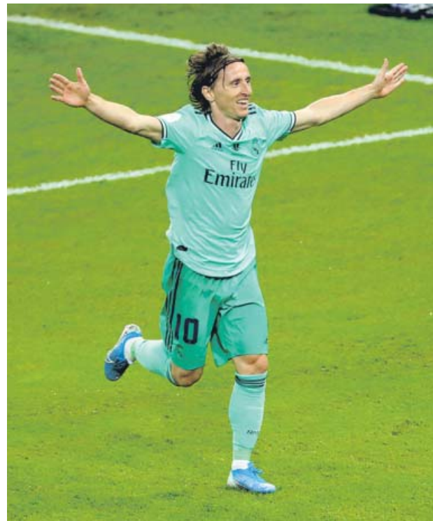
Luka Modric celebra su golazo en la Supercopa.

El tanto fue un duro palo para el Valencia, desconcertado ante la apisonadora merengue, ayer de verde, aunque