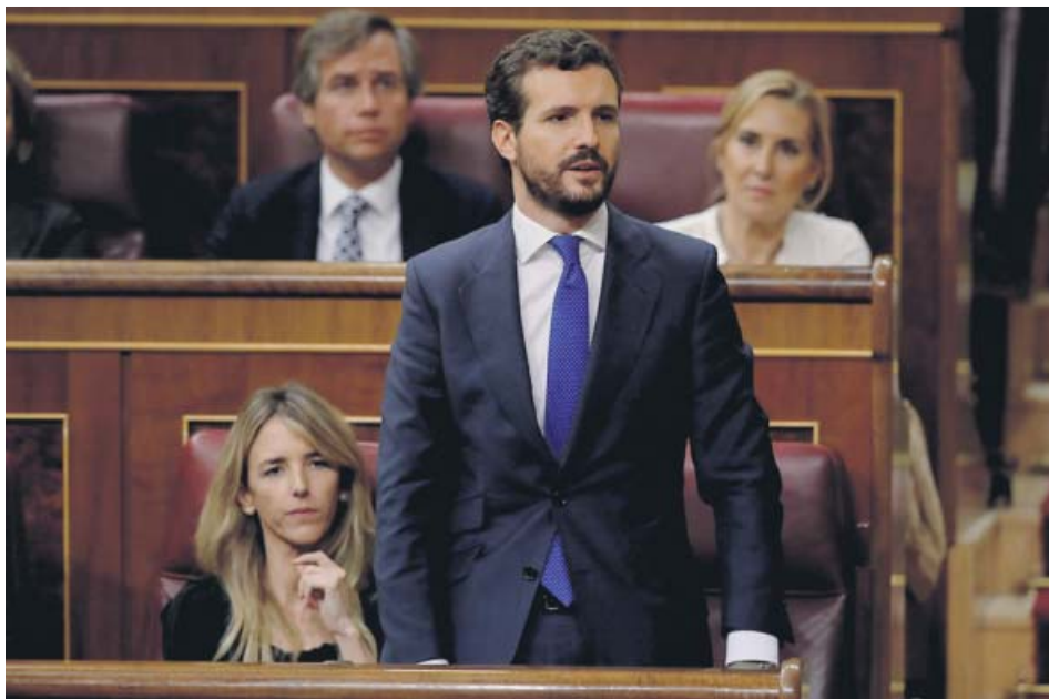
El presidente del Partido Popular, Pablo Casado, durante la investidura de Pedro Sánchez.