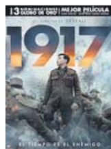
2019. Director Sam Mendes Reperto George MacKay, Dean-Charles Chapman, Colin Firth

No se puede hablar de 1917 sin mencionar también su condición de alarde técnico. Un alarde que se cobra su precio en forma de inconsistencias de guion y de alerta constante, con el ojo siempre en