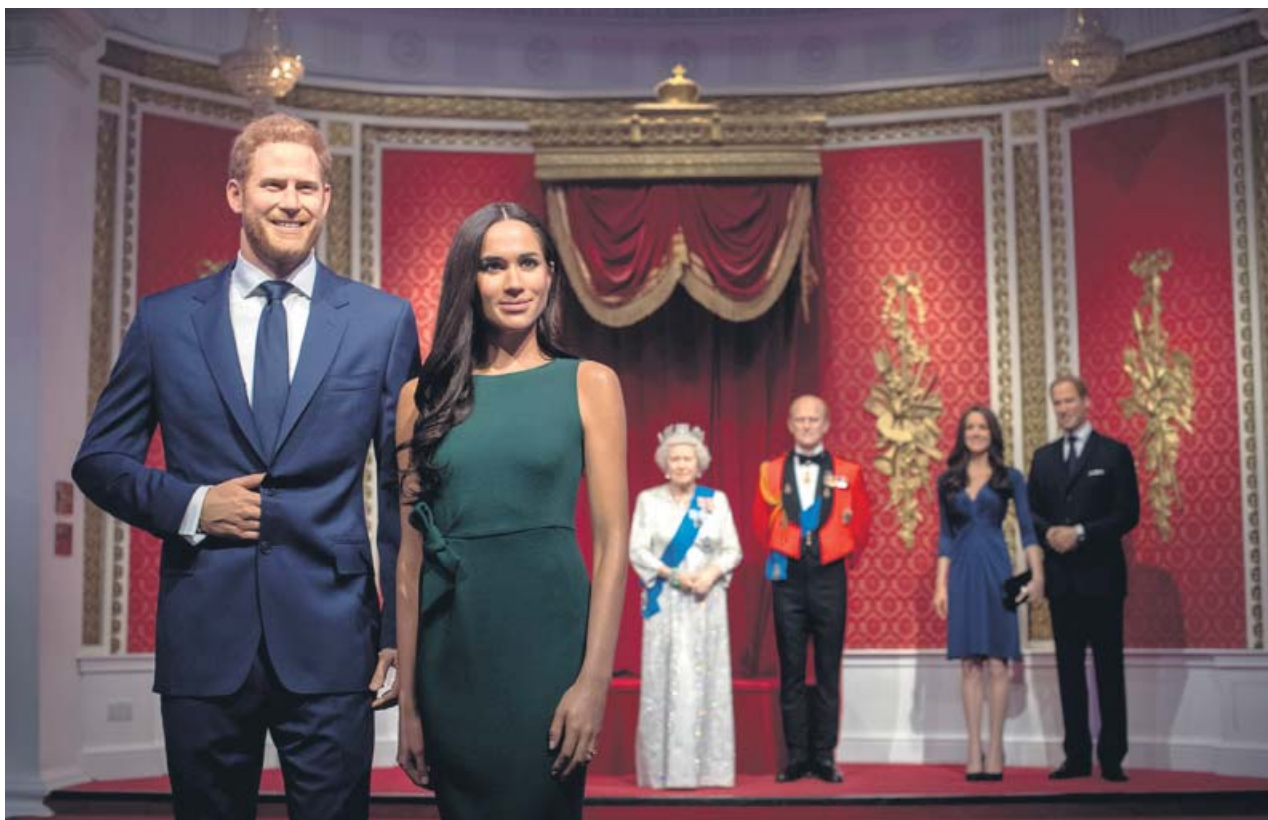
Las figuras de cera del príncipe Harry y Meghan Markle ya no estarán junto a Isabel II y el resto de la casa real.

La hija del torero y la tonadillera ha rechazado una oferta importante para hacer declaraciones sobre su nueva relación. Dice que quiere vivir su historia en la más estricta intimidad. ●