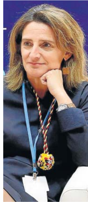
Teresa Ribera Vicepresidenta cuarta Ribera mantendrá sus competencias sobre Transición Ecológica y añadirá las de Reto Demográfico. Con su ascenso, Sánchez prioriza la agenda verde.

viño, estuvieran al nivel de Iglesias. Para la formación, el problema no es el perfil de la nueva vicepresidenta —una reconocida experta en asuntos de transición ecológica—, sino que la decisión de Sánchez se interpreta como un intento de opacar la figura del líder morado.