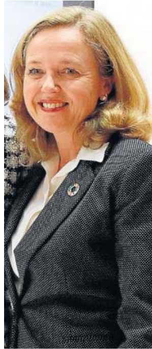
Nadia Calviño Vicepresidenta tercera Calviño mantendrá la cartera de Economía. Con una amplia carrera en Bruselas, ejercerá como la guardiana de la ortodoxia económica del nuevo Ejecutivo.