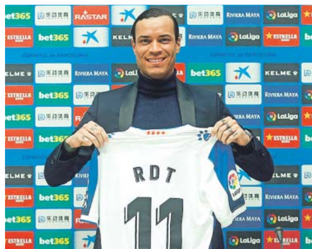
El delantero fue presentado ayer con su nuevo club.

El madrileño silenció a los posibles escépticos sobre su capacidad en la campaña 2018-19, su primer curso en