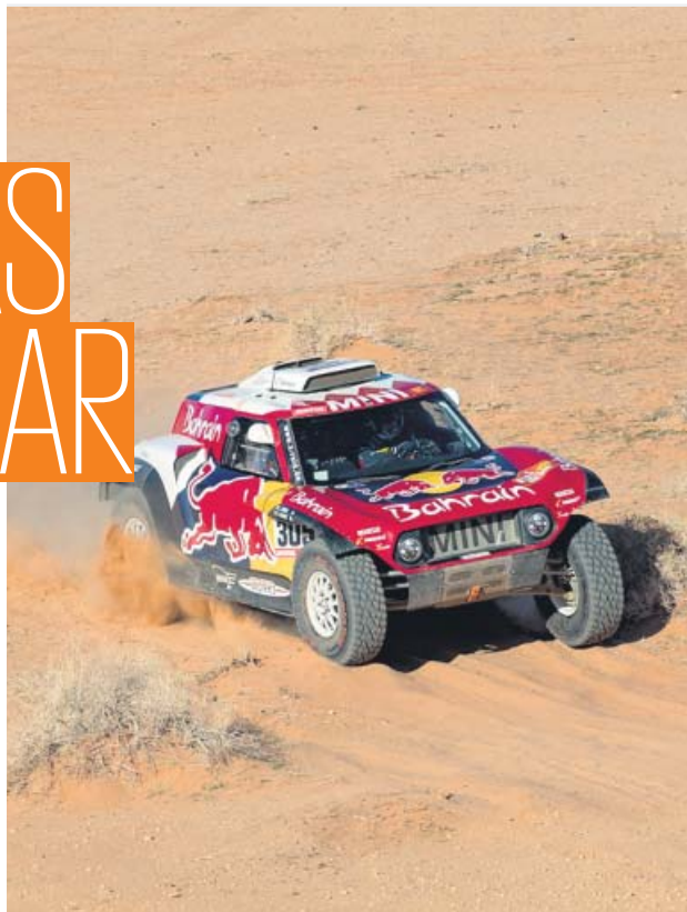
Sainz, en acción durante la etapa de ayer.

«Soy súper cauto porque las diferencias son mínimas, no sólo con Nasser sino con Stéphane», añadió el líder del Dakar.