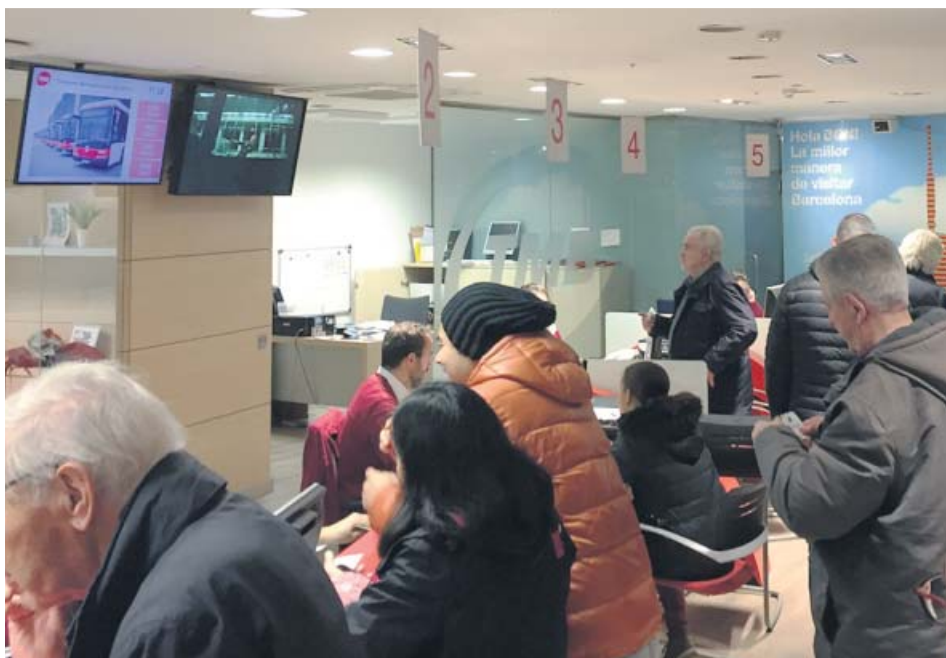
Usuarios en el punto de información de TMB de Universitat, ayer.

LAS VALIDACIONES se mantienen en niveles similares a las de los primeros días de 2019 pese al cambio tarifario