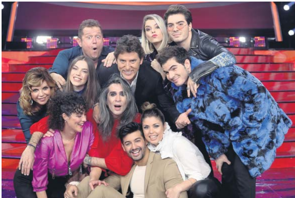
El elenco de concursantes de TCMS, junto al presentador, Manel Fuentes (arriba, centro). A3