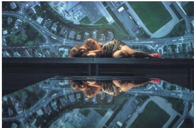
Imatge de l'espectacle 'Raphaëlle'. ALFRED MAUVE

Encara hi ha molt a fer, insisteix el director, pels drets de les persones transsexuals