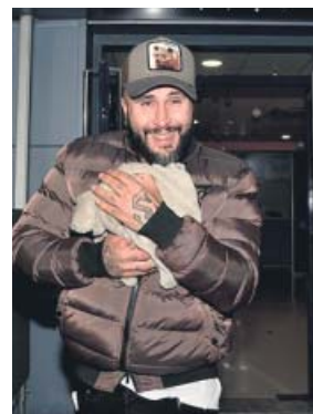
Kiko Rivera, en una imagen reciente.

complicados de su ya explicada adicción a las drogas, hablará por primera vez sobre el tiempo en que su madre, Isabel Pantoja, estuvo en la cárcel.