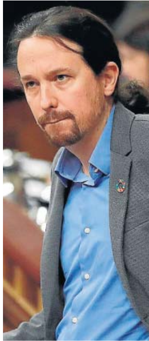
Pablo Iglesias Vicepresidente segundo El líder de Podemos accede al Gobierno seis años después de fundar su partido. Será el encargado de las áreas de Derechos Sociales y Agenda 2030.