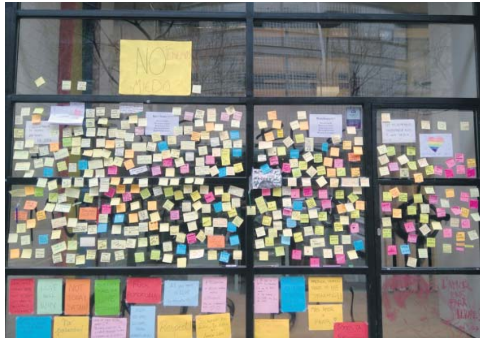
Missatges solidaris al Centre LGTBI després que patís un atac el 27 de gener de 2019.

L'equipament ha atès 309 casos individuals a través del Servei d'Acollida, i entre les