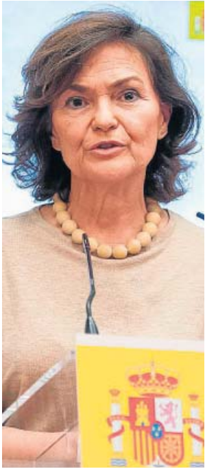
Carmen Calvo Vicepresidenta primera Calvo se mantendrá como número 2 del Ejecutivo. Además, seguirá como ministra de Presidencia y asumirá las competencias de memoria histórica.