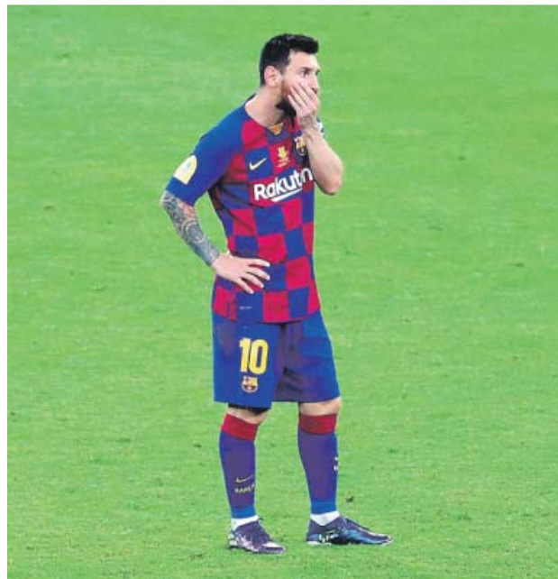
Leo Messi se lamenta tras la derrota ante el Atlético.

En los primeros 45 minutos el Atleti no compareció en ataque y solo una falta lateral sacada por Herrera inquietó a Neto. Fue un espejismo, pues el dominio era cada vez mayor de los culés, espoleados por el público saudi, que si el día anterior era merengue, en esta ocasión era del Barça. Casi se marca un tanto en