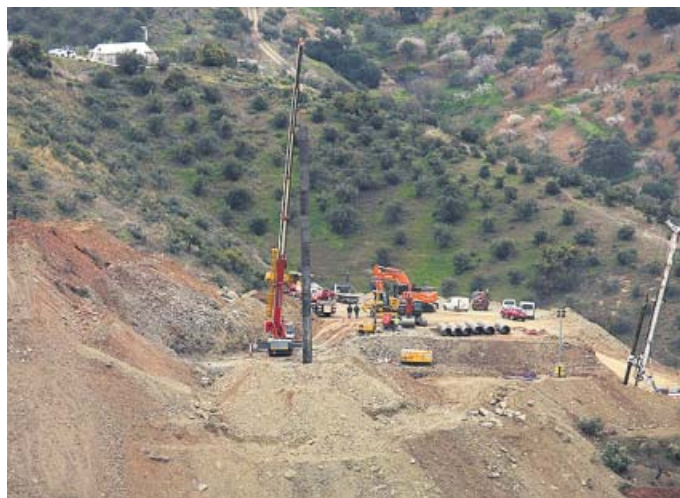
Trabajos de rescate en el Dolmen del Cerro de la Corona.