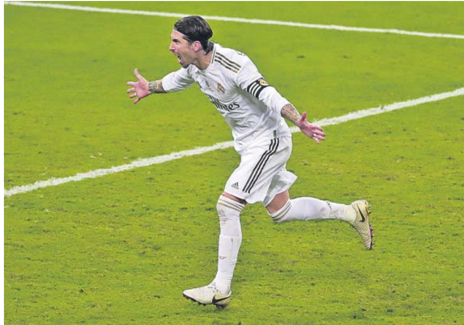
Sergio Ramos celebra el penalti que le dio la victoria al Real Madrid.

ZIDANE conquista el primer título al que opta desde su regreso. Sigue infalible en las finales que disputa SERGIO RAMOS marcó el gol decisivo en la tanda de penaltis. Courtois detuvo uno y Oblak... ninguno