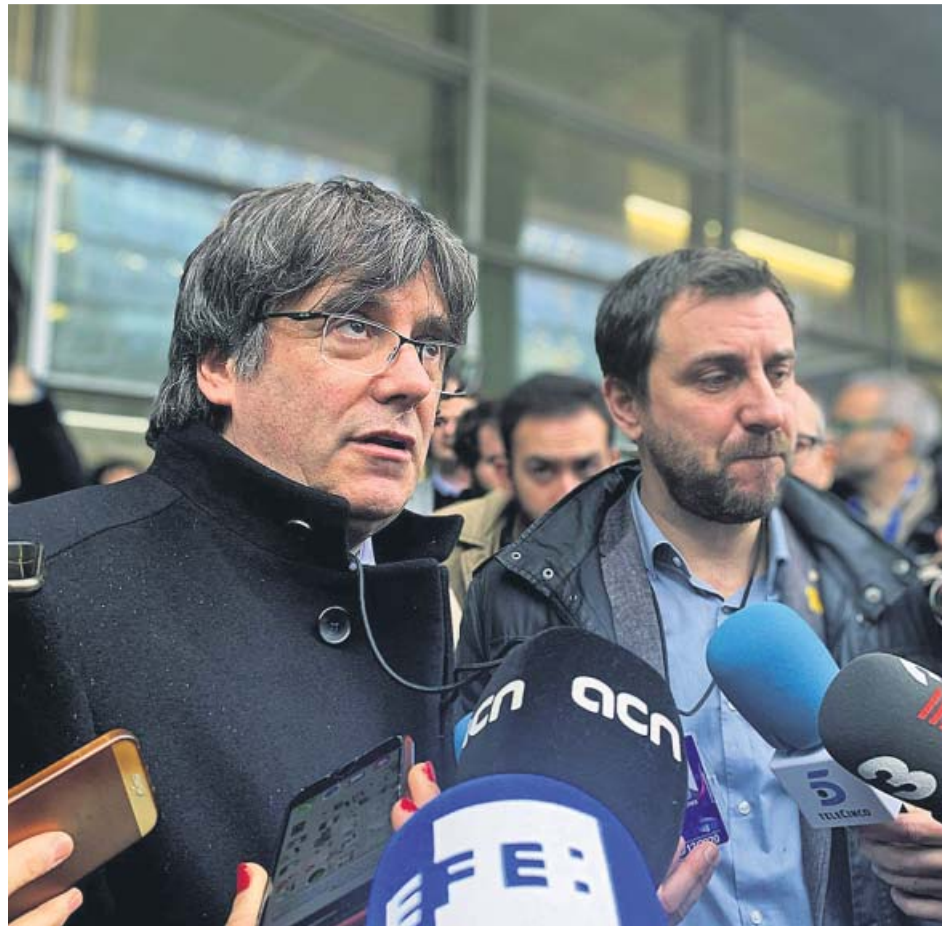
Carles Puigdemont y Toni Comín, en las puertas del Parlamento Europeo.

No obstante, tanto el expresidente catalán como el exconseller darán sus primeros pasos