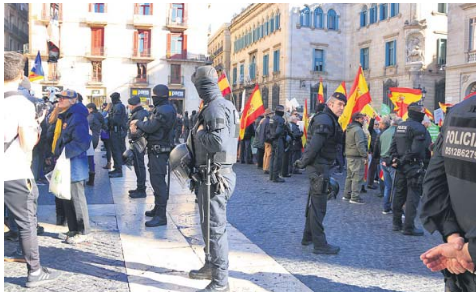
Los Mossos separan la concentración de «España existe» de los CDR en Sant Jaume.

Vox convocó ayer en distintas ciudades a miles de personas bajo el lema «España existe» para presentar su oposición al Gobierno de coalición del PSOE con Unidas Podemos. El partido cifró los asistentes en 100.000, entre todas las concentraciones que se celebraron. En Barcelona los Mossos tuvieron que separar a los mil manifestantes de Vox y los 300 de los CDR en la plaza Sant Jaume. ●