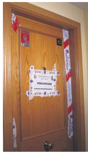
La puerta de la vivienda donde ocurrió.

El hombre fue acto seguido a por el otro agente y le dio tam-