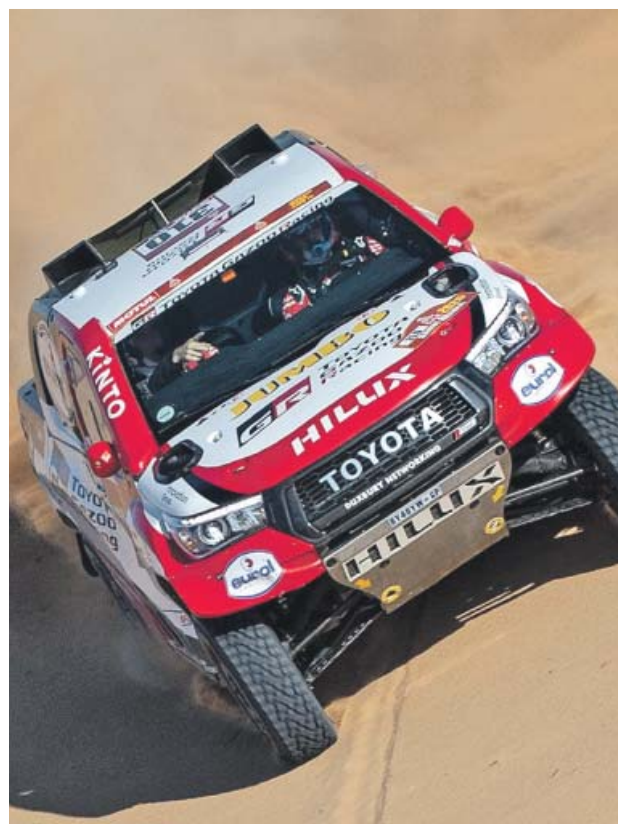
Fernando Alonso, durante el Dakar 2020.

El podio de Alonso llegó en un día complicado para la familia dakariana. Aún con el dolor por la muerte de un piloto tan querido en la caravana como Paulo Gonçalves, los