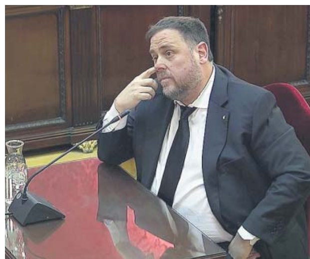
Oriol Junqueras, en el juicio del procés

«No esperamos nada del Tribunal Supremo, sabemos que solo busca venganza, en ningún caso justicia. Tiene un objetivo que es apartarnos de la vida política y silenciarnos, aunque eso le haga perder reputación internacional», asegura Junqueras en una entrevista por escrito con el progra-