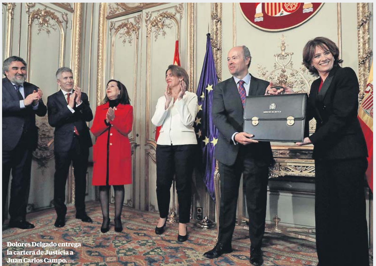
Dolores Delgado entrega la cartera de Justicia a Juan Carlos Campo.