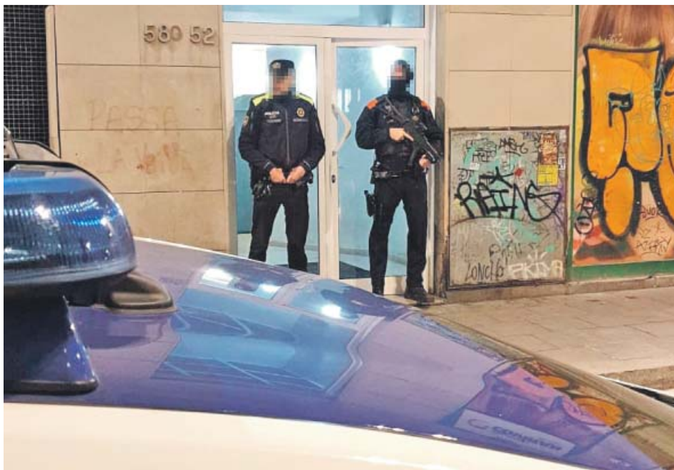
Dos agents en un moment de l'operatiu dels Mossos i la Guàrdia Urbana.