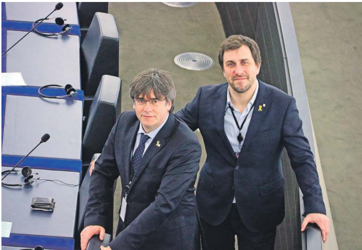
Carles Puigdemont y Toni Comín ocuparon ayer sus escaños de diputados en el primer Pleno de la eurocámara.