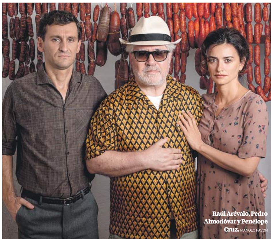
Raúl Arévalo, Pedro Almodóvar y Penélope Cruz.

Aunque Netflix se fue de los Globos de Oro con poca cosa entre las manos, ha conseguido ahora liderar las nominaciones (24) a los Óscar, que celebrará su 92 edición en Los Ángeles (EE UU) el 9 de febrero. ●