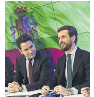
García Egea (i) y Casado, en la Junta Directiva Nacional.

Pablo Casado ya camina por la senda de la oposición y ayer lo hizo criticando duramente la propuesta de Dolores Delgado para la Fiscalía General del Estado. «Ya en campaña electoral oímos eso de que Sánchez mandaba sobre la Fiscalía», sostuvo el presidente del PP en su discurso ante la Junta Directiva Nacional, celebrada en Génova. Así, los populares recurrirán el nombramiento «cuando se produzca», y lo harán citando el artículo 59 del estatuto fiscal, que establece que no podrán ser miembros del Ministerio Fiscal quienes pertenezcan a partidos políticos o sindicatos.