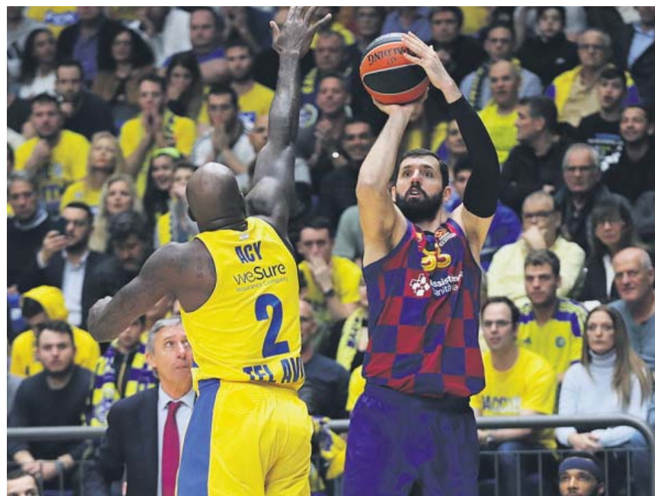
Nikola Mirotic lanza un triple ante Quincy Acy en Tel Aviv.

En quads el piloto chileno Ignacio Casale logró su cuarta victoria de etapa en esta edición del rally y tiene casi en su mano su tercer título tras los que consiguió en 2014 y en la edición de hace dos años, en 2018. ●