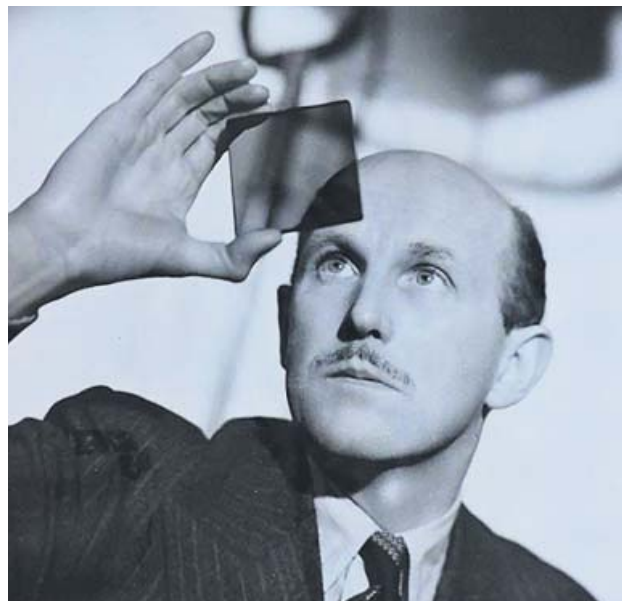
El director de cine Michael Powell.

Irlanda ha dado grandes escritores durante los últimos cinco siglos: Swift, Sterne, Yeats, Joyce, Heaney. Hay una frase que para describir la India, su enigma, su misterio ancestral nos dice que la India es como mil Irlandas. Algo de todo esto me ronda tras leer una fabulosa novela sobre Irlanda, o por ser más preciso, sobre una familia irlandesa. La novela no es muy antigua, casi de ayer mismo, A Waiting Game (1975), de Michael Powell, un director de cine inglés