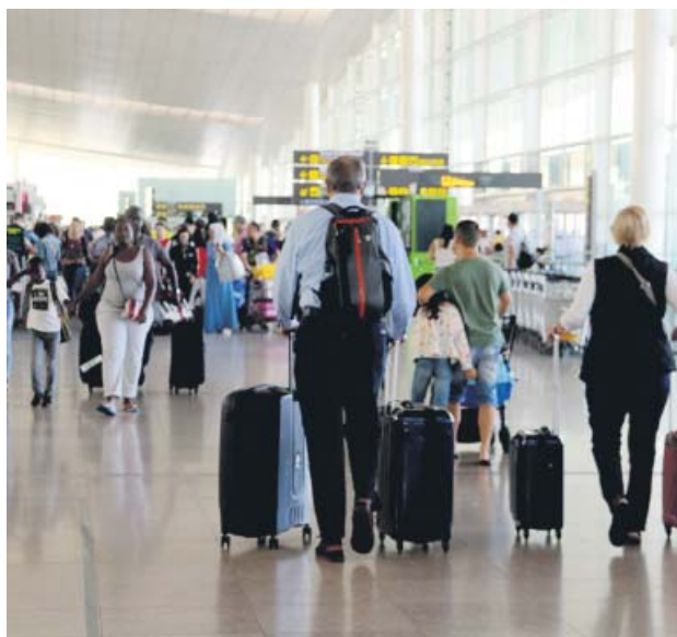
Pasajeros en la Terminal 1 del aeropuerto de El Prat.