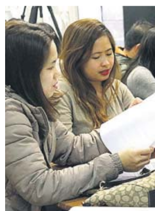
Dones migrants de la comunitat filipina a classe.

Les dades, que provenen principalment de l'enquesta de condicions de vida que elabora anualment l'Institut d'Estadística de Catalunya (Idescat), i que ahir van presentar les En-