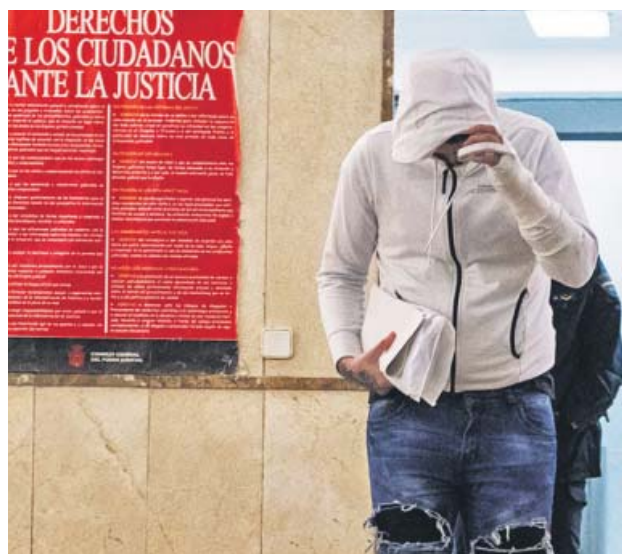
Uno de los jóvenes detenidos por la violación grupal.