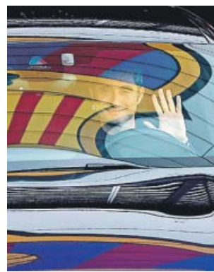
Valverde, a su salida este lunes de la ciudad deportiva culé.

«Queridos culés, mi etapa como técnico del FC Barcelona ha llegado a su fin. Han sido dos temporadas y media muy intensas ya desde el principio. En este tiempo he vivido momentos muy alegres celebrando victorias y títulos,