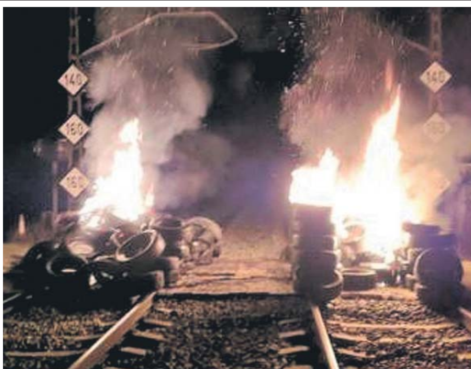
Crema de neumàtics a la via de tren Caldes-Girona, dimarts de matinada.

El primer tren que va poder circular per la zona va ser un regional que va sortir a les 12.33 hores des de l'estació de Caldes de Malavella en direcció a Cervera. Els usuaris que viatjaven en direcció a Barcelona es van haver d'esperar fins a les 13.16 hores per poder agafar un tren. Fruit d'aquesta incidència es van produir retards en altres punts de la xarxa. ● R. B.