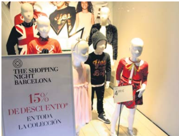
Un escaparate del Passeig de Gràcia.

Los disturbios de octubre tras la sentencia del 'procés' no evitaron que la arteria creciera un 19% en ventas en 2019