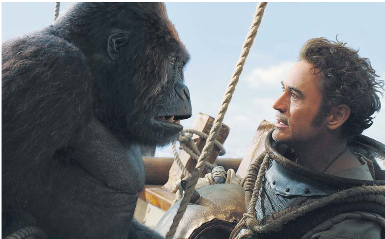
Robert Downey Jr. ha cambiado a Capitán América por un gorila para esta nueva misión animal.