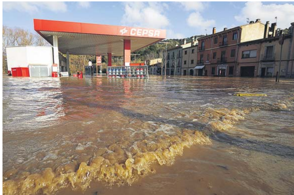
El desbordamiento del río Ter inundó ayer barrios de Girona.

Las playas de Barcelona y del Maresme, como casi toda la costa catalana, presentaban ayer un aspecto dantesco, con