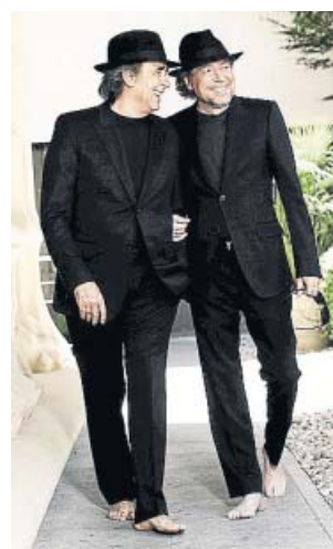
Serrat y Sabina en una foto promocional.

A finales del pasado año recorrieron Sudamérica (con cuatro veladas en Buenos Aires y conciertos en Paraguay, Uruguay, México y Costa Rica) y ahora se enfrentan a cinco fechas en España de las que quedan la del sábado en Barcelona y las de los días 11 y 12 de febrero de nuevo en Madrid. Sobre las dos primeras actuaciones madrileñas, la crítica escribió: «Han hecho disfrutar y reír al público con sus canciones de siem-