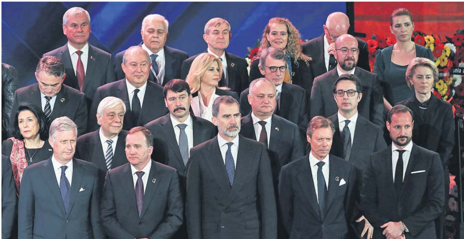
Felipe VI, rodeado por destacados jefes de Estado y de Gobierno en Jerusalén.