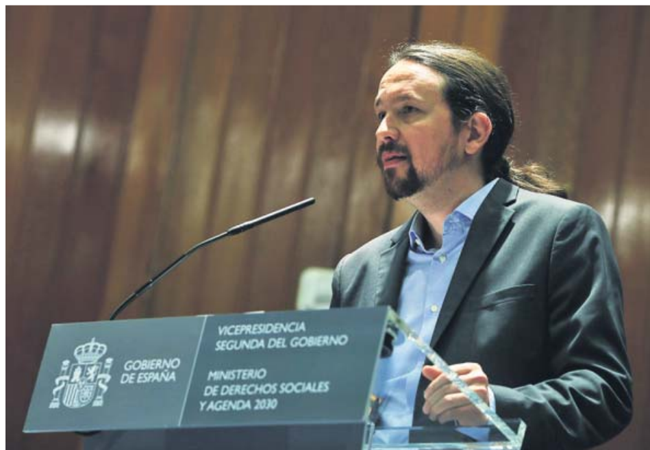
El vicepresidente segundo del Gobierno, Pablo Iglesias, el miércoles.

EL ANTERIOR proyecto del Gobierno decayó por la convocatoria de las elecciones del 28 de abril