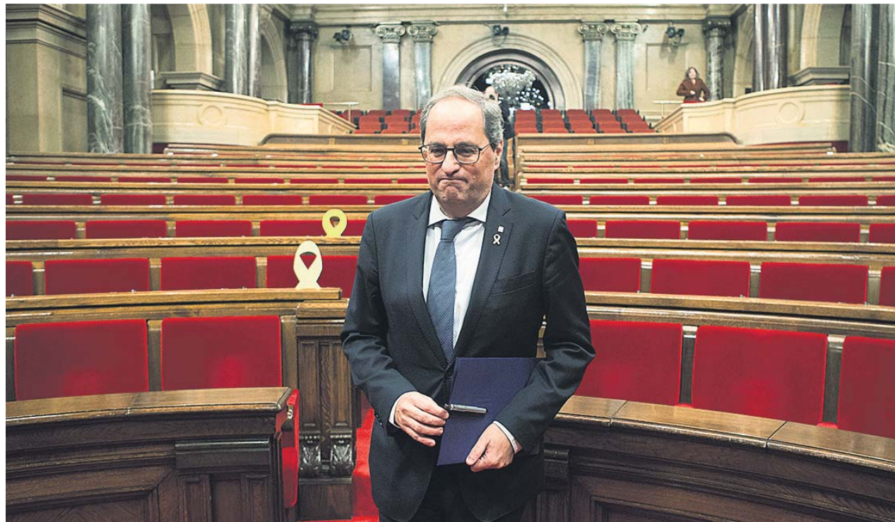
El presidente, de momento inhabilitado, de la Generalitat de Cataluña, Quim Torra, a la salida de un pleno del Parlament.

Torra, en cambio, no modifica su postura y hace oídos sordos a la decisión. «Soy diputado y Presidente de Cataluña. Nada ha cambiado», expresó en una declaración tras conocer el fallo. Cabe recordar que la JEC adoptó dicho acuerdo después de que Torra fuera condenado por el Tribunal Superior de Justicia de Cataluña (TSJC) por no retirar los lazos amarillos de edificios públicos en periodo electoral, en una sentencia que aún no es firme.