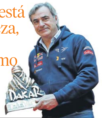
CARLOS SAINZ Tricampeón del Dakar

«La edad está en la cabeza, hasta un límite, como es lógico»