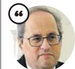
QUIM TORRA Presidente de la Generalitat

«Lamento que la capital de mi país apruebe una resolución tan provinciana y falta de ambición»