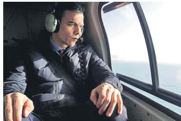
Sánchez sobrevoló las zonas más afectadas de Cataluña.

Renfe pondrá a la venta desde el próximo lunes y durante diez días 1.000 billetes diarios del AVLO a Barcelona a un precio de 5 euros, según anunció el ministro de Transportes, Movilidad y Agenda Urbana, José Luis Ábalos. La venta comenzará al mediodía en la web de AVLO www.avlorenfe.com , todavía inactiva.