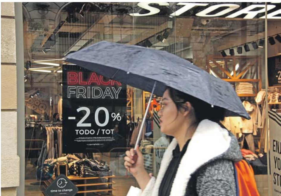
Una joven caminando frente a un escaparate.