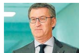
Iñigo Urkullu y Alberto Núñez Feijóo, ayer.

toral también se ha visto motivado «por la situación general en el Estado y por cómo Cataluña podría afectar al Gobierno español y, de rebote, a las demás instituciones» del Estado. Insistió, eso sí, en que en su decisión no ha influido la situación en Cataluña, donde se desconoce la fecha de las elecciones autonómicas. «No me puedo ver condicionado por algo que no sé», remarcó.