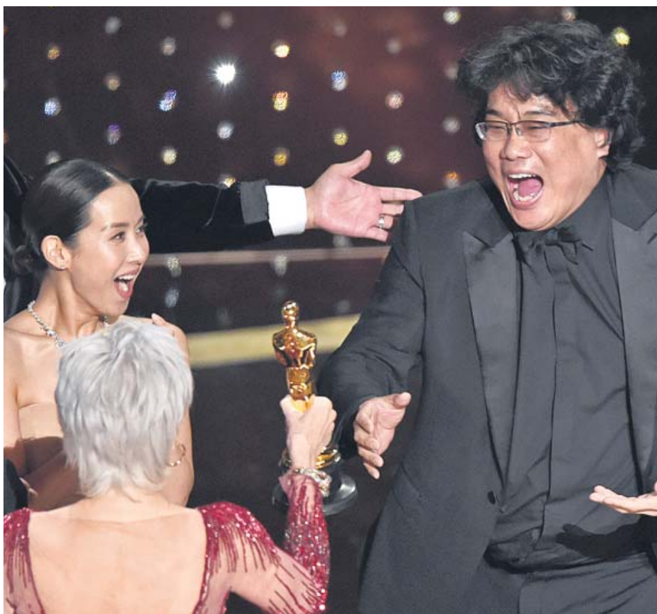
El director Bong Joon-ho celebra con entusiasmo el Óscar a mejor película para Parásitos