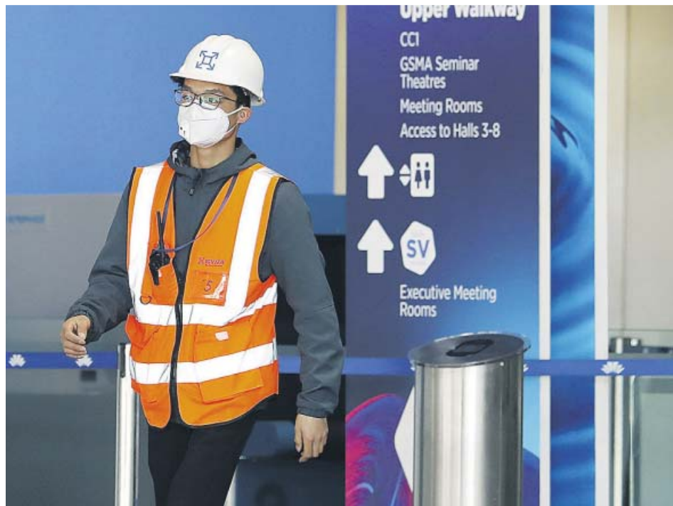
Un trabajador saliendo ayer de Fira Gran Via, el recinto que acogerá el congreso.

A dos semanas de arrancar la edición de 2020 del gran acontecimiento tecnológico mundial, el sector hotelero también confirmaba ayer que se esta-