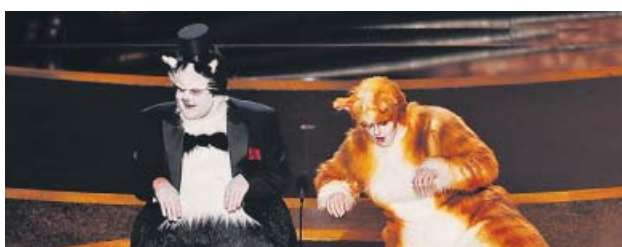
'Frozen' y 'Cats' Las voces del filme Frozen 2 , incluida la de la española Gisela (arriba); James Corden y Rebel Wilson, disfrazados de gatos por el criticado musical Cats , entregan el Óscar a los mejores efectos especiales.