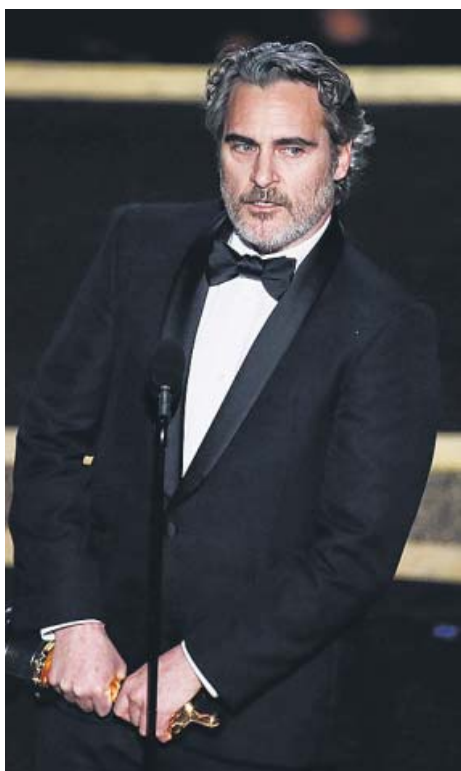
Mejor actor y actriz principales. Como todo el mundo daba por hecho, Joaquin Phoenix ( Joker ) y Renée Zellweger ( Judy ) acabaron la noche con una estatuilla en sus manos.