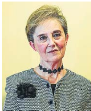
Paz Esteban durante su toma de posesión.

Esteban, que cuenta con 30 años de experiencia en servicios de espionaje, agradeció al Gobierno su confianza, que considera «una señal clara de respaldo a la institución», ya que ejerció como directora interina desde verano. Será la primera mujer que dirige el Centro y la encargada de revisar su estructura interna y completar el «proyecto de transformación digital», según explicó Esteban. ●