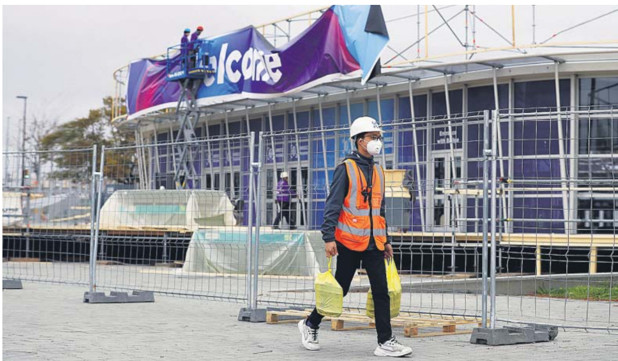
Un trabajador en la Fira de Barcelona, ayer, ultimaba los preparativos para el Congreso antes de conocerse su suspensión.

DESDE 2006 el Mobile habría dejado en la economía de la ciudad 5.300 millones de euros