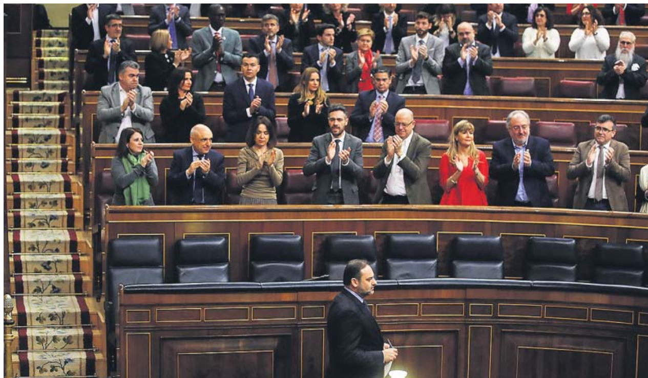
El ministro de Transportes, José Luis Ábalos, es aplaudido por el grupo socialista en el Congreso.