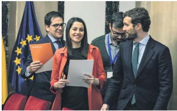
Inés Arrimadas y Pablo Casado se reunieron este martes.

Mañana se cierra el plazo para la presentación de las coaliciones —para el registro de listas tienen todavía días— y ya