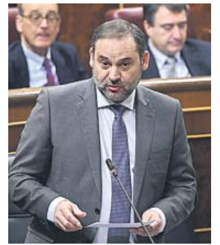
El ministro José Luis Ábalos, ayer, en el Congreso.

Las declaraciones de Ábalos se contraponen a las que realizó hace unas semanas la ministra de Economía, Nadia Calviño, que dejó caer que no hay «medidas milagro» para acabar con