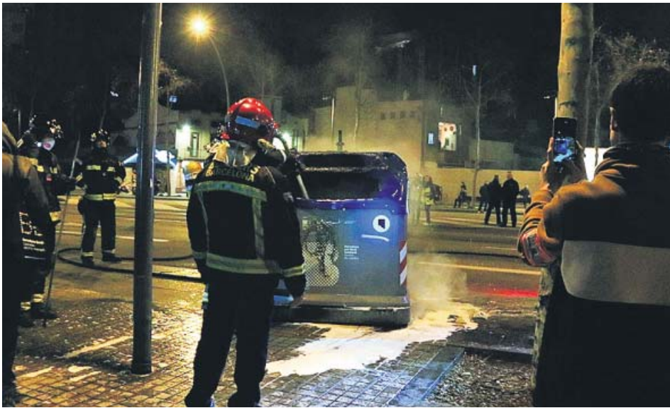
Bomberos apagando un contenedor incendiado el pasado domingo en la protesta.