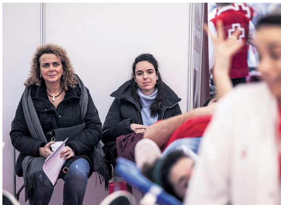
Imatge d'arxiu de dones esperant per donar sang durant la Marató.