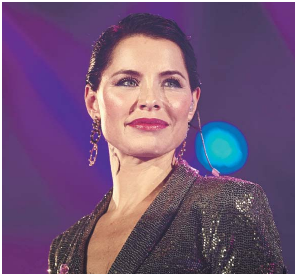
La artista extremeña Soraya Arnelas durante uno de sus últimos conciertos.

Las afectadas son mujeres y niñas de entre 11 y 17 años que han cumplido penas por delitos leves en la cárcel en Kenia, la mayoría sin educación y provenientes de entornos disfuncionales, barrios marginales y familias conflictivas con pocos