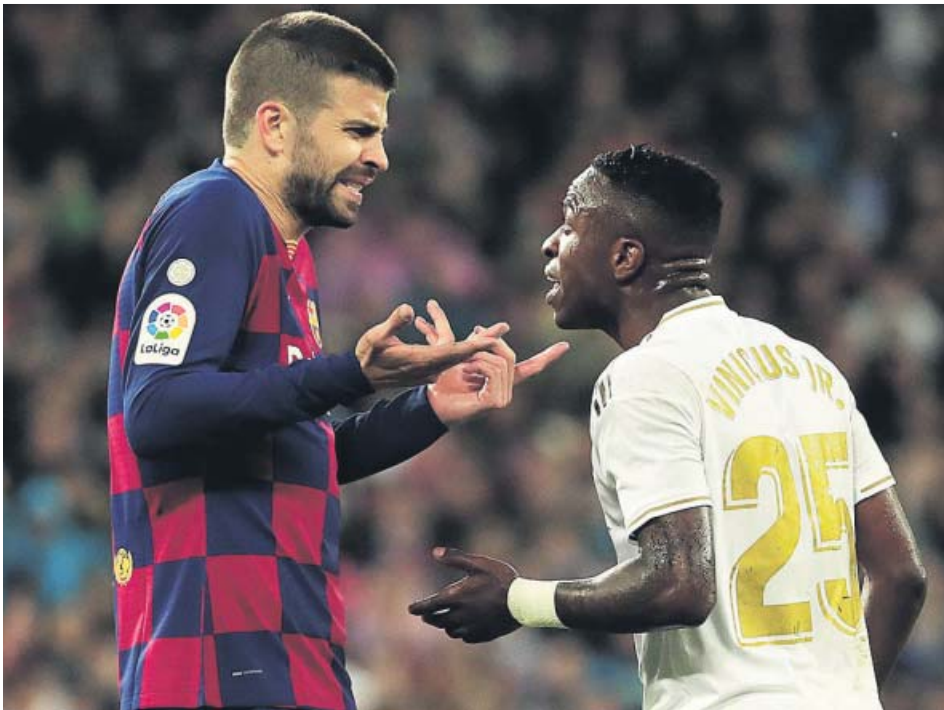
Discusión entre Gerard Piqué y Vinícius Jr. durante el Clásico del Bernabéu.