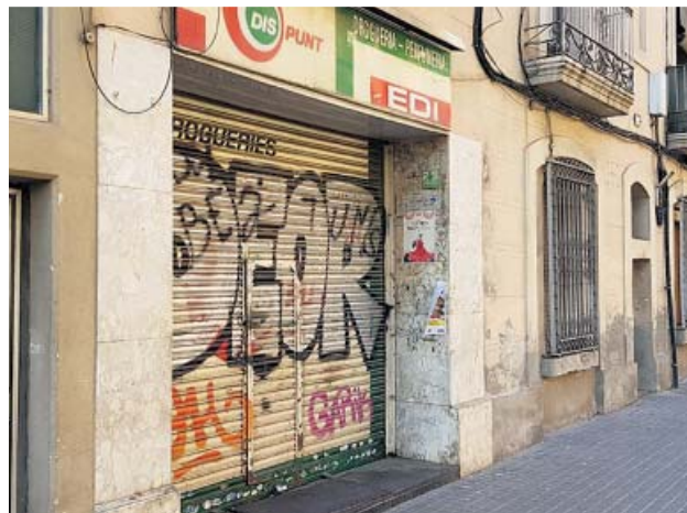
Un local ocupado como vivienda en Consell de Cent. I.S.

LOS RESTAURANTES SON los que ocupan más locales en Barcelona, 5.597. Les siguen los servicios a empresas