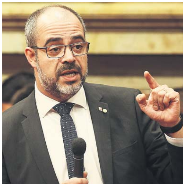
El conseller de Interior, Miquel Buch.

En su querrela, que la Fiscalía presentó a raíz de una denuncia de varios diputados de Ciudadanos, el ministerio público sostiene que el nombramiento de Lluís E. como ase-