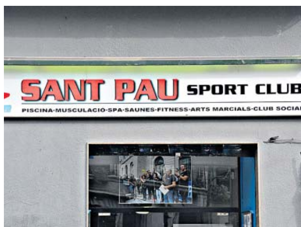
Imagen de la entrada del gimnasio social Sant Pau. M. LOPERENA

El local, que cuenta con 1.300 socios, de los cuales solamente 400 pagan alguna mensualidad, abre las puertas a personas vulnerables que no pueden permitirse el gasto de un gimnasio, aunque el pasado mes de mayo tuvo que cerrar algunas de sus instalaciones tras una fuga en el edificio de al lado que las estropeó. Finalmente, la cooperativa logró subsistir y, gracias a la