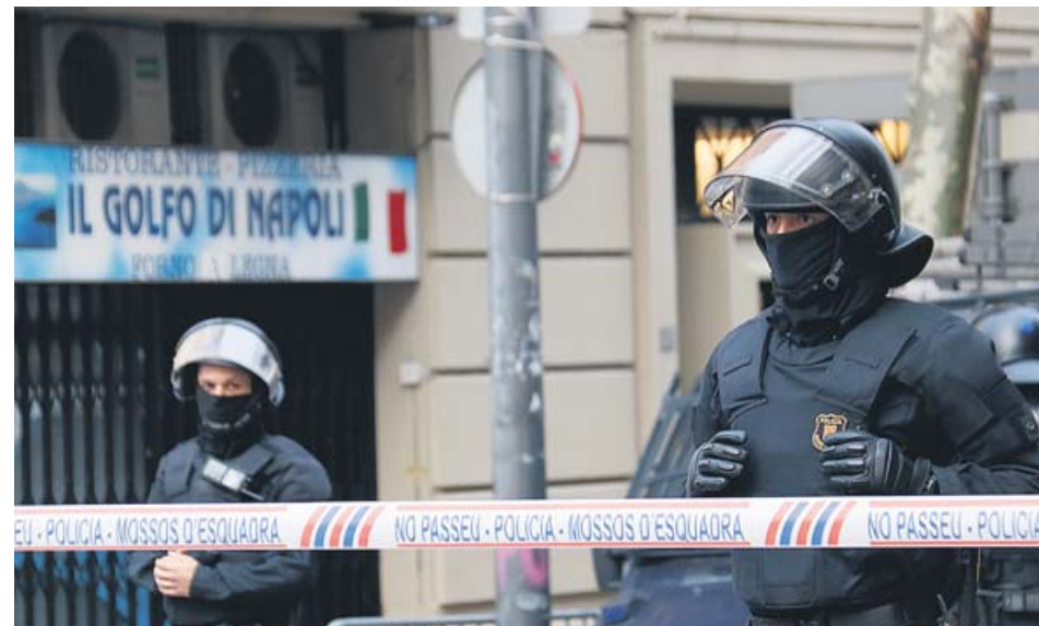
Cordó policial dels Mossos, ahir, durant el desnonament del Bloc Llavors.

pels Mossos d'Esquadra, que van desplegar un fort dispositiu que va arrencar de matinada, a les 06.30 hores. La mobilització de diversos grups d'activistes que van arribar a passar la nit a l'edifici del número 38 del carrer de Lleida, propietat del fons voltor Vauras, i ocupat per sis famílies –algunes d'elles amb menors d'edat a càrrec– no va aconseguir paralitzar el llançament.