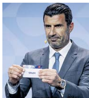
Luis Figo, mano inocente, con la bola de España.

Los combinados nacionales de la Liga A, con la presencia de las 16 selecciones más potentes según el ranking de la UEFA, lucharán por el título en una competición que tuvo como primer ganador en