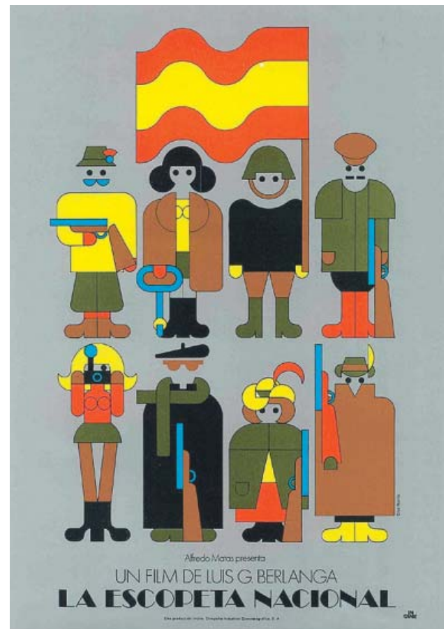
Fotograma del documental en el que aparece el diseñador; debajo, cartel de La escopeta nacional . LLANERO FILMS Y CRUZ NOVILLO