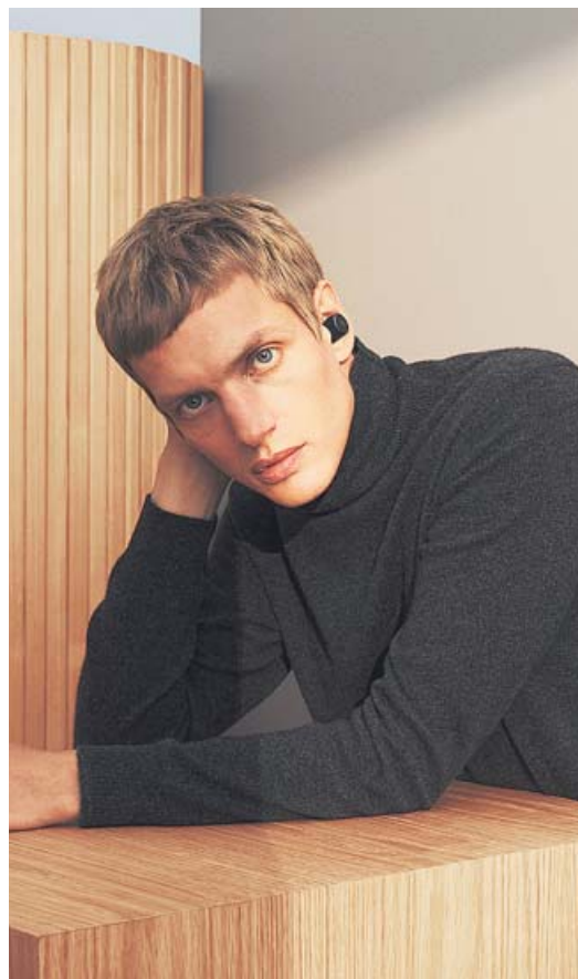
CAMPANYA DELS AURICULARS SENSE FIL E8 DE BEOPLAY

Modern, urbanita, aventurer, amant dels gadgets tecnològics, hedonista, juvenil, nostàlgic... Si veus al teu pare reflectit en alguns d'aquests adjectius, de ben segur que se sentirà atret per aquesta selecció de propostes de regals, més enllà del treball manual escolar de torn que segur que rebrà pel Dia del Pare.