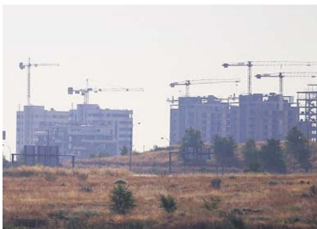
Vista de una serie de edificios en construcción. JORGE PARIS

DECISIÓN Los jueces españoles examinarán cada caso y los clientes temen un «laberinto» en los tribunales