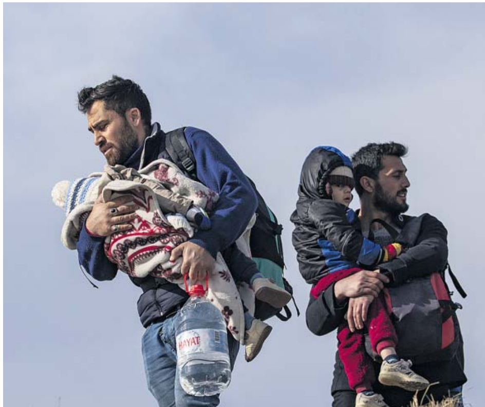
Dos migrantes llevan a sus hijos en brazos en la frontera greco-turca.

Grecia ha suspendido por un mes el derecho de los refugiados a solicitar asilo, incumpliendo la legislación internacional, según Acnur, y ha anunciado ma-