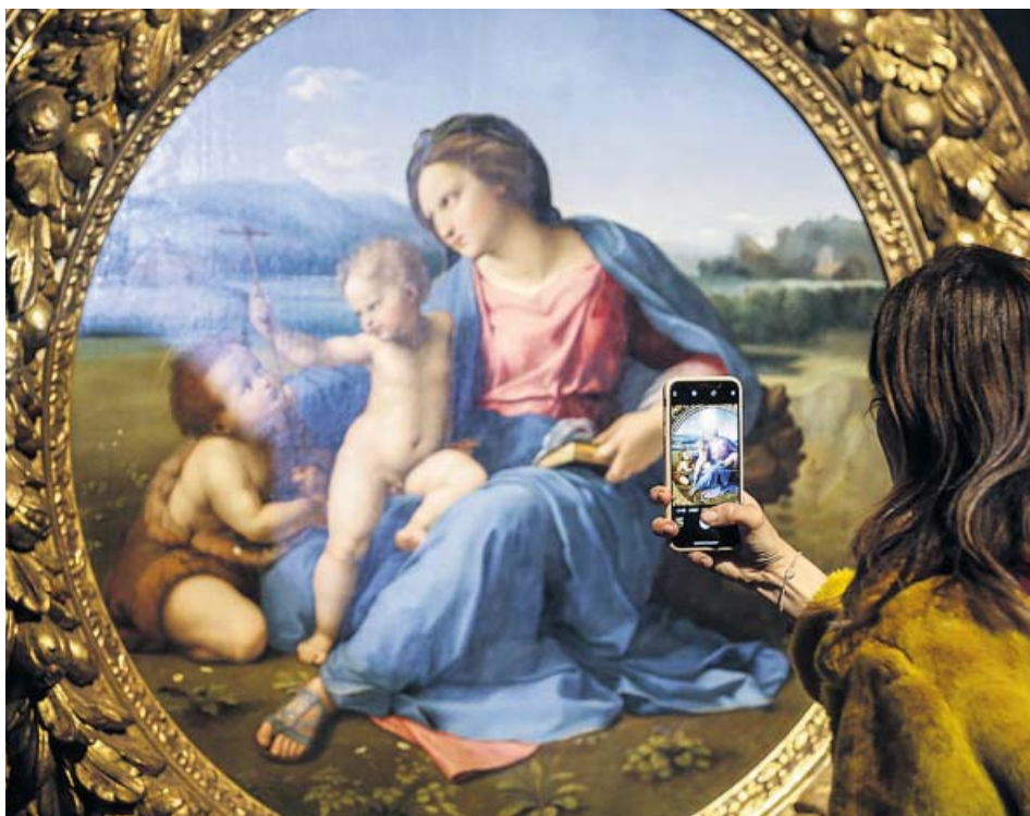
Una mujer fotografía el cuadro 'Madonna d'Alba', del pintor Raffaello.

Preocupación por el empeoramiento de la salud de la madre de nuestra folclórica más importante. En los últimos días ha sufrido un bajón del que creen que no se recuperará. ●