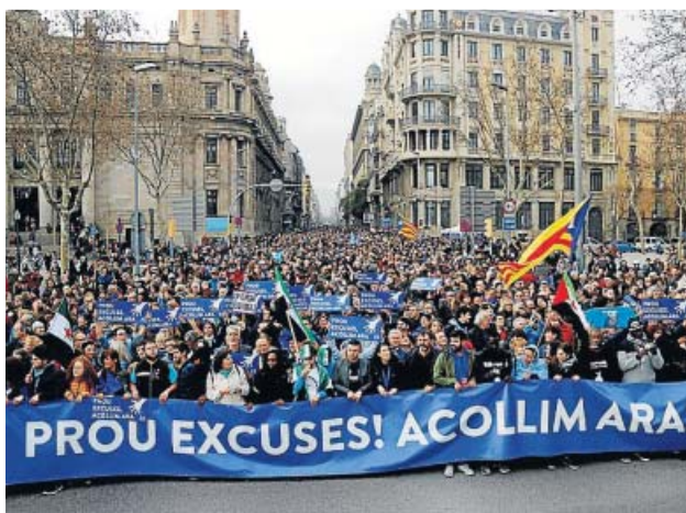
Una manifestación por la acogida de refugiados.

El Ajuntament de Barcelona prestó servicio en 2019 a 9.429 solicitantes de asilo, un 27% más que el año anterior