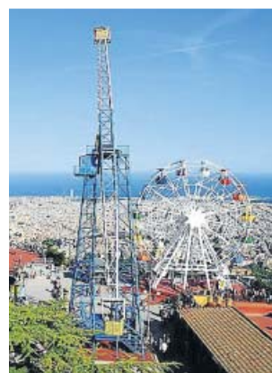
El Tibidabo volverá a abrir el sábado.

Durante 2019, el Tibidabo registró 718.326 visitantes, la cifra más baja desde 2015. La media de visitantes al día fue de 4.726. ● SANDRA MUNTANÉ