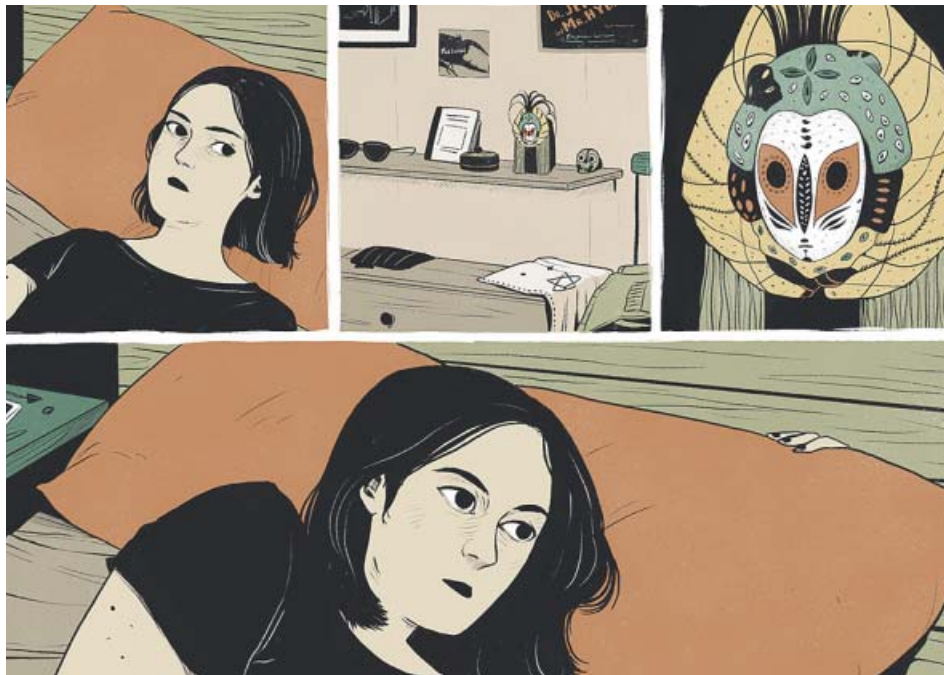
Algunas de las ilustraciones que componen la novela gráfica ‘Ocultos’. LAURA PÉREZ

A través de diferentes recursos gráficos, la artista valenciana —que recibió el premio a Mejor cómic nacional en el Festival del Cómic de la Comunidad Valenciana 2019—, crea un universo en el que conviven lechuzas, ovnis y fantasmas. Con un lenguaje que mezcla la ilustración y el cómic, la novela gráfica se compone de historias sueltas, pero con un hilo que las atraviesa. Si tiramos de la madeja, Ocultos nos permite cruzar momentáneamente al otro lado, a esa dimensión invisible cuyas leyes desconocemos, pero que en este volumen se hacen latentes. «Es un libro de sensaciones, cada historia cuenta algo distinto. Sobre lo aparente y los distintos trasfondos que no vemos, que intuimos y percibimos, cada uno a su manera. Trata de la quietud y la fragilidad», declara