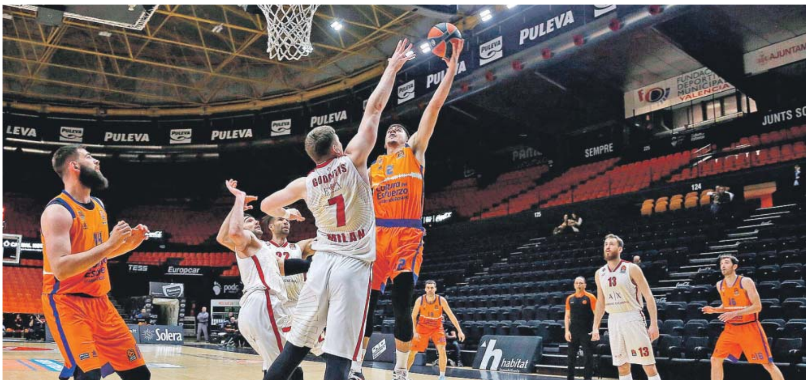
La Fonteta, vacía durante el partido de ayer entre el Valencia Basket y el Armani Milan.