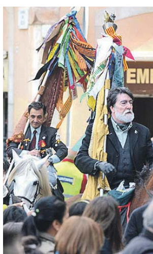
Desfilada de Sant Medir al barri de la Bordeta.

Diumenge. Sortida de la desfilada a les 10.45 hores des del carrer de la Constitució. Més informació a la pàgina web santmedir.org .