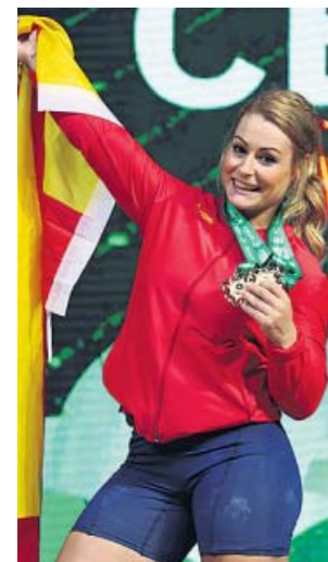
Lydia Valentín, una leyenda de la halterofilia mundial.

ñana siguiente. El calendario olímpico siempre ha tenido esta peculiaridad.