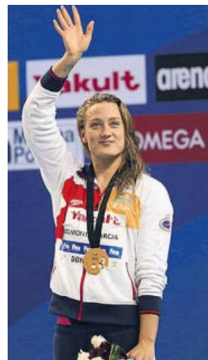
Mireia Belmonte, la mejor nadadora española.

Mireia se encontrará ante un dilema muy complejo si el COE le propone ser la abanderada: la ceremonia se celebra el día 24 de julio y ella debe nadar la ma-