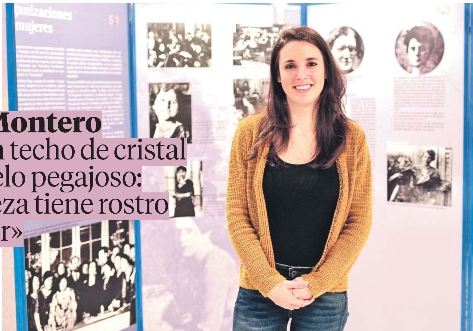
La titular de Igualdad, Irene Montero, en la exposición El voto de las mujeres , que se puede ver en el hall del ministerio. JORGE PARÍS