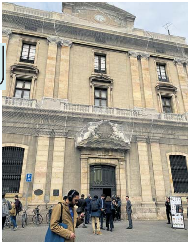
Entrada a l'Antiga Foneria de Canons, ahir al matí. PCR.

Rambla amb l'anunci de l'obertura d'un concurs durant el pròxim semestre per licitar un projecte «cultural, veïnal i amb vocació social» per a un edifici catalogat com a Bé Cultural d'Interès Local, propietat de la Generalitat des del 2003 –que el va comprar al Ministeri de Defensa– i que fa 17 anys que està tancat en un estat de conservació molt millorable al final de la Rambla, a tocar de Colom. Torra convocava ahir els mitjans de comunicació al petit