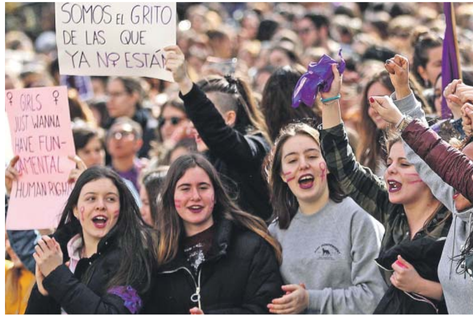
Un grupo de jóvenes en una manifestación feminista.

Pocas comisiones regionales han convocado paros este año para un día en el que se celebrarán numerosas actividades