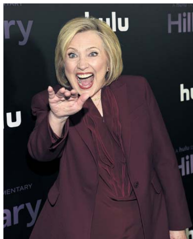
Hillary Clinton, en el estreno en Nueva York.

La serie Habanos , producción original de Movistar+ con Wanda Films y el instituto de cine ICAIC, comenzará este año su rodaje en Cuba. Está ambientada en la industria del tabaco de ese país durante los años 30 del siglo pasado y cuenta con guión de Alejandro Hernández.