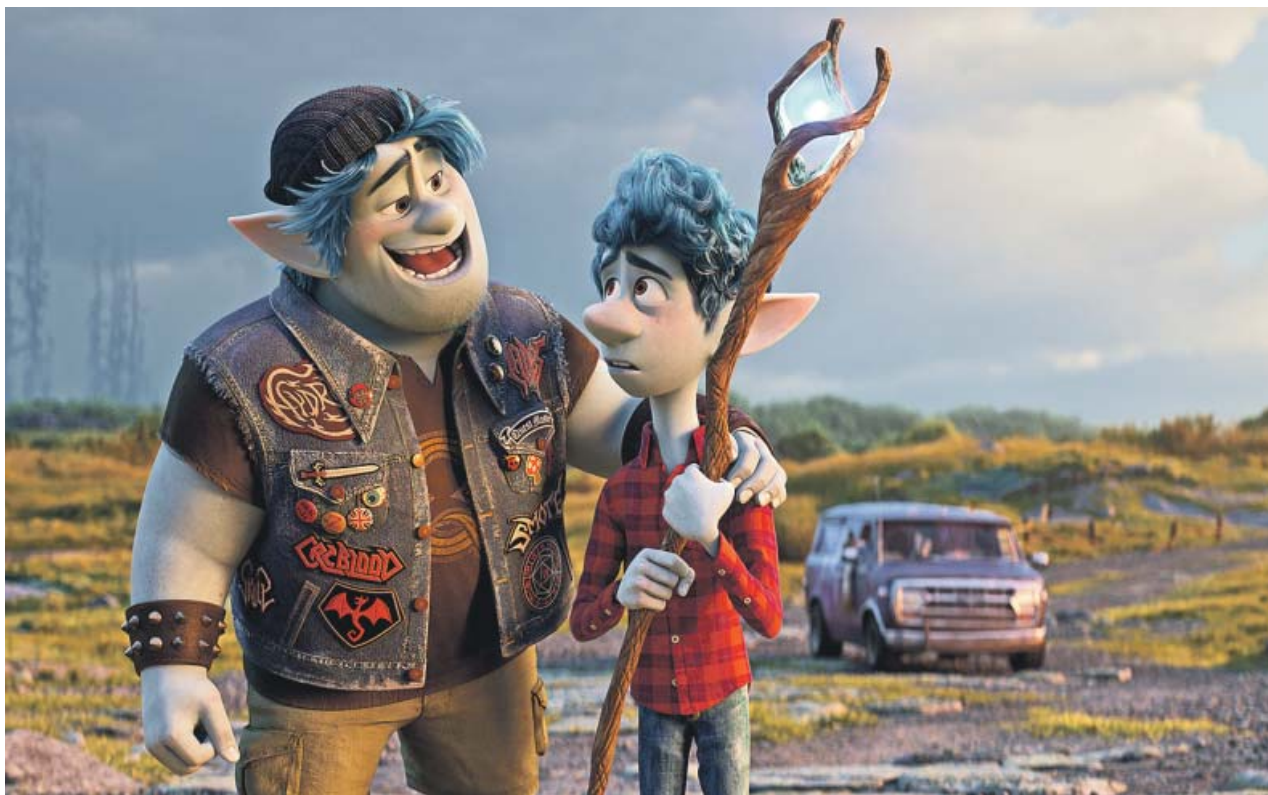
Barley e Ian Lightfoot, dos hermanos elfos en busca de un hechizo.