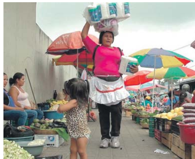
Dalt, imatge de la cinta Persèpolis , que es projecta el dijous 12 de març al MNAC. Sobre aquestes línies, film Cachada .

El centre cívic El Coll celebra la catorzena edició del cicle aDona't, Jornades Feministes del Coll , amb tallers, projeccions i un vermut musical que giren entorn el llenguatge inclusiu i la comunicació,