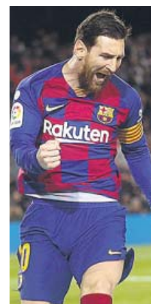
Messi celebra su gol a la Real Sociedad.