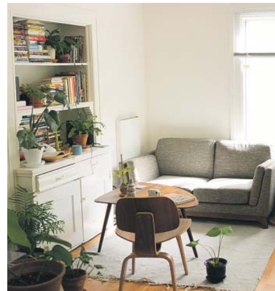
La disponibilidad inmediata de estas casas las hace muy atractivas.

«Es bueno tener un marco estable de puesta en común de la situación», aseguró Illa, que aseveró que las decisiones se van tomando de acuerdo «a evidencias científicas». ● M. T. F.