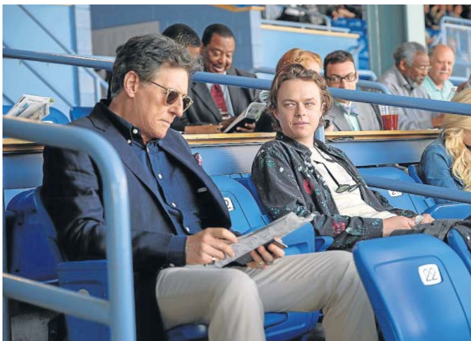
Gabriel Byrne y Dane DeHaan, protagonistas de 'ZeroZeroZero'.

Adaptando el libro homónimo de Roberto Saviano ('Gomorra'), 'ZeroZeroZero' muestra al tráfico de cocaína como verdadero motor de la economía global