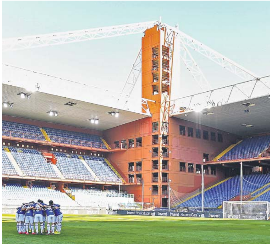
Los jugadores de la Sampdoria, ayer, en un estadio vacío en la Liga italiana.

Más drásticas han sido las medidas adoptadas por el Gobierno italiano, que ha ordenado que todos los partidos de la Serie A se disputen a puerta cerrada. Además, los futbolistas saltan al campo separados por un metro y no se estrechan las manos antes de competir, aunque, obviamente, luego sí hay contacto físico entre ellos durante el partido. Esas restricciones podrían incrementarse en los próximos días porque el ministro del Deporte, Vincenzo Spadafora, pidió la «interrupción inmediata» del fútbol, por lo que no se descarta que la Liga italiana se suspenda.