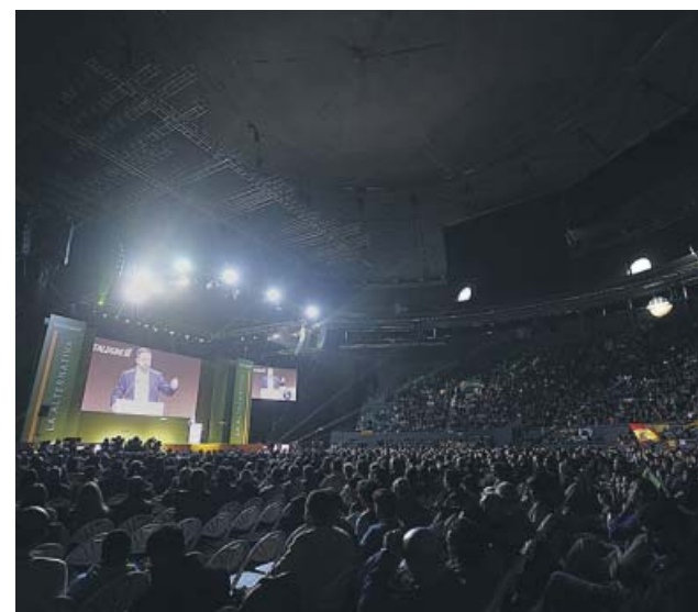
Vista general de Vistalegre durante el discurso de Abascal.

Inés Arrimadas accede al cargo de presidenta del partido después de ser una de las personas de más confianza de Albert Rivera. En 2017, Cs ganó las elecciones en Cataluña con ella al frente, pero no pudo formar Gobierno. Posteriormente, en 2019 se convirtió en la portavoz del partido en el Congreso. Ahora, asume un reto con el objetivo de recuperar al partido tras el batacazo del 10 de noviembre. ●