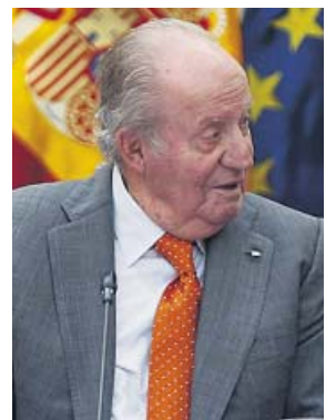
El rey Juan Carlos I, en una imagen de archivo.

Por otro lado, el Código Civil refleja que no se puede renunciar legalmente a una herencia paterna en vida, solo se