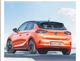
El nuevo Corsa-e se suma a la moda de los eléctricos.

Para cargar la batería, Opel ofrece de serie un cargador interno de 7,4 kW y otro opcional de 11 kW que es el recomendable para que los tiempos