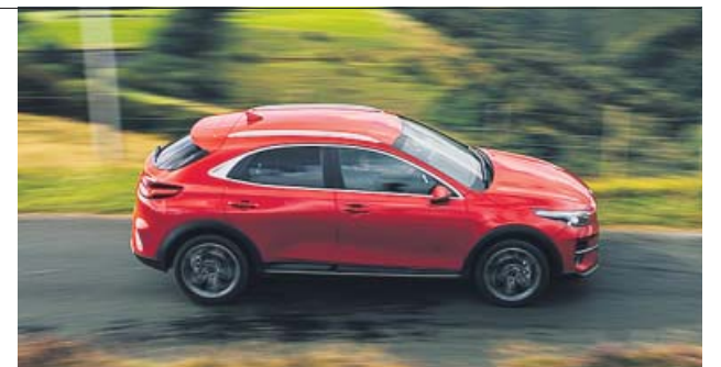
La autonomía en modo eléctrico llega a los 58 kilómetros.

Ya se pueden hacer pedidos del nuevo XCeed híbrido enchufable, modelo que Kia pone a la venta desde 26.150 euros. Este atractivo SUV dispone de una batería de 8,9 kWh, un motor eléctrico de 44,5 kW y otro de gasolina de 1,6 litros para ofrecer un total de 141 CV de potencia. La autonomía en modo totalmente eléctrico es de 58 kilómetros y dispone de la etiqueta «0» de la DGT.