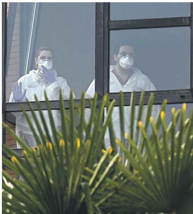
Dos trabajadores en la residencia Monte Hermoso, en Madrid.

La Fiscalía decidió ayer iniciar una investigación por si se hubieran cometido ilícitos penales, aunque ese centro no es el único que ha visto cómo varios de sus interinos fallecían en los últimos días. En Madrid, también han muerto cinco ancianos de entre 88 y 94 años en la re-