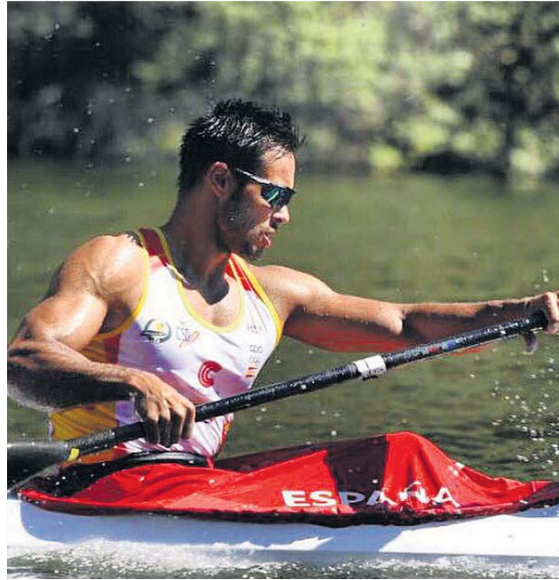
TWITTER RODRIGO GERMADE

Sevillana de 33 años, la windsurferista es doble campeona del mundo en las clases Mistral (2005) y RS:X (2010). Se tomó un paréntesis en su carrera para ser madre, lo que le costó el apoyo de sus patrocinadores y puso en peligro su carrera, pero nunca se rindió y ha vuelto con más fuerza que nunca. Ya tiene el billete para Tokio y allí buscará la medalla.