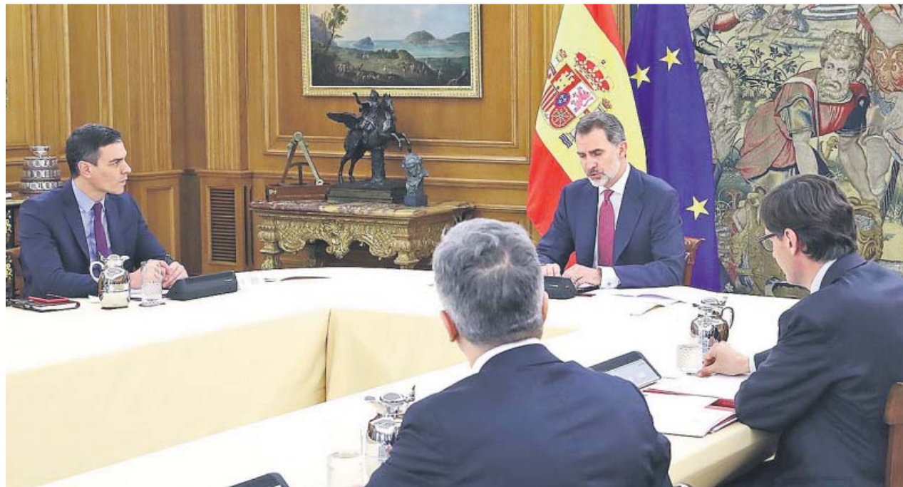
El rey Felipe VI, reunido ayer en Zarzuela con Pedro Sánchez y el Comité de Gestión Técnica del coronavirus.

«Es el momento de resistir y tenemos que adaptar nuestros modos de vida a las indicaciones de autoridades y expertos para ganarle al virus. Todos debemos contribuir al esfuerzo colectivo con nuestras acciones por pequeñas que sean», dijo.