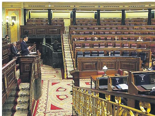
El pleno del Congreso, semivacío, ayer.

A pesar de esa falta de autocrítica y con la excepción de Vox y