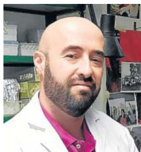
Miembro del Instituto de Investigaciones Biomédicas A. Sols