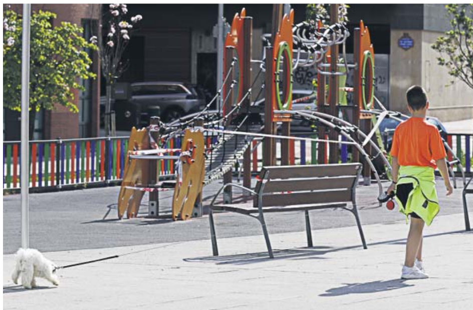
Un niño pasea con un perro junto a un parque infantil antes de decretarse el confinamiento.

LA CONSELLERIA de Salud prevé decidir sobre los niños con su propio plan de desconfinamiento