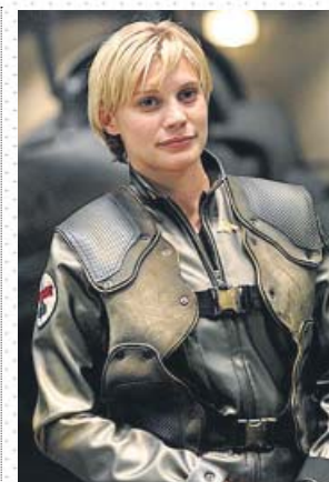
Katee Sackhoff, en su papel de Kara Starbuck.

Tan asfixiante como corresponde a una historia de refugiados y fugitivos, agraciada con figuras memorables (del coriáceo Adama -Edward James Olmos- a la presidenta Roslin -Mary McDonnell- y su realpolitik en el vacío), Battlestar Galactica es un cuento de criaturas y creadores centrado en la