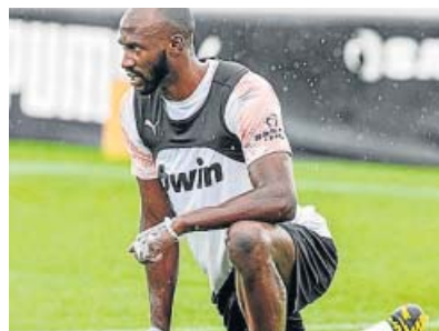
Eliaquim Mangala se ejercitó con guantes en el entrenamiento de ayer del Valencia

... y tres jugadores del Betis confirman sus casos