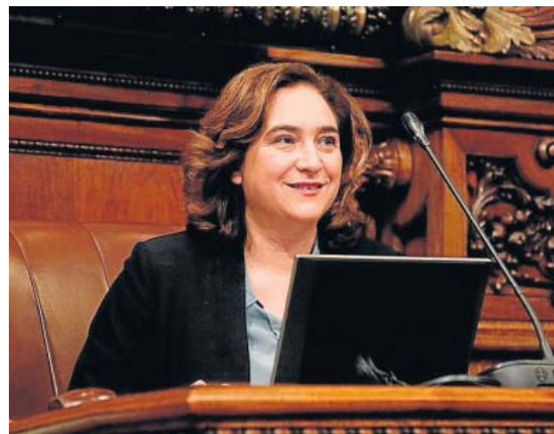
L'alcaldesa Colau durant el ple del passat gener.

Els grups d'ERC, Junts per Catalunya (JxCat), BCanvi, Ciutadans i el PP van reme-