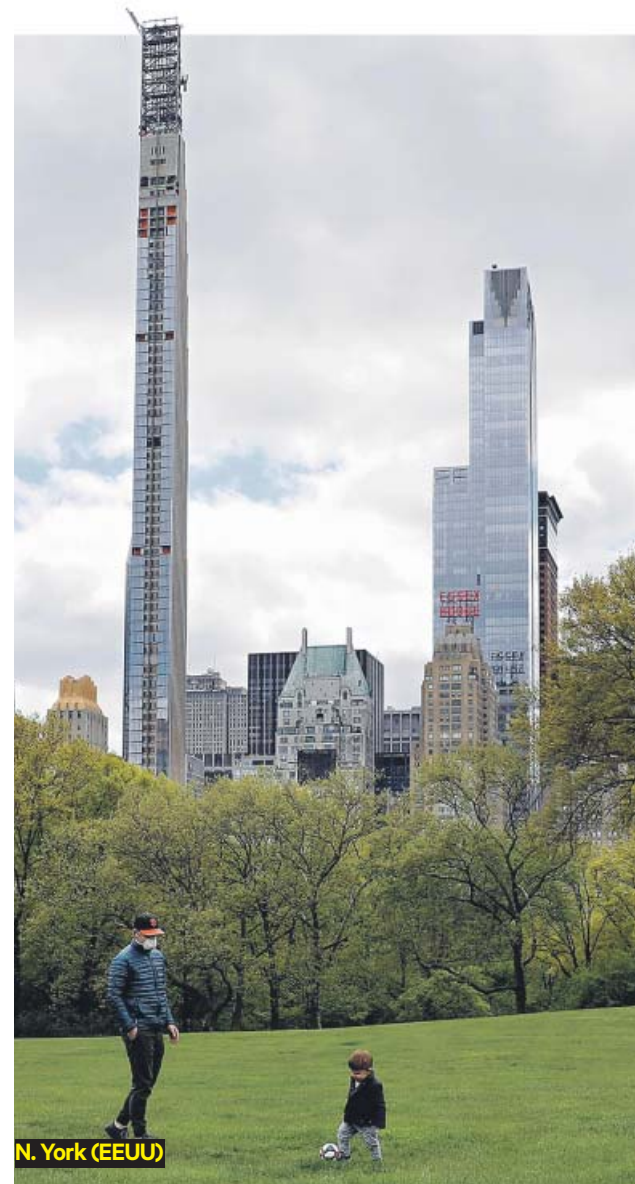
N. York (EEUU)