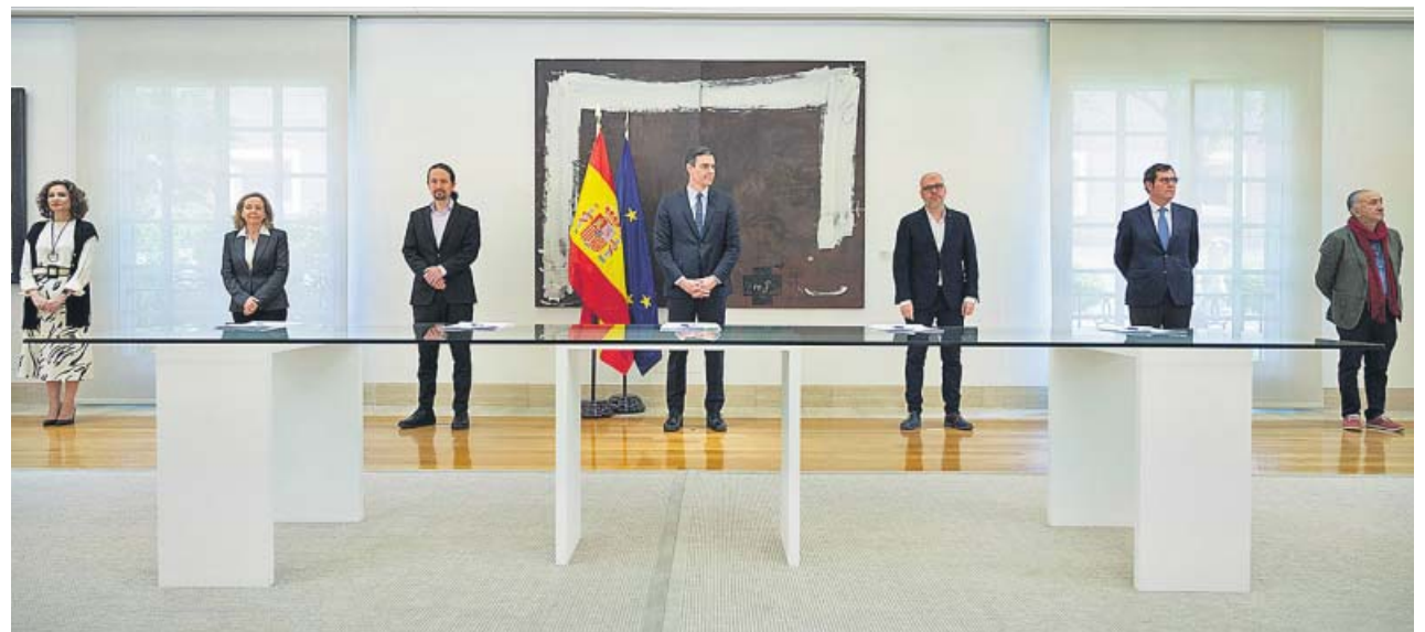
Momento de la firma ayer en Moncloa del acuerdo para prorrogar los ERTE por la Covid-19 hasta el 30 de junio.

En el otro extremo, asienta condiciones para favorecer que los empresarios vayan rescatando progresivamente a sus trabajadores del ERTE a medida que la actividad lo vaya permitien-