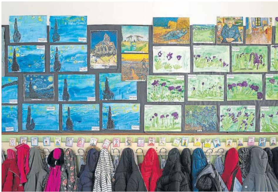
Jaquetes i dibuixos d'alumnes penjats en una escola. DEPARTAMENT D'EDUCACIÓ