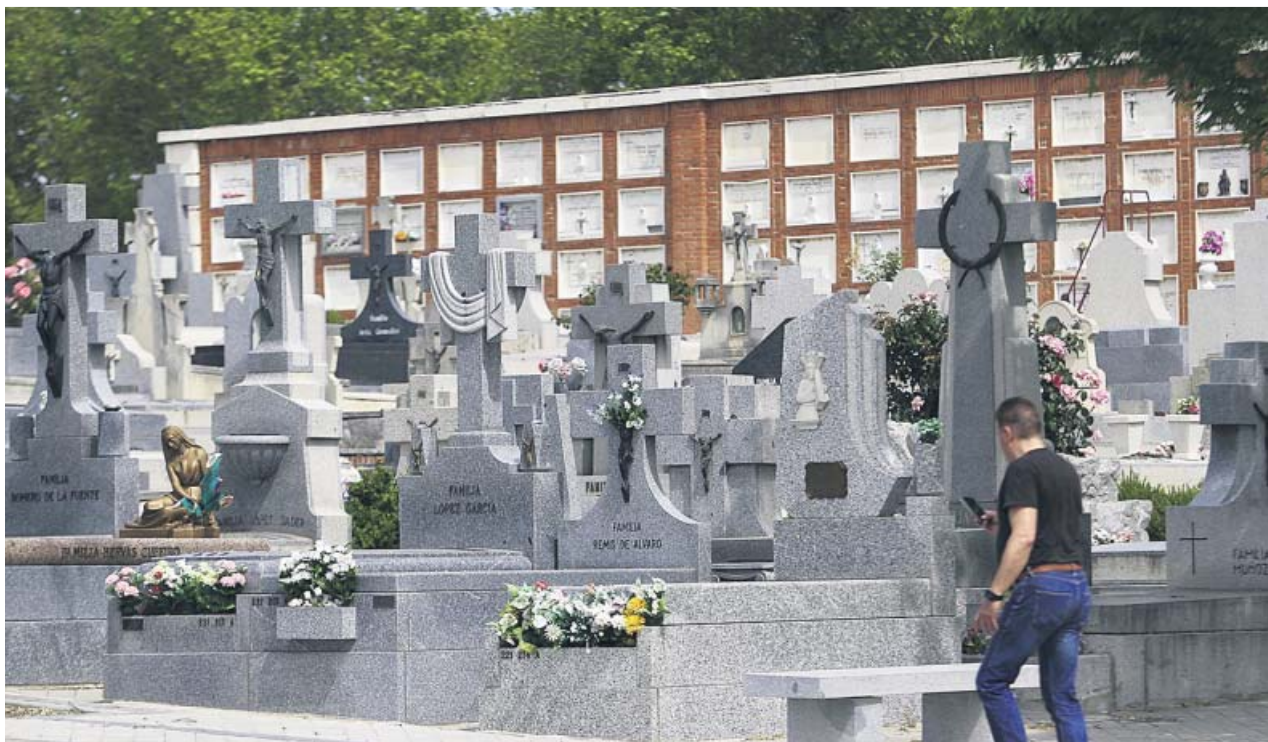
Tumbas y nichos en el cementerio de la Almudena de Madrid.