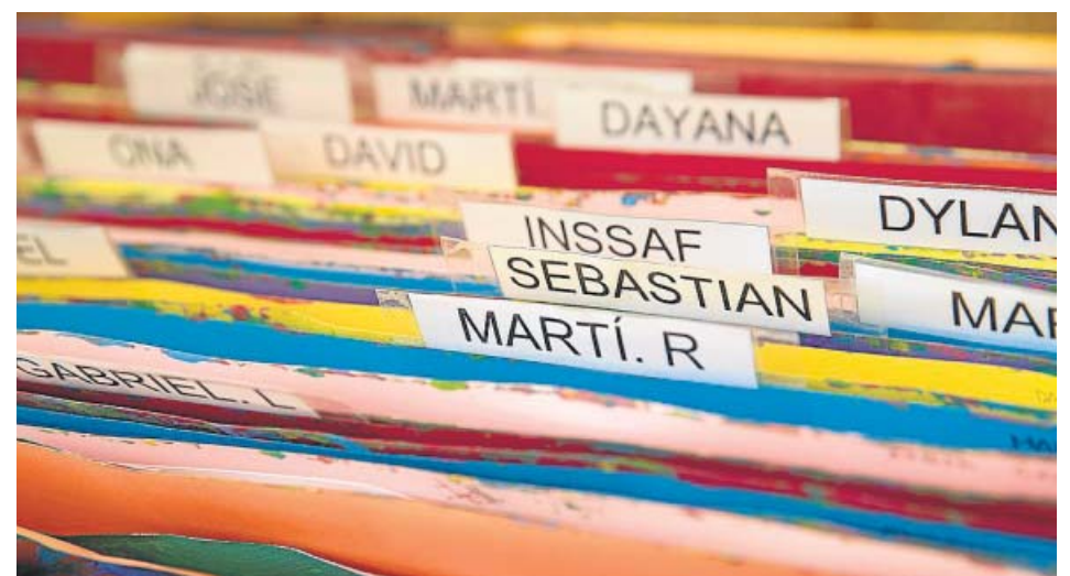
Carpets amb material d'alumnes. DEPARTAMENT D'EDUCACIÓ

A l'educació primària, ESO i batxillerat -excepte la modalitat d'artístic- tenen preferència els alumnes que provenen d'un centre adscrit al centre demanat. A ESO i batxillerat, només per alguns centres, també tenen preferència els alumnes que cursen simultàniament ensenyaments professionals de música i dansa i programes esportius d'alt rendiment. En tots els ensenyaments obligatoris i el batxillerat, per a l'ordenació de les sol·licituds s'apliquen a continuació els criteris generals de prioritat, que són els següents: - Si actualment hi ha germans matriculats al centre o el pare, mare, tutor legal hi treballa: 40 punts. - Per proximitat del domicili o del lloc de treball al centre sol·licitat en primer lloc (només una opció): ● Domicili a l'àrea de proximitat del centre: 30 punts. ● Lloc de treball a l'àrea de proximitat del centre: 20 punts. ● Domicili al mateix municipi del centre: 10 punts. ● A la ciutat de Barcelona, domicili al mateix districte del centre: 15 punts. - Si el pare, mare o tutor legal reben l'ajut de la renda garantida de ciutadania: 10 punts. - Per discapacitat igual o superior al 33% de l'alumne o d'un familiar de primer grau: 10 punts. - En el batxillerat també es té en compte la nota mitjana. Com a criteris complementaris de desempat, hi ha el de família nombrosa o monoparental (15 punts).