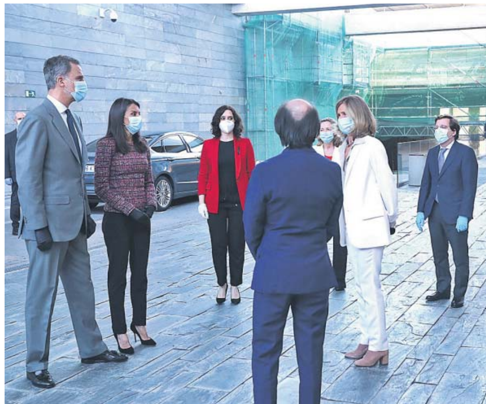
Los Reyes asisten al acto de presentación del Informe Cotec 2020 en Madrid.

Eso sí, el Banco de España advierte que las medidas planteadas por la Unión Europea «no son suficientes». Y es que la «severidad, temporalidad y la globalidad» de la crisis demandan que en una primera fase que las acciones sean «contundentes, acotadas en el tiempo y coordinadas». Por ello, pide actuar «rápido y con ambición» para que la crisis sea lo menos lesiva. ●