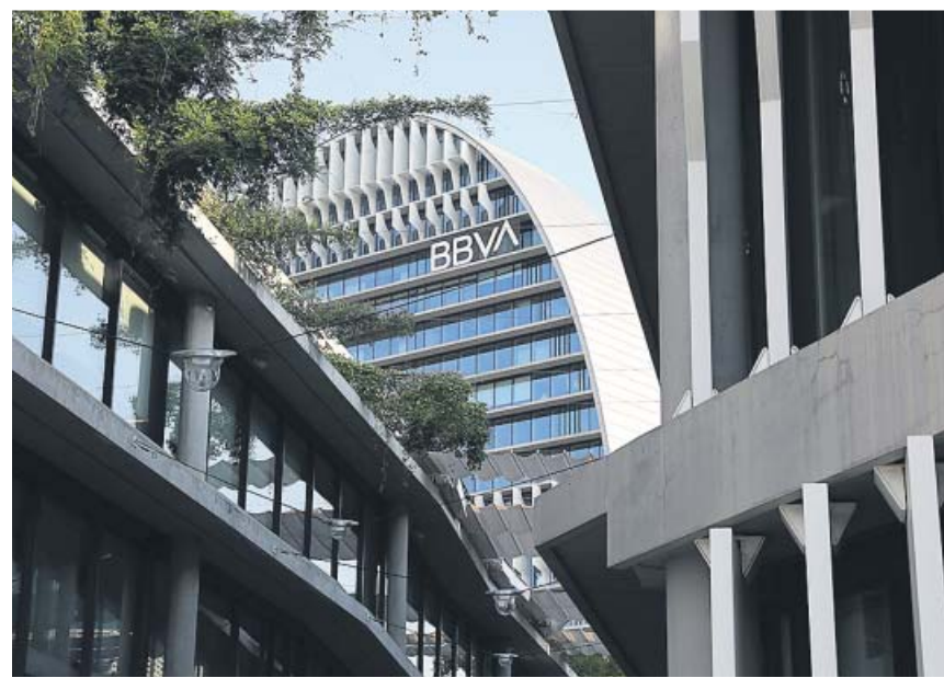
BBVA acompaña els botiguers en el seu retorn a l'activitat. BBVA

Será una prestación uniforme en todo el país, aunque con matices porque las comunidades autónomas podrán mejorarla. «El IMV será igual en toda España y las comunidades autónomas podrán complementar las cantidades», aseguran. «Estamos cerrando los detalles de esta convivencia, pero sí serán compatibles el IMV y las ayudas autonómicas», añaden. ●