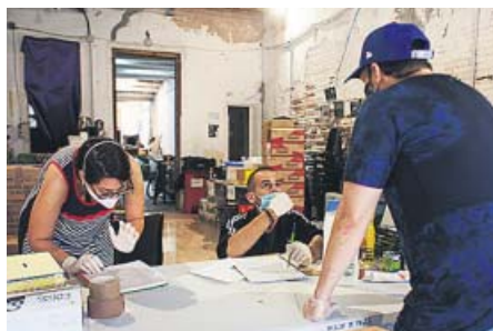
Miembros de la red de apoyo de Vallcarca reparten comida a los vecinos del barrio más necesitados en un centro social ocupado.