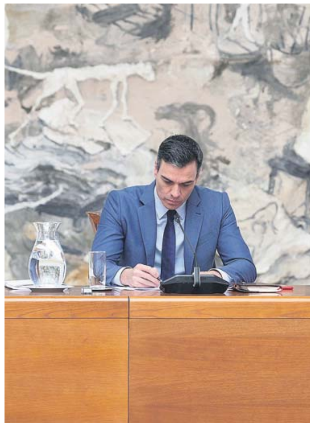
Sánchez, ayer en el Comité Técnico para la Desescalada.