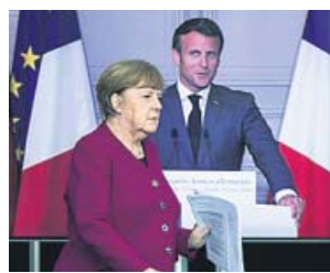
Merkel y Macron tras la reunión que tuvieron ayer.

su acuerdo, Berlín acepta que se concedan subsidios a fondo perdido a través de deuda de la Unión Europea. Y por su parte, París accede a que se haga a través del presupuesto europeo y limitado a 500.000 millones de euros, lejos del billón y medio de euros que se planteaba en un primer momento. «Es necesario un esfuerzo colosal y