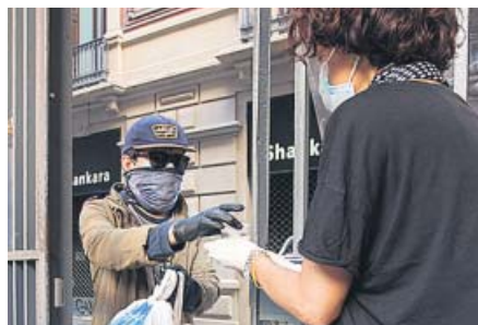
Una voluntaria de la iglesia de Santa Anna da una taza de café caliente a un hombre. La parroquia atiende a muchas personas sin hogar.

además le están ayudando a buscar trabajo a su hija de 20 años, también con un ERTE porque la cafetería donde estaba empleada tuvo que cerrar por la pandemia. Su mujer, explica, «trabaja solo tres horas al día limpiando casas» y su otro hijo tiene solo 17 años.