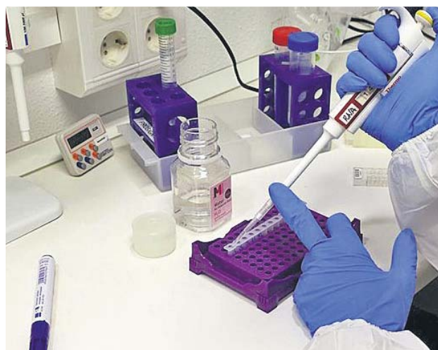
Ensayo de una vacuna en un laboratorio.

En el día 43 del estudio, dos semanas después de que se les inyectara la segunda dosis de la vacuna a los participantes del grupo de 25 microgramos, «los niveles de anticuerpos vinculantes estaban en los niveles vistos en sérum convalescente (muestras de sangre de personas que se han recuperado de la Covid-19)».