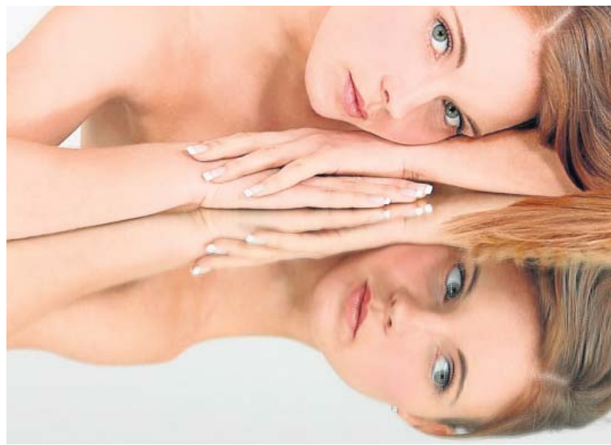
Es importante que las imágenes que los pacientes envían sean de calidad.

En este texto se recogen los datos de un estudio en que se describen 9 series de infecciones secundarias como consecuencia de «eventos sociales de corta duración, como una comida o una visita corta», en China y otros países en los que se ha registrado una alta tasa de transmisión del virus. De hecho, se precisa que «por causas aún no conocidas, parece que hay eventos con personas infectadas que muestran una altísima tasa de transmisión del virus» frente a otras situaciones en las que la tasa de transmisión es mucho menor. También se avisaba entonces de la falta de equipos de protección (EPI) en España para hacer frente al virus. ●