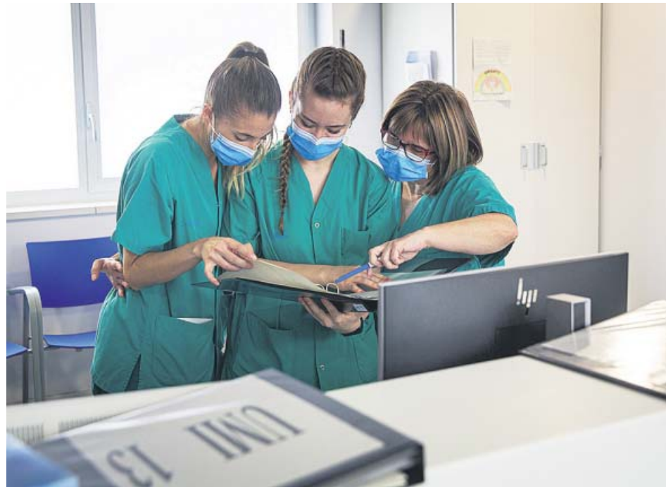
Personal sanitario en la unidad polivalente de críticos en el Hospital de Logroño.