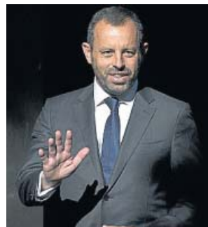
Sandro Rosell, en una imagen de archivo.

Por otro lado, valoró el mandato de Josep Maria Bartomeu: «Los mandatos se valoran por el mandato, no el último año. El presidente Bartomeu es íntimo amigo mío y le tengo mucha más empatía. Pero diría que el