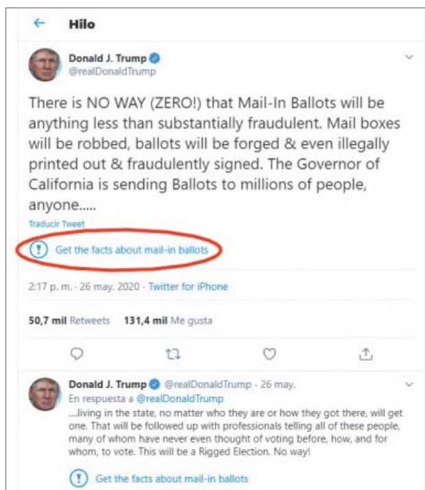
Dos tuits de Trump cuya veracidad fue puesta en duda.

Este martes, esa red social publicó un enlace y una alerta