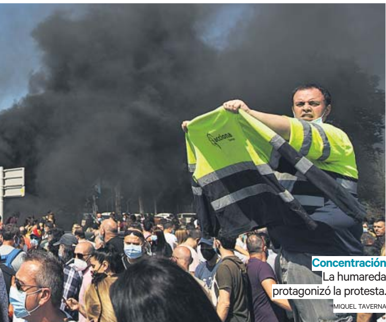
Concentración La humareda protagonizó la protesta. MIQUEL TAVERNA