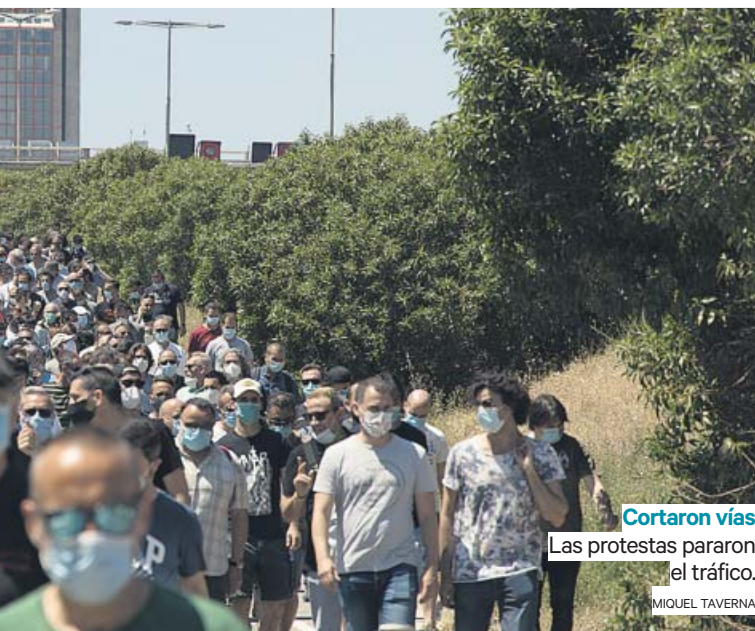
Cortaron vías Las protestas pararon el tráfico. MIQUEL TAVERNA

AMBOS presidentes acordaron ayer activar «todos los mecanismos necesarios» para evitar el cierre