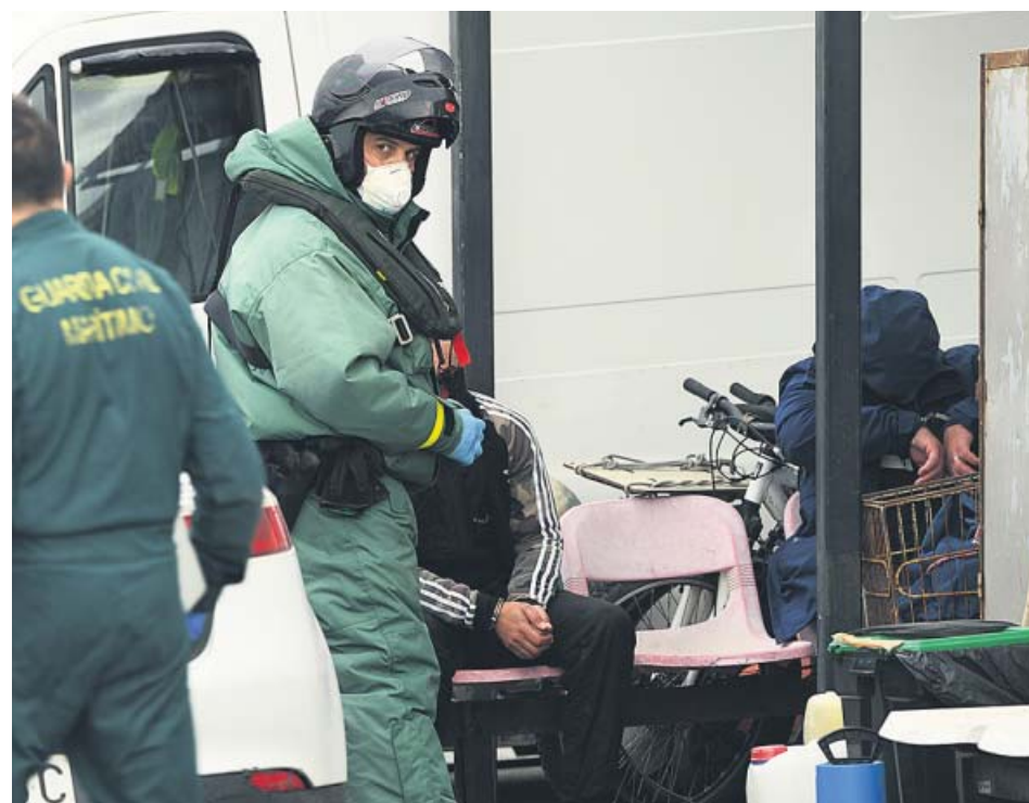
Guardias civiles protegidos contra el coronavirus en Ceuta.

casos totales se han confirmado desde que hay datos. La nueva cuenta de Sanidad vuelve a incluir de nuevo resultados de algunos test serológicos.