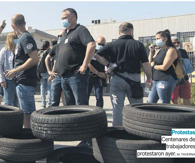
Protestas Centenares de trabajadores protestaron ayer. M. TAVERNA