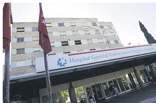
El Hospital Gregorio Marañón de Madrid desarrolla el estudio.

«Si esto se confirma, justificaría la posibilidad de utilizar estos fármacos de manera preventiva en personas de riesgo, como los trabajadores sanitarios o personas que tienen contacto con enfermos de Covid», declara el consultor en enfermedades infeccio-