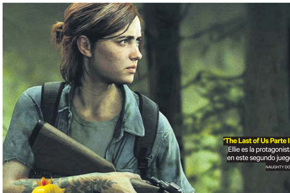
‘The Last of Us Parte II’ Ellie es la protagonista en este segundo juego NAUGHTY DOG

El perfil de luchadora está representado por Chun-Li, que nació en 1991 en Street Fighter II demostrando que las mujeres también son fuertes, pueden pelear y no necesitan que las defiendan. Junto a ella, hay otros personajes como su compañera Cammy, Blaze Fielding ( Street of Rage , de 1991) o Mai Shiranui ( Fatal Fury 2 , de 1992), todas ellas chicas duras pero que siguen con el estereotipo de que han de ser bellas, llevar po-