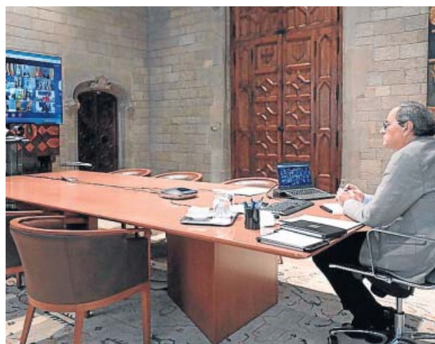
Quim Torra, ayer, en la reunión de líderes autonómicos.

En ese sentido, fuentes de la Generalitat explicaron que con el 1% de déficit el Govern podría endeudarse hasta los 2.200 millones de euros, mientras que con el 0,2% solo serían 440.