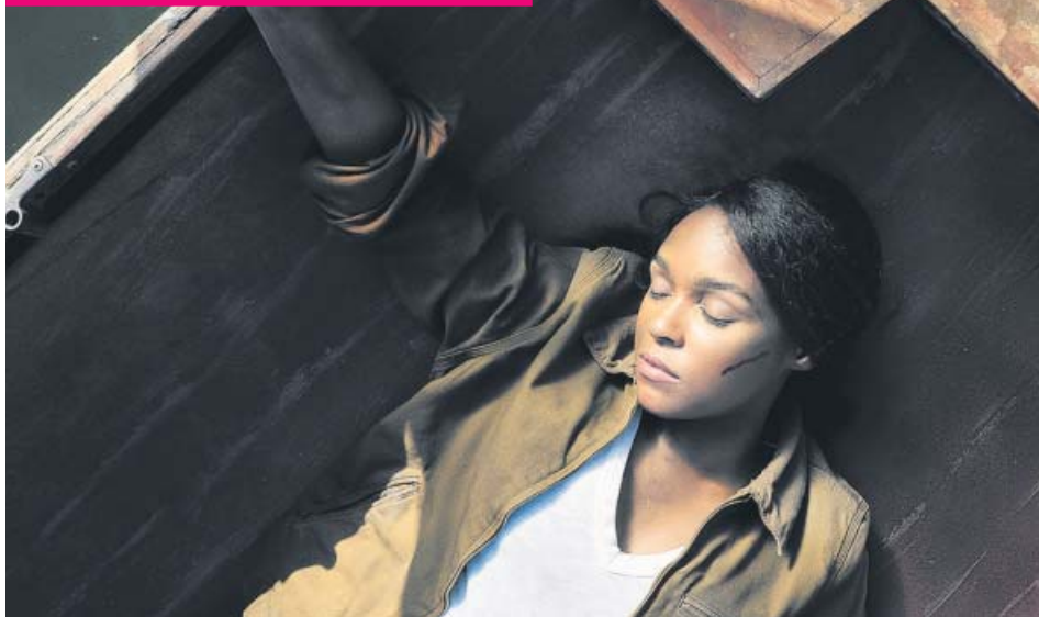
La protagonista despierta sin memoria en una barca que flota en mitad de un lago. AMAZON