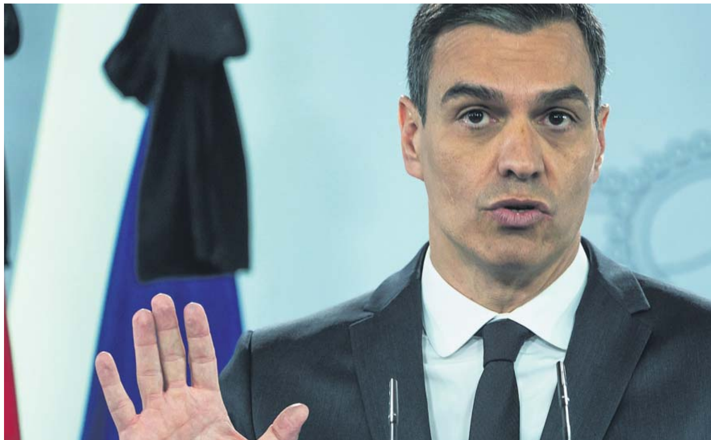
El presidente Sánchez durante su comparecencia, ayer, tras la videoconferencia con los presidentes autonómicos.

Con la gestión autonómica de la fase 3, podrá darse la paradoja de que parte de una comunidad esté en manos de su gobierno regional y otra parte, del Gobierno central. Sería el caso en concreto de Barcelona, que, co-