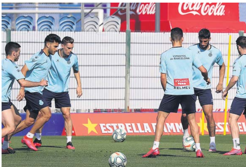
Los jugadores del Espanyol tuvieron el fin de semana libre y hoy vuelven al trabajo.