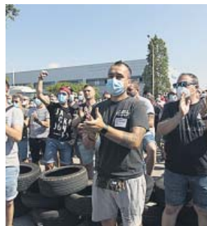
Protestas de la plantilla de Nissan, el jueves. MIQUEL TAVERNA

Montcada i Reixac y Sant Andreu de la Barca. La noticia, no por esperada y temida, dejó de conmocionar a unos trabajadores que el mismo jueves protestaron enérgicamente contra la decisión que les trasladó el gigante automovilístico nipón. El desmantelamiento afecta