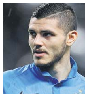
Mauro Icardi antes de un partido con el Inter.

dad inferior a la inicialmente estipulada. El PSG podía hacerse con Icardi por 70 millones, pero el Inter ha aceptado rebajar la cantidad a 50 más cinco en bonus. Se presume, ante la crisis generalizada, un mercado más austero.