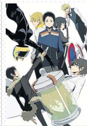
La serie se basa en las novelas de Ryohgo Narita. NETFLIX

Porque, si esta serie pretende demostrar algo, es cómo cualquier rostro con el que uno se cruza en un paso de cebra puede tener detrás una historia memorable: desde un chavalín de pueblo recién llegado a la gran ciudad hasta ese camarero capaz de arrancar una máquina expendedora de cuajo. Pasando, claro