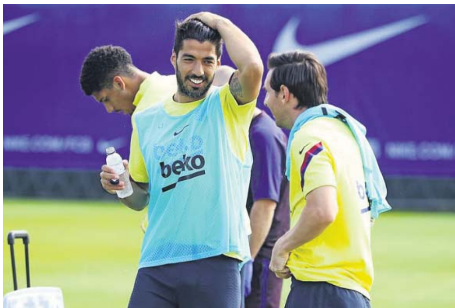
El Barça se ejercitó el sábado, descansó ayer y hoy comienza los entrenamientos completos.

Toda la información sobre cómo afecta el coronavirus al mundo del deporte, en nuestra web