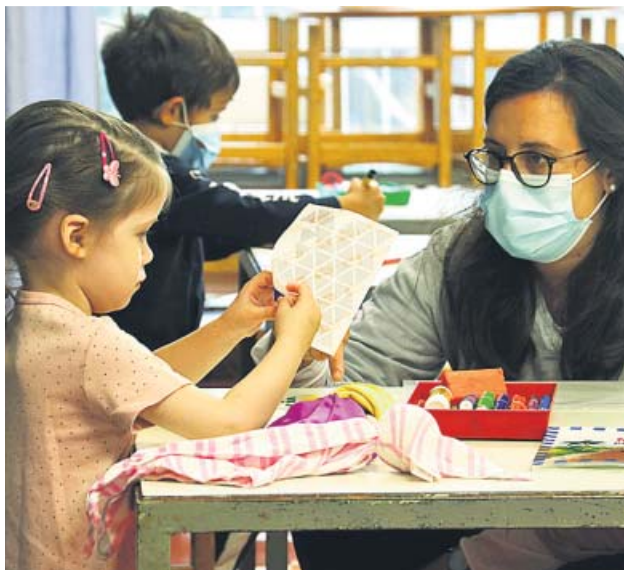
Una clase de infantil del Costa Llobera de Barcelona, ayer.

Més informació: barcelonactiva.cat/autonomes