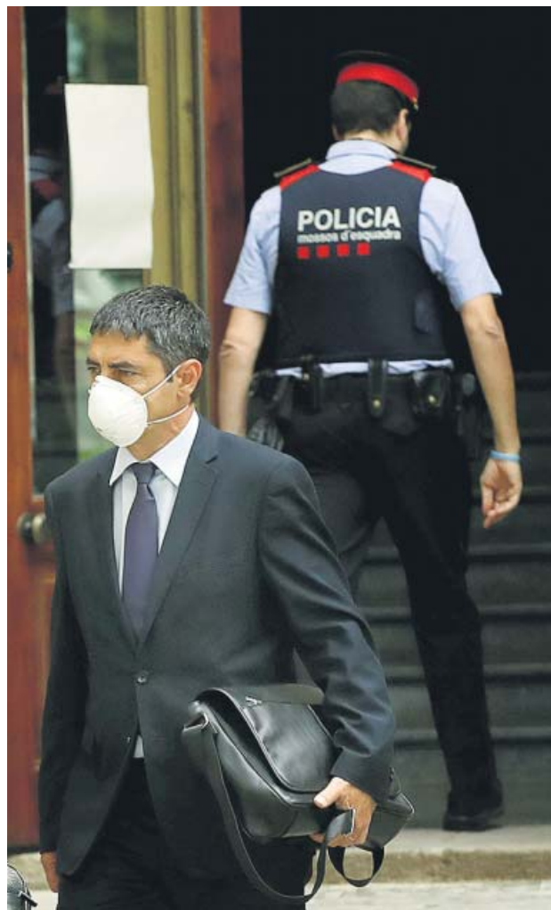
Trapero, ayer, saliendo de la Audiencia de Barcelona.