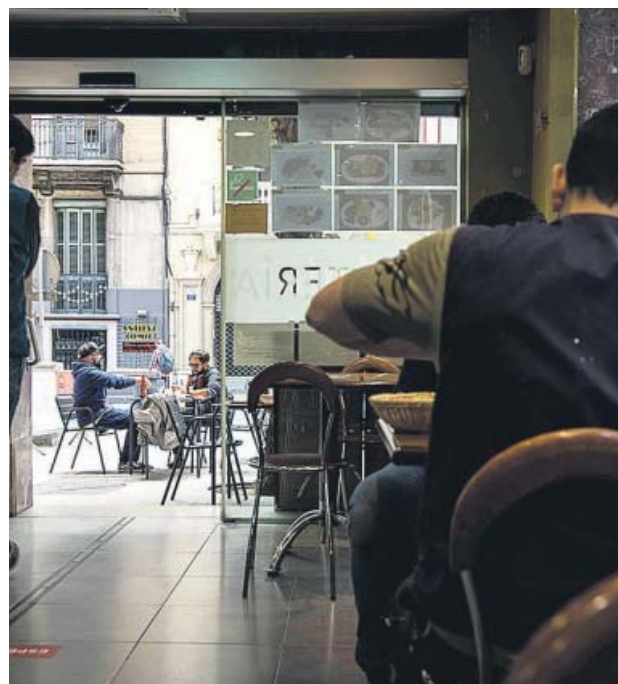
Interior de un restaurante de Barcelona, ayer.