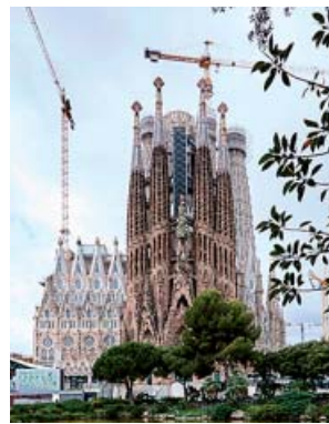
Vista de la Sagrada Familia ayer lunes.

lud de los ciudadanos durante la pandemia. Posteriormente, los residentes de la ciudad podrán reservar determinadas horas de visita para disfrutar de la experiencia de contemplar el interior de la Sagrada Familia de forma gratuita, a su ritmo, con un aforo más reducido y sin presencia mayoritaria de turistas. Esta nueva modalidad de visita comenzará el fin de semana del 18 y 19 de julio y está previsto para todas las tardes de los fines de semana hasta el 31 de diciembre. Los residentes podrán reservar hora para realizar estas visitas a partir del 16 de junio a través del sitio web de la Sagrada Família. ● J.C.