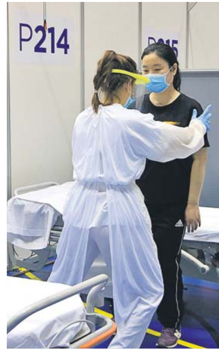
Una rehabilitadora de Vall d'Hebron trata en el Pavelló Salut a una exenferma de Covid-19 que presenta secuelas motoras.