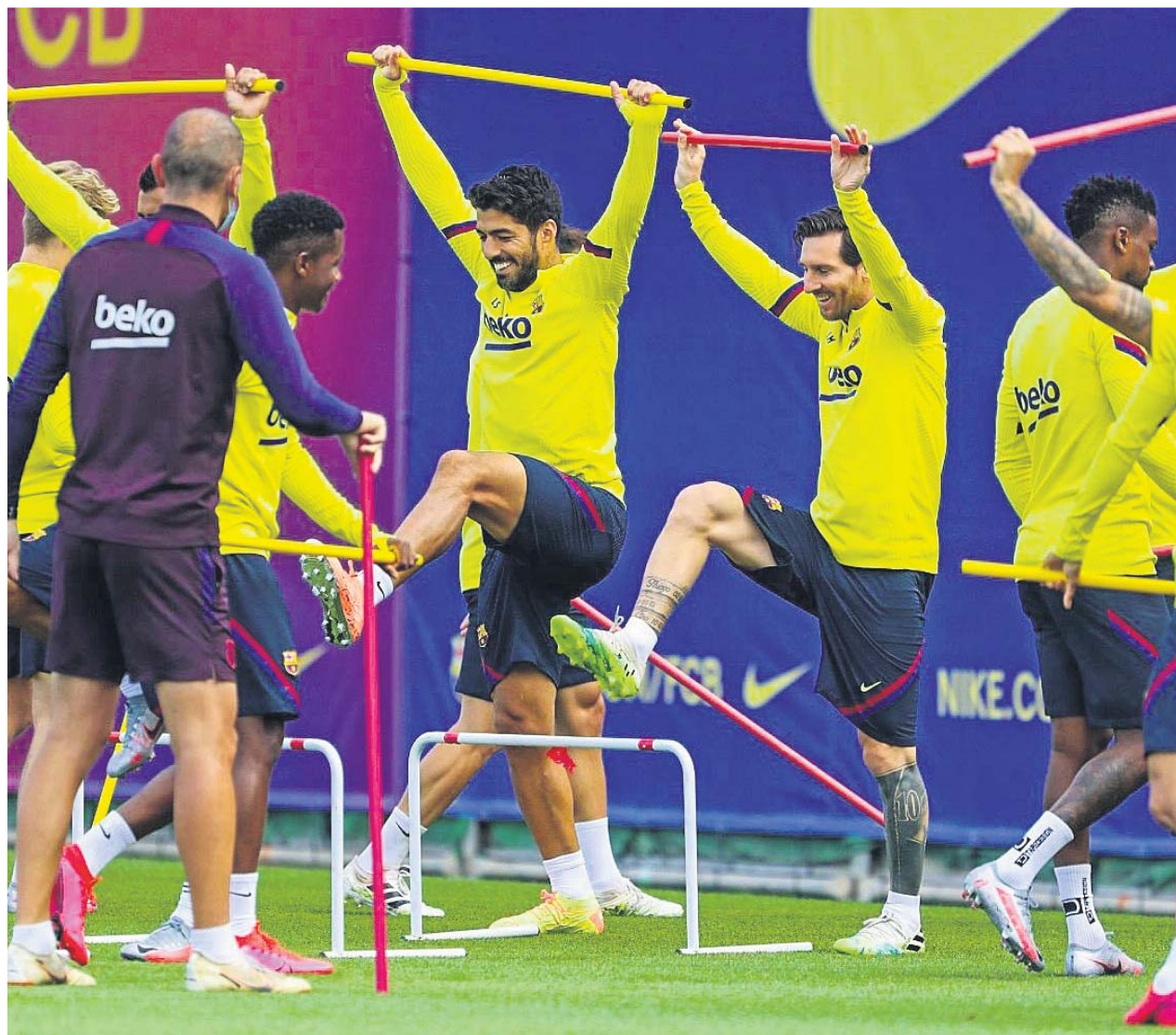
Messi y Suárez participan ayer en el entrenamiento del equipo.

Su sociedad particular ha supuesto casi 80 goles creados por ellos mismos: asistencia de uno, gol del otro. Su temporada con más tantos de esta manera fue la segunda, la 15/16, en la que se repartieron 18 pases de gol entre ellos, 10