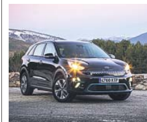
El e-Niro es uno de los modelos eléctricos de Kia.

Como la adquisición de modelos eléctricos o híbridos enchufables genera inquietud, Kia ha establecido una serie de compromisos con quienes los compran. Así, además de los siete años de garantía (incluida la batería) disponible para todos los modelos o el mantenimiento gratuito durante los primeros tres años, Kia ofrece la posibilidad de cambiar el coche si durante el primer mes o tras 1.000 kilómetros el cliente no queda satisfecho. Otro compromiso es, si se adquiere un eléctrico, el de disponer duran-