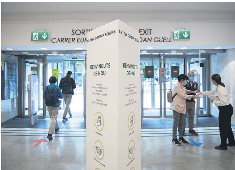
Cientes, ayer, en un acceso a El Corte Inglés de Maria Cristina, en la Diagonal. MIQUEL TAVERNA