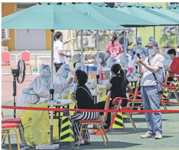
Pruebas de Covid-19 en la calle, en Pekín.