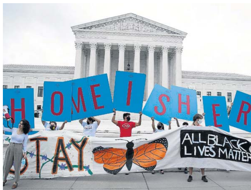
Manifestantes contra el plan de expulsión de jóvenes inmigrantes, ayer en Washington.

En cuanto a la evolución anual de 20minutos , el crecimiento de usuarios en sites (incluyendo todas sus webs vinculadas) fue del 20% en un año, según constata el medidor oficial Comscore. Mientras, la página principal del periódico ha tenido un crecimiento del 25% en internet entre mayo de 2019 y de 2020. Es el más alto entre los periódicos que están en el top 10 y tienen edición digital e impresa. En el caso de El Mundo.es , su crecimiento ha sido del 16%; ABC ha subido un 23%, La Vanguardia un 7% y El País se ha mantenido en los 23,2 millones de usuarios, igual que el pasado año. ●