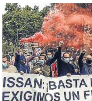
Marxa de treballadors de Nissan ahir a Barcelona.

Uns 700 empleats de les plantes de Nissan a Zona Franca, Montcada i Reixac i Sant Andreu de la Barca, afectats pel tancament anunciat per l'automobilística nipona el passat 28 de maig, es van manifestar ahir pel centre de Barcelona per reclamar la derogació de l'article 51 de l'Estatut dels Treballadors sobre acomiadaments col·lectius, i per recuperar l'autorització administrativa dels Expedients de Regu-