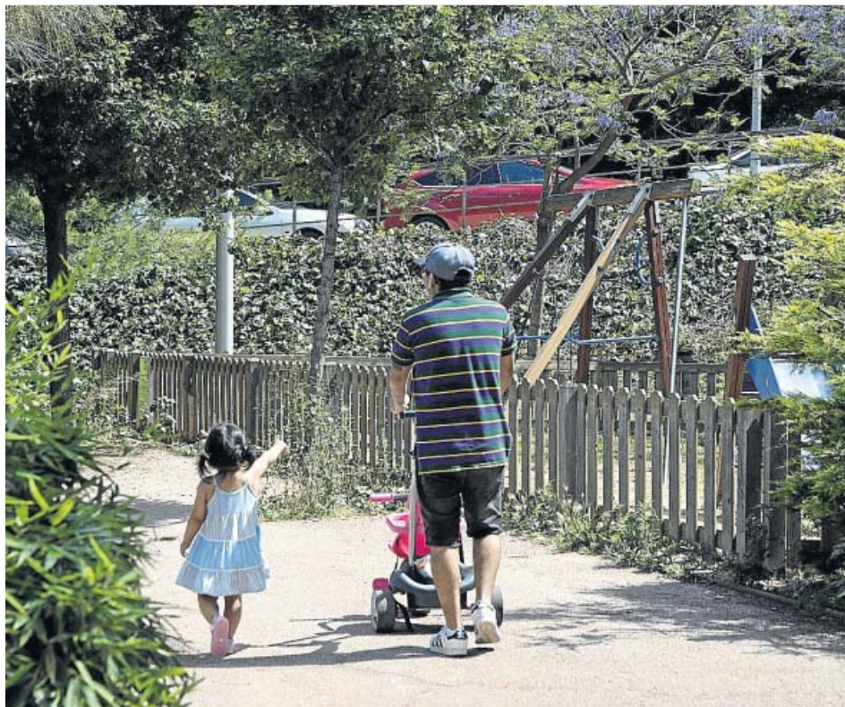
Todos los parques infantiles y las zonas de juegos abren hoy en Barcelona.

La Generalitat ha sido muy crítica desde el primer momento con la gestión de la pandemia realizada por el gobierno de Pedro Sánchez, principalmente por el nombramiento de un