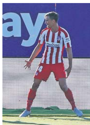
Marcos Llorente fabricó el gol del Atlético.

Diego Costa formó el ataque rojiblanco junto a Marcos Llorente, el 'delantero' que ha descubierto Simeone y que está demostrando un gran rendimiento cuando juega cerca del área. Y fue precisamente Llorente quien se encargó de fabricar el gol de la victoria colchonera al cuarto de hora. Con un control