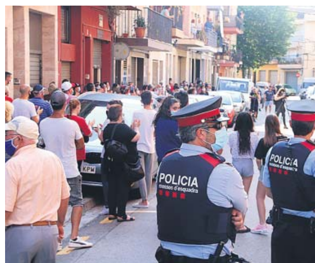
Vecinos de Mataró concentrados contra unos okupas.

Solo un día antes, el domingo, se supo de otra protesta similar: la de 120 vecinos de Mataró que querían echar a una familia de okupas, que supuestamente te-