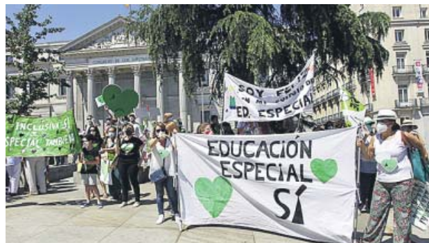
Concentración por la Educación Especial ante el Congreso. J. PARÍS

Convocados por la plataforma Educación Inclusiva Sí, Especial También, los asistentes desafiaron las altas temperaturas de primera hora de la tarde y exigieron la retirada de los apartados de la Ley Celaá que «vulneran gravemente los derechos de las personas con necesidades