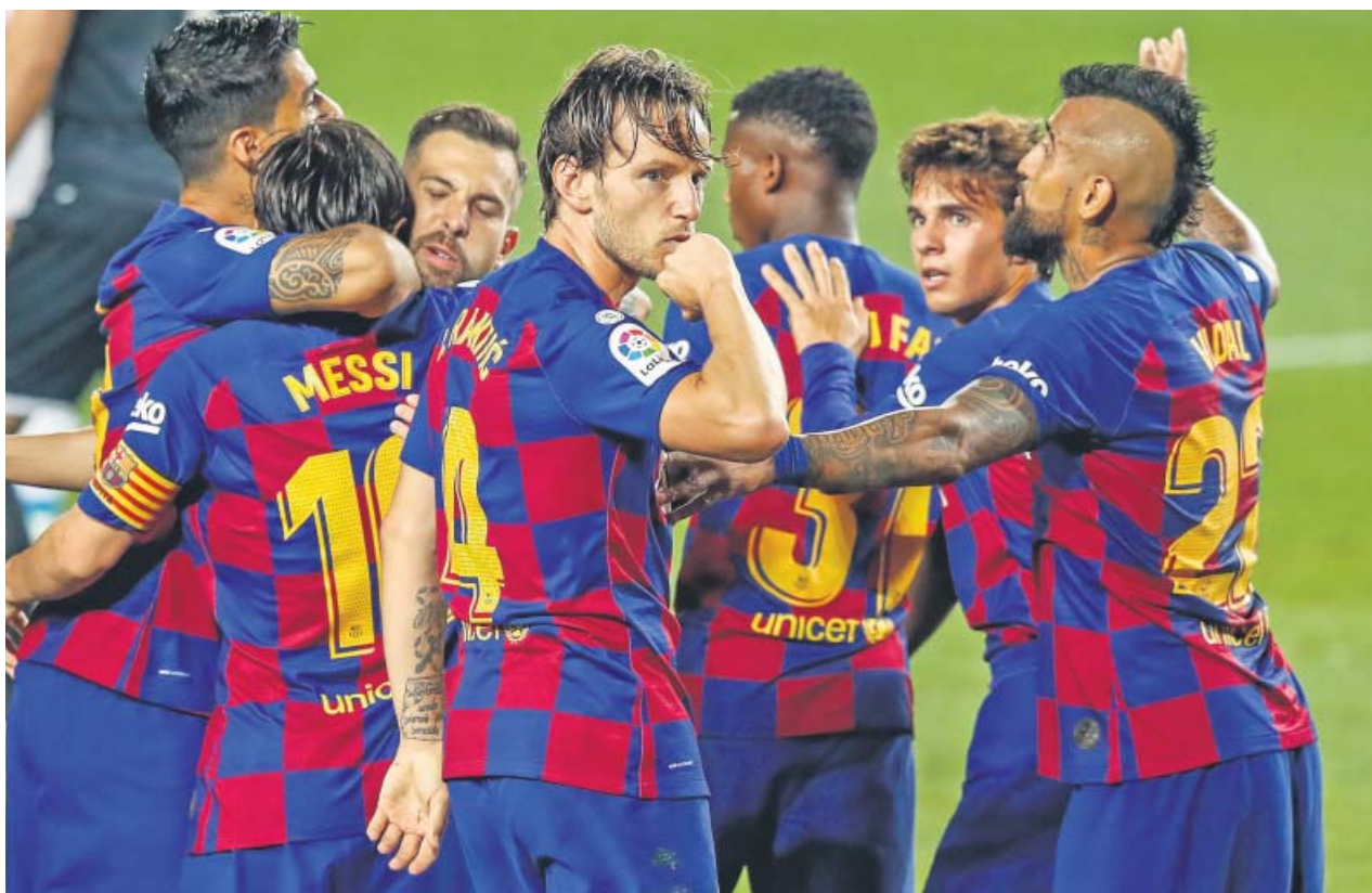
Ivan Rakitic celebra su gol al Athletic con el resto de sus compañeros.