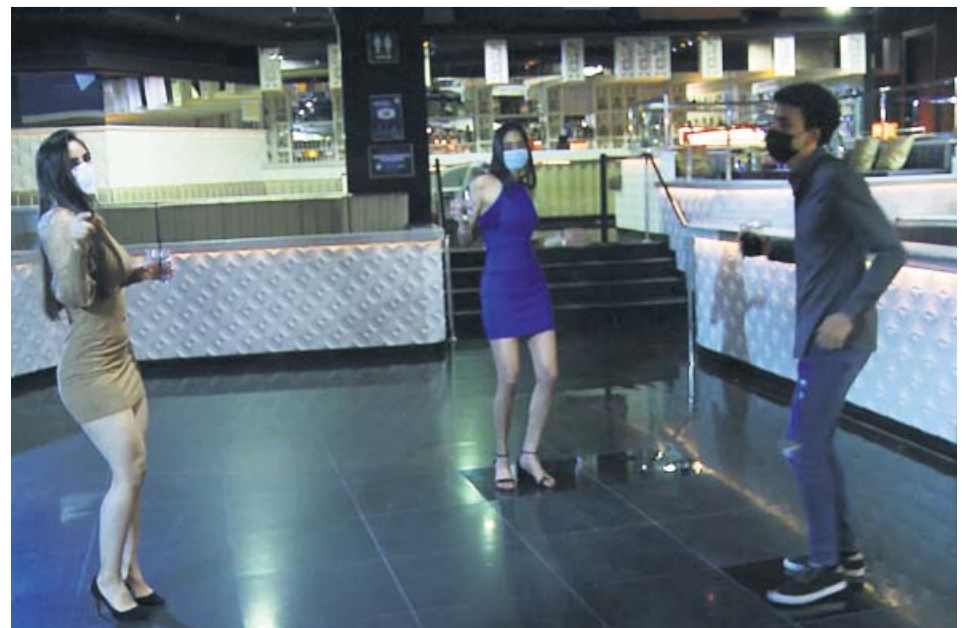
Tres personas bailando en la pista de una discoteca con mascarilla. ESPAÑA DE NOCHE

Aseos con aforo limitado. Los aseos deberán tener definida su capacidad máxima y se insta a que haya una persona dedicada a limpiarlos y a controlar que se cumplan las medidas de seguridad.