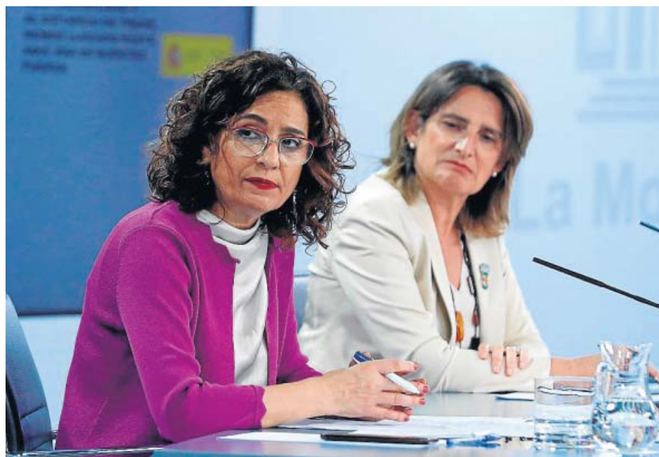
La portavoz del Gobierno, María Jesús Montero, y la vicepresidenta cuarta, Teresa Ribera.

El Gobierno no tiene previsto actuar por ahora ante los últimos brotes de coronavirus, pero no descarta tomar medidas si fuera necesario. En caso de «agravarse» la situación, se plantea cerrar el país al turismo internacional y restringir de nuevo los movimientos mediante la declaración del estado de alarma. El Gobierno lanzó ayer estos dos mensajes —uno más voluntario que otro— al mismo tiempo que intentaba mantener la calma sobre los casos que se registran estos días. «No hay nada que temer en estos momentos», dijo su portavoz, María Jesús Montero.