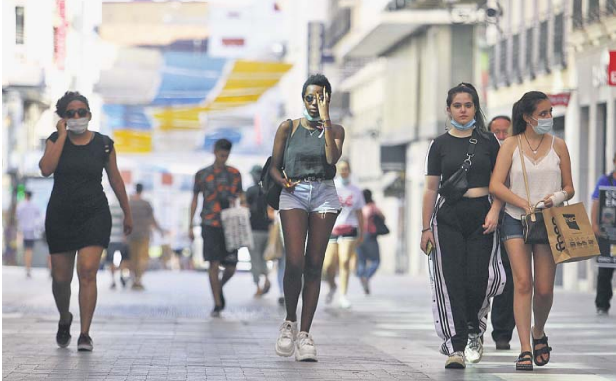
Peatones caminando por la calle Preciados de Madrid, ayer, durante la jornada más calurosa en lo que va de año. JORGE PARÍS