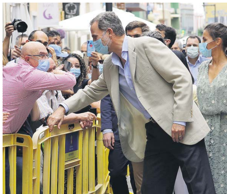
Felipe VI se acerca a saludar a algunos ciudadanos en un paseo por Gran Canaria.

«Es verdad que [Canarias] está físicamente más lejos, pero también es verdad que tuvo desgraciadamente un protagonismo al inicio de esta crisis con los primeros casos que se reportaron en La Gomera», señaló Felipe VI antes de recordar que España «ya está en marcha» y levantando «el ánimo». ●