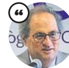
QUIM TORRA Presidente de la Generalitat

«El Govern destinará 450 millones de euros a Educación y contratará entre 6.000 y 10.000 profesionales»