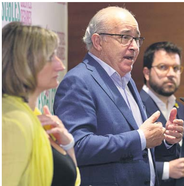
Los consejeros Vergés, Bargalló y el vicepresidente Aragonès.

La consellera de Salud aseguró que «es posible una escuela segura y sana». «El 13 de marzo se tomó la decisión de cerrar todas las escuelas por el conocimiento que se tenía entonces, pero ahora podemos actuar distinto», señaló. Los estudios indican que la mayoría de niños presentan cuadros muy leves y la mayoría de ellos son asintomáticos. De hecho, menos de un 1% de positivos por PCR son menores de 15 años. «La carga viral de