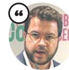
PERE ARAGONÈS Vicepresidente de la Generalitat

«El Govern destinará 370 millones de euros a Educación y contratará, como mínimo, a 5.000 profesionales»