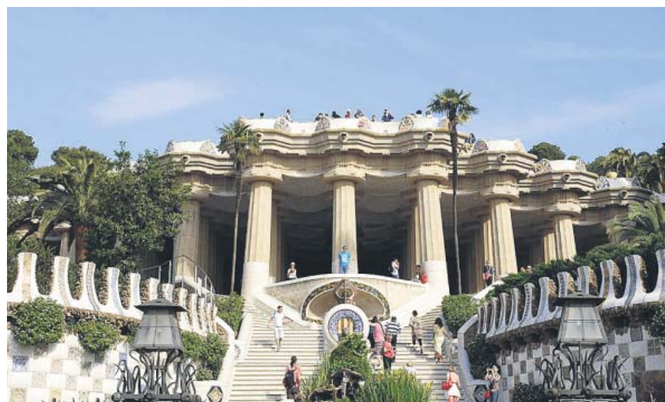
El Park Güell recuperará mañana su funcionamiento habitual, con un aforo reducido.

2020 i traslladar-la al 2021 tenint en compte «les actuals circumstàncies» i «amb l'objectiu de garantir la millor edició possible tant en participació com en internacionalització». Alimentària és una fira bianual, de les més importants que se celebren a Barcelona. El 2021, la Fira recuperarà salons ajornats pel coronavirus com el MWC, o l'IOT Solutions World Congress, sobre l'Internet de les coses, o l'Automobile. ● R.B.