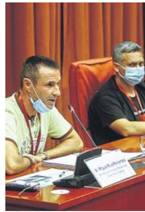
Representantes del Comité de Nissan, ayer en Parlament.

Además, criticó que Nissan está aprovechando la legislación para irse por la puerta de atrás y acusó a la compañía de intere-