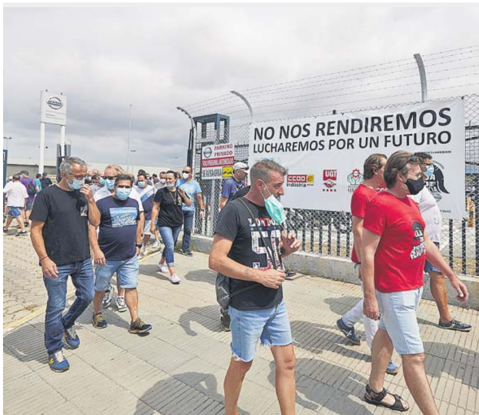
Los trabajadores de Nissan se concentraron ayer ante la planta de Zona Franca.

Los sindicatos, por su parte, se negaron ayer a negociar el cierre de las tres factorías y aseguraron que ellos sólo iban