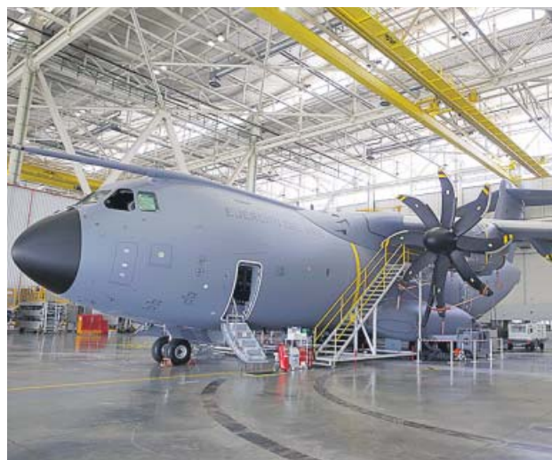
Ensamblaje de un avión en la factoría de Airbus en Sevilla.

Según las cifras facilitadas por la compañía, España es el país menos perjudicado por el recorte laboral de Airbus, que prevé que las reducciones afectarán a unas 5.000 personas en Francia, 5.100 en Alemania, 1.700 en Reino Unido