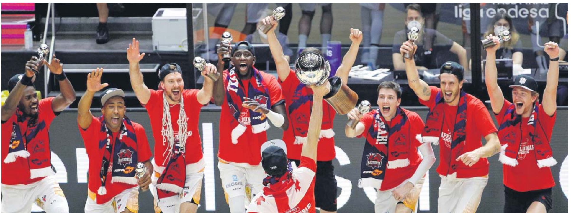
Los jugadores del conjunto vitoriano celebran, en una Fonteta prácticamente vacía, su título de la Liga Endesa.