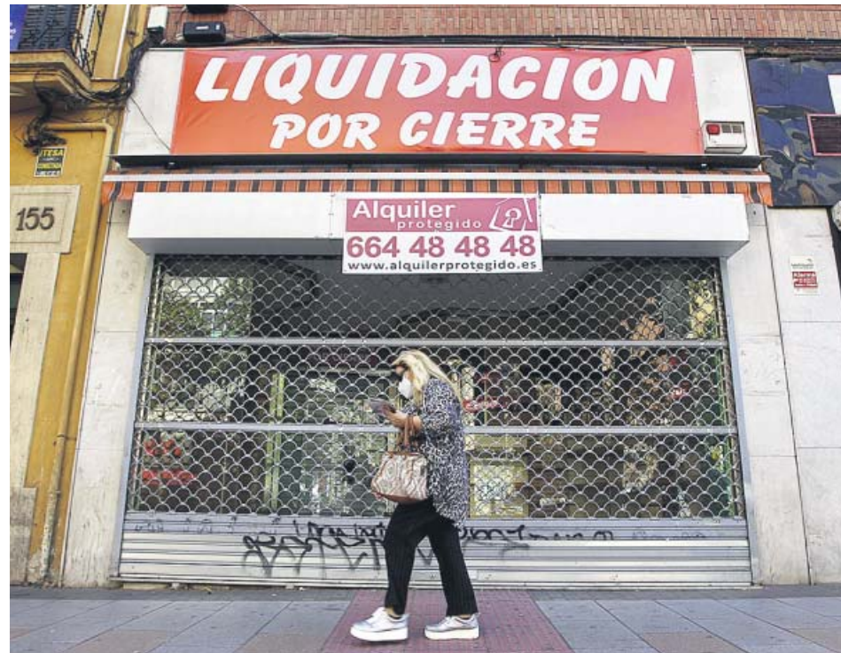
Una mujer camina frente al escaparate de un comercio cerrado, ayer en Madrid.

El Banco de España aconseja que el Gobierno apueste por un plan «a medio plazo» con medidas de ajuste para encauzar la «elevada» deuda pública, que se puede situar de nuevo por encima del 100% del PIB. El gobernador del Banco de España, Pablo Hernández de Cos, asegura que la economía española tiene «margen para redefinir la cesta de impuestos» con el objetivo de favorecer en mayor medida el crecimiento económico y la reducción del déficit. Llama a limitar los tipos reducidos de IVA y el elevado nivel de beneficios fiscales, así como a mejorar «la eficiencia del gasto». Considera urgente que