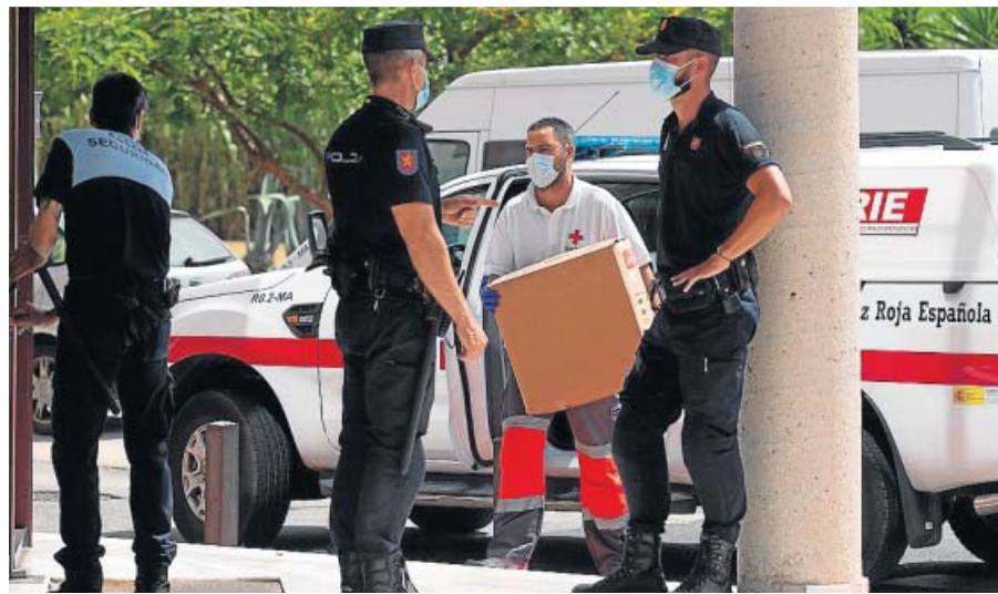
La Policía vigila la entrada al edificio de la Cruz Roja afectado por un brote, en Málaga.