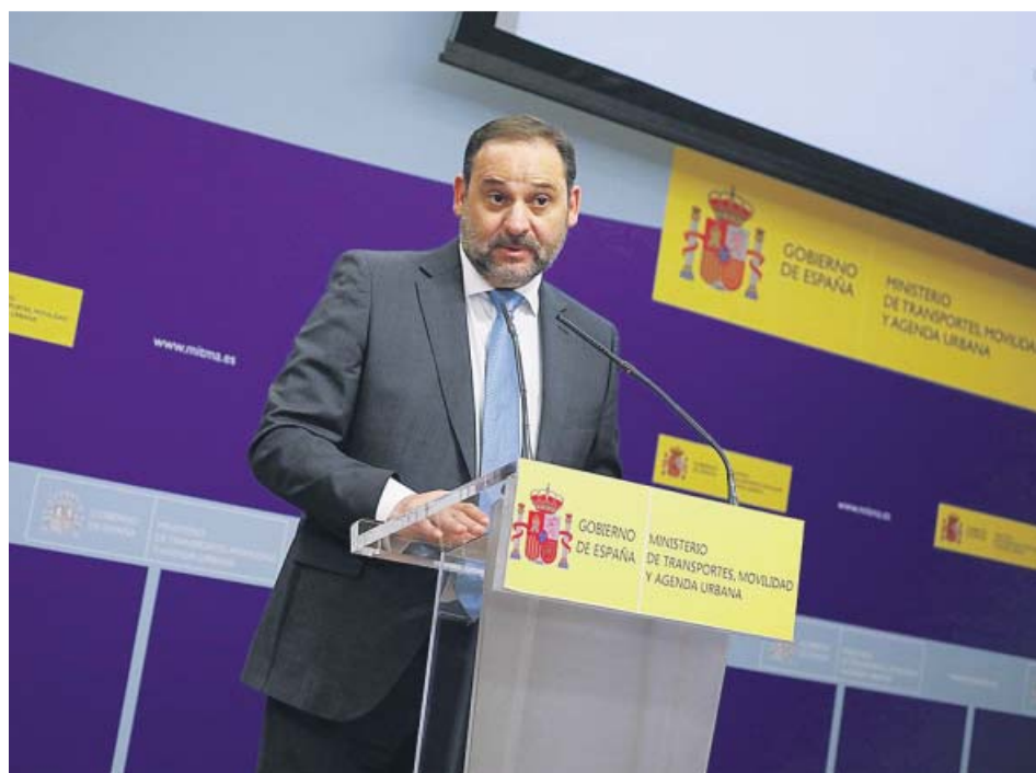
El ministro de Transportes, Movilidad y Agenda Urbana, José Luis Ábalos.

Este punto sí se contempla en el pacto de coalición entre PSOE y Unidas Podemos, que ayer Ábalos optó por no mencionar. Según se dice en este documento, en función de la referencia de precios que fija es-