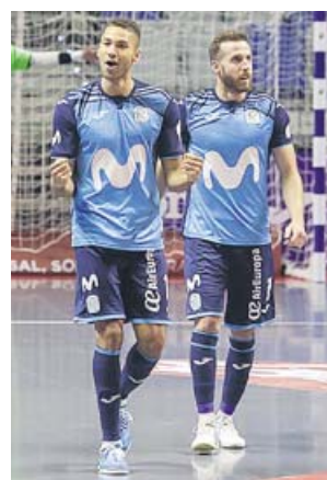
El Movistar celebra uno de los goles de ayer.