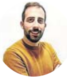
Por Alex González Periodista

Decía Merlí, el profesor de filosofía de la serie catalana que tanta audiencia ha tenido que, «si queremos ser felices no debemos basar nuestra felicidad en unos principios tan frágiles como la suerte». Cada capítulo daba una lección magistral a sus alumnos, los famosos «peripatéticos». La suerte es algo que no dura para siempre, por lo que siempre toca estar preparados. Merlí enseñaba a pensar a sus estudiantes. Algo que se ha olvidado con el paso de los años y que se sustituye por libros sobre la fortuna. La sociedad vive por norma general en espacios confortables. Asisten a un camino ya marcado donde cualquier adversidad supone un problema parecido a aquella metáfora del vaso de agua y el ahogamiento. Además la humanidad vive en una etapa donde más que nunca mira la vida desde una cámara, sin disfrutarla con los ojos. ¿Recuerdan el mito de la caverna de Platón?