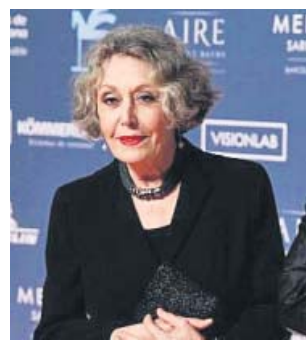
Rosa María Mateo, en una imagen de archivo.

Estas destituciones y dimisiones llegan en un momento de gran actividad informativa, en plena pandemia de coronavirus y durante la precampaña de las elecciones en el País Vasco y Galicia. ● R.C.