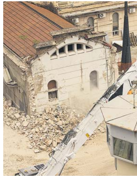
Para poder empezar las obras de las dos escuelas, las máquinas están derribando la lavandería y la enfermería de la antigua cárcel. MIOQUEL TAVERNA