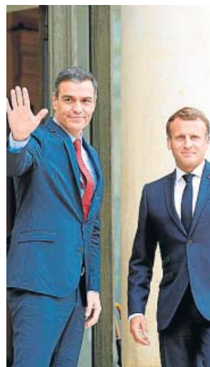
Macron recibió a Sánchez ayer en el Eliseo.

A juicio de Lofven, «el acuerdo en julio es muy complicado pero no imposible», así que todo el mundo debe hacer esfuerzos para encontrar un término medio. «Si en una negociación uno no está dispuesto a cambiar un poco de postura más vale enviar un papel a Bruselas y no ir», afirmó. Lofven, de nuevo, dijo que es partidario de que solo sean préstamos y enfocados a las «necesidades reales».