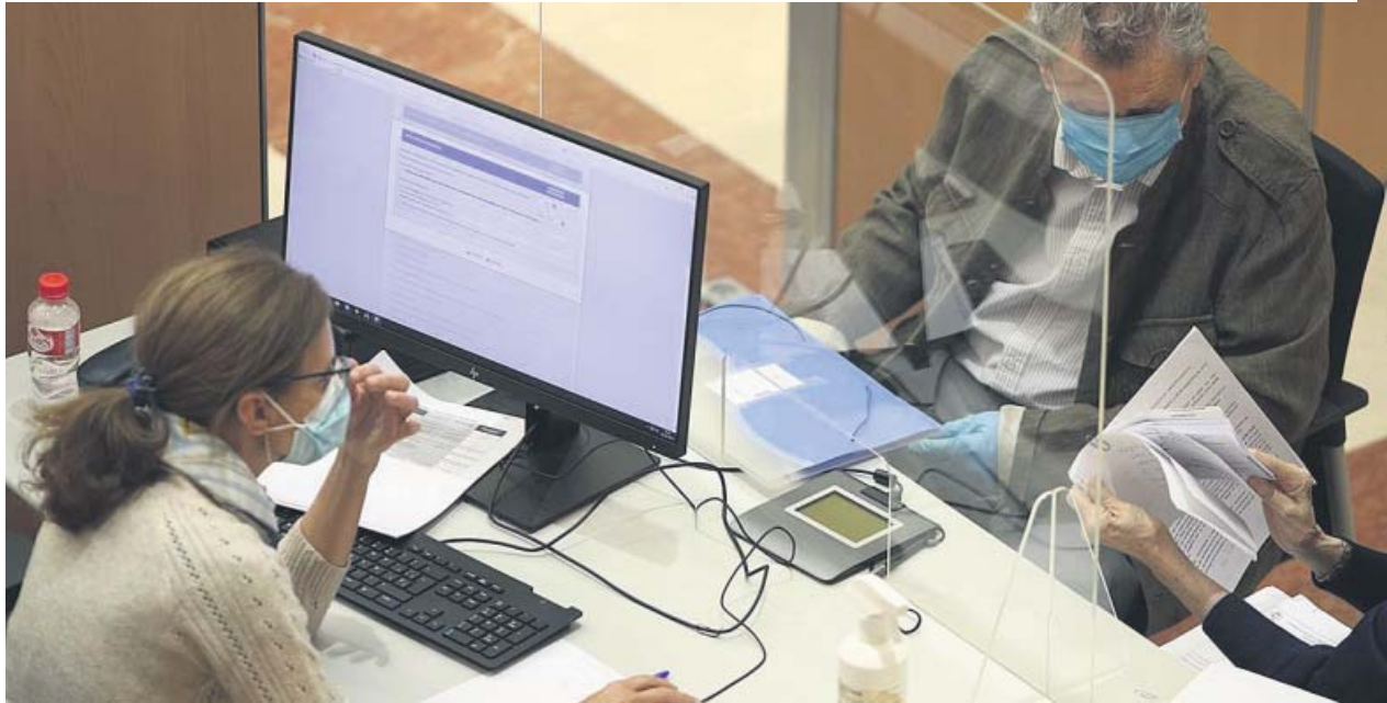
Una funcionaria de la Agencia Tributaria atiende a contribuyentes.

Las prestaciones percibidas por un ERTE, total o parcial, están sujetas a tributación como rendimientos del trabajo