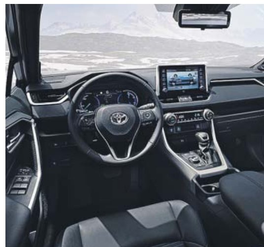
El interior tiene una espléndida calidad de ejecución.

Cinco generaciones y 10 millones de unidades después, este modelo destaca por su eficiencia, confort y agrado de conducción.