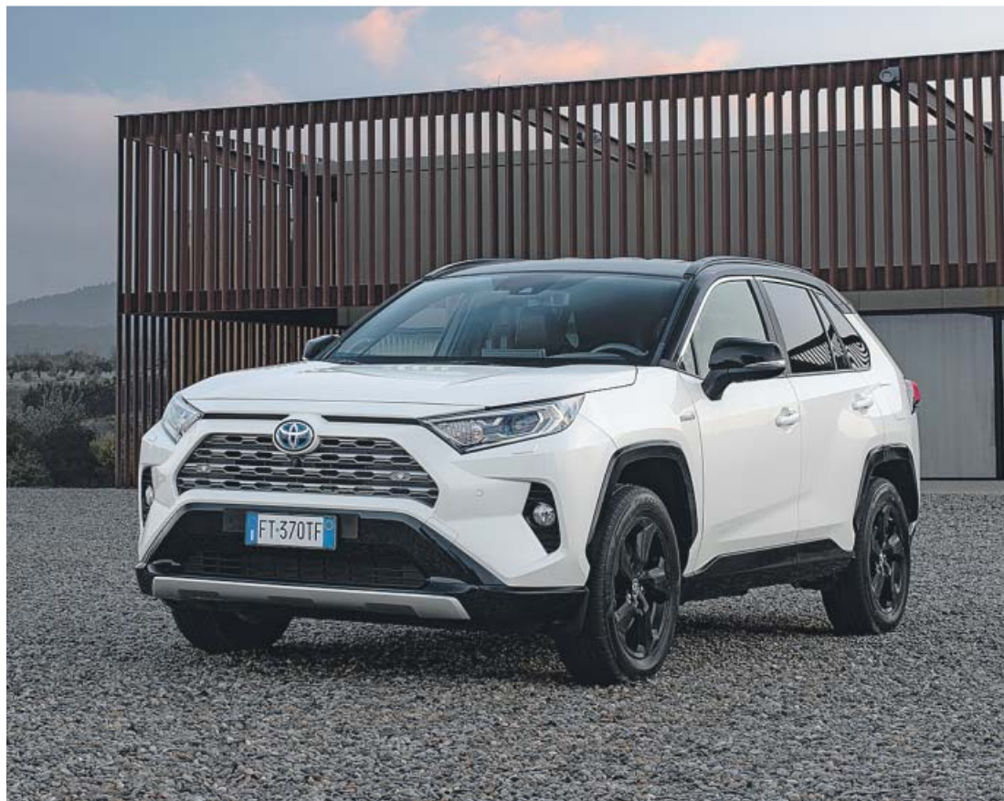
Visto por delante, sobresale su calandra y las ópticas de LED, que dan mucho carácter a todo el conjunto.

En el RAV4 Electric Hybrid, en su versión de tracción total, el conductor puede elegir entre los modos 'Normal', 'Eco' y 'Sport'. Al escoger el modo 'Sport' se modifica la asistencia a la dirección, el control del acelerador, la respuesta del cambio y la distribución del par motor para conseguir un mejor rendimiento en carretera. Además, el modo 'Trail', mediante un control automático de diferencial de deslizamiento limitado, garantiza el mejor agarre y control en superficies de baja adherencia y tramos off-road. La gama del nuevo RAV4 Electric Hybrid, compuesta por los acabados Business, Advance, Advance Plus, Feel y Luxury, destaca por su sobresaliente equipamiento.