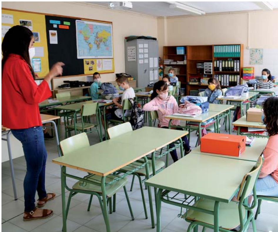
Interior de un aula del Instituto-escuela de Navàs (Barcelona). A.C.N.