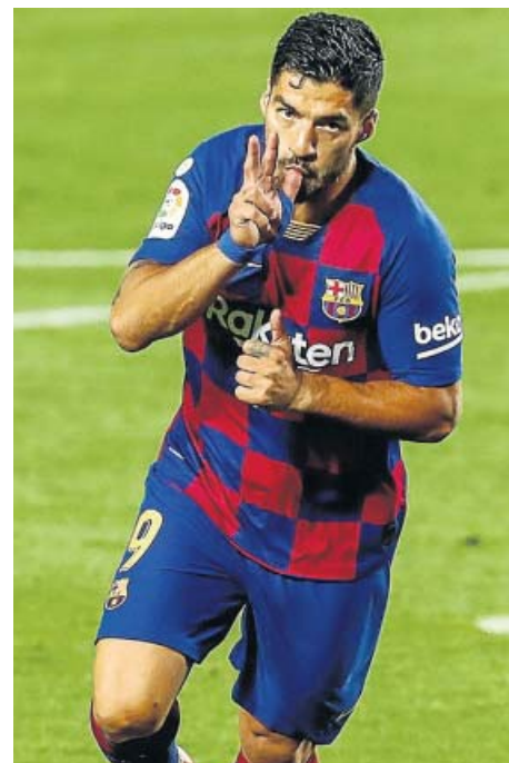
Real Madrid y Barcelona seguirán hoy con su lucha por la Liga. ¿Se decidirá hoy?

Todas las estadísticas deportivas en 20minutos.es