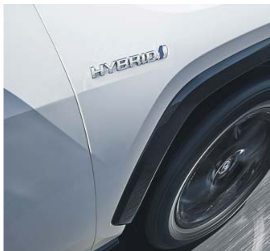
Toda la experiencia híbrida de Toyota se ha proyectado en el RAV4.