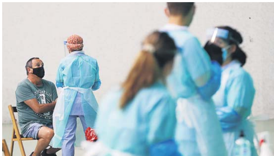
Un hombre se sometía ayer a una PCR en un dispositivo puesto en marcha en Getaria.