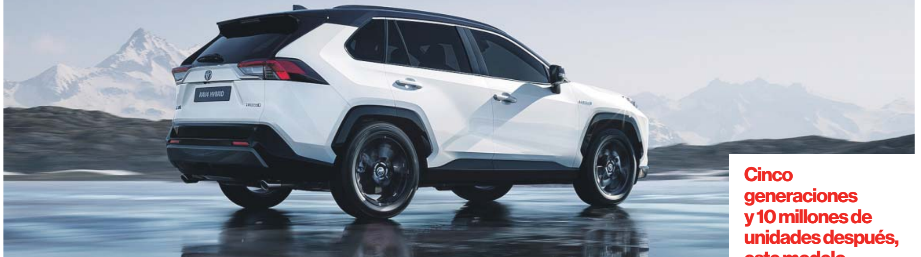
La imagen del RAV4 combina un estilo muy definido con la robustez de un auténtico SUV, se mire desde donde se mire.

Con casi un millón de unidades comercializadas el año pasado, más de 133.000 de ellas en Europa, el Toyota RAV4 Electric Hybrid es el SUV más vendido del mundo. En España, y coincidiendo con el lanzamiento de la quinta generación en 2019, se vendieron más de 11.000 unidades, lo que da una idea del éxito de este modelo, sin duda uno de los líderes dentro del pujante segmento de los SUV compactos.