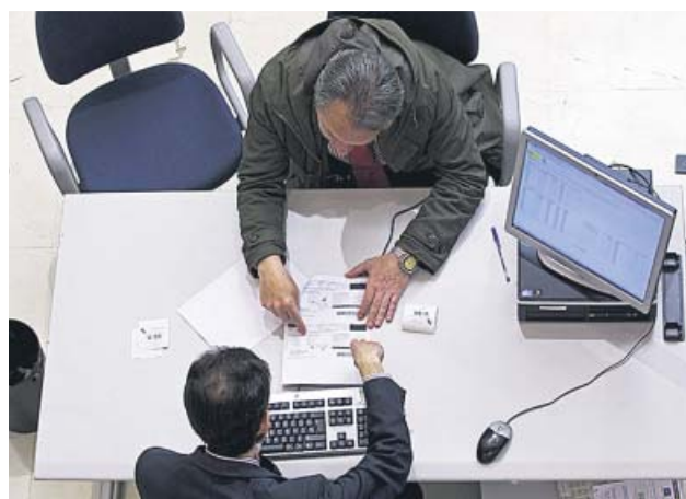
Un contribuyente revisa su declaración con un gestor.

La AIREF revela que este beneficio fiscal perjudica a las mujeres. También pide revisar el IVA y los planes de pensiones