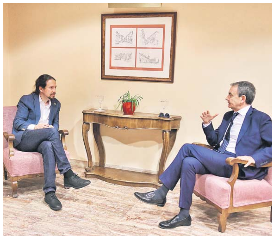
Pablo Iglesias y José Luis Rodríguez Zapatero, ayer, en los cursos de verano de la Complutense.

El presidente de la Generalitat, Quim Torra, volvió ayer a poner sobre la mesa su propuesta de organizar un nuevo referéndum de autodeterminación en Cataluña, mientras que ERC lo ha instado a consensuar una «estrategia» y aparcar los «reproches» entre independentistas. «Podemos volver a hacerlo», sostuvo Torra.