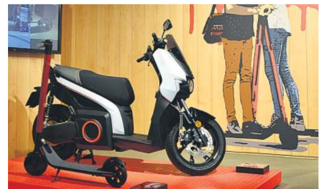
La moto y el patinete eléctricos de la marca Seat MÓ. A.HERREROS

cultural, con conciertos y otras presentaciones. La planta 1 acoge la exposición, el lugar donde se muestran los últimos productos de la marca, entre ellos, la moto y el patinete eléctricos que Seat pondrá a la ven-