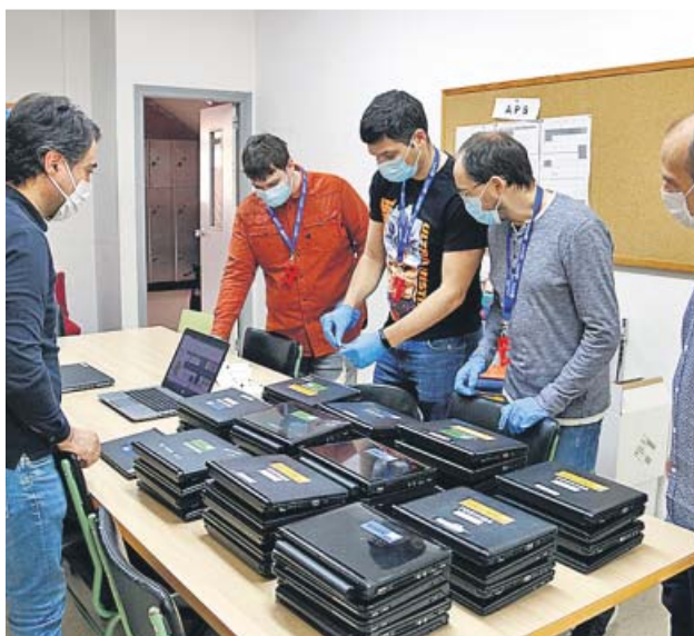
Responsables de un instituto preparan ordenadores.

Los repartirà en el inici del pròxim curs a estudiants de 3º y 4º de ESO, FP y Bachillerato por si hay otro confinamiento