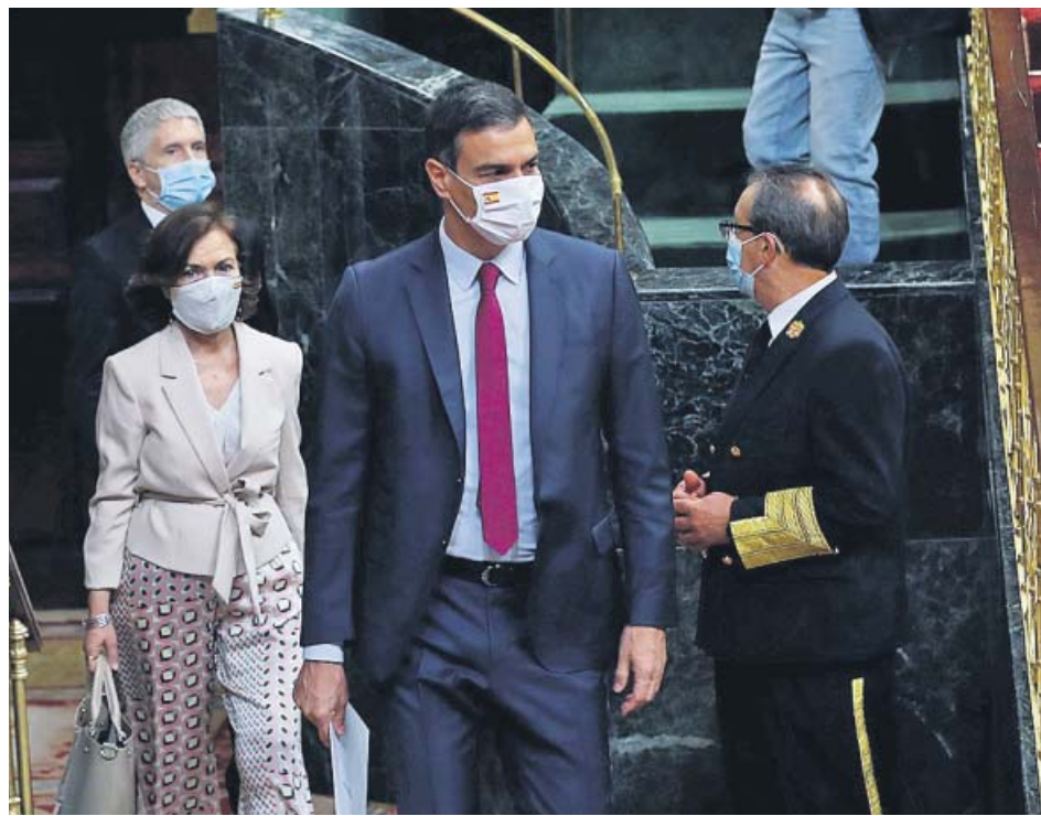
El presidente del Gobierno, la vicepresidenta primera y el ministro del Interior.

Desde hace semanas, fuentes del Gobierno venían minimizando el impacto de lo que saldría de la 'comisión de reconstrucción' del Congreso. Sin embargo, la votación de ayer sobre las medidas para afrontar la crisis que deja la pandemia evidenció un efecto no menor. PSOE y Unidas Podemos tuvieron que apoyarse particularmente en el PP y en Ciudadanos para sacar adelante los dictámenes sobre Sanidad, Reactivación Económica o la UE. La desafección de los socios de investidura a la izquierda del PSOE se reflejó en el rechazo del Congreso al dictamen sobre Política Social, donde el PSOE había admitido la mayor parte de las enmiendas de ERC o Compromís. Así, quedaron en el tintero propuestas para mejorar