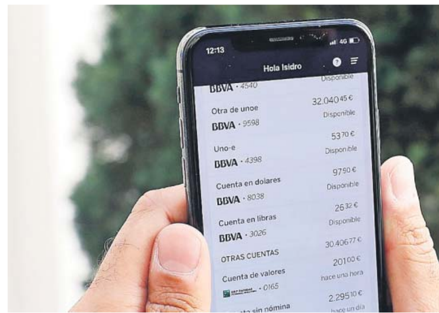
L'eina d'agregador financer també està unida a BBVA Bconomy. BBVA

Els Mossos van desallotjar ahir una casa okupa anomenada Ca l'Espina al barri de Gràcia sense incidents. El local, al carrer Astúries, es va entregar a la propietat. La policia catalana va actuar per requeriment judicial cap a les 7 del matí, van apuntar fonts policials. Els okupes que utilitzaven aquest espai provenien d'altres cases desallotjades.