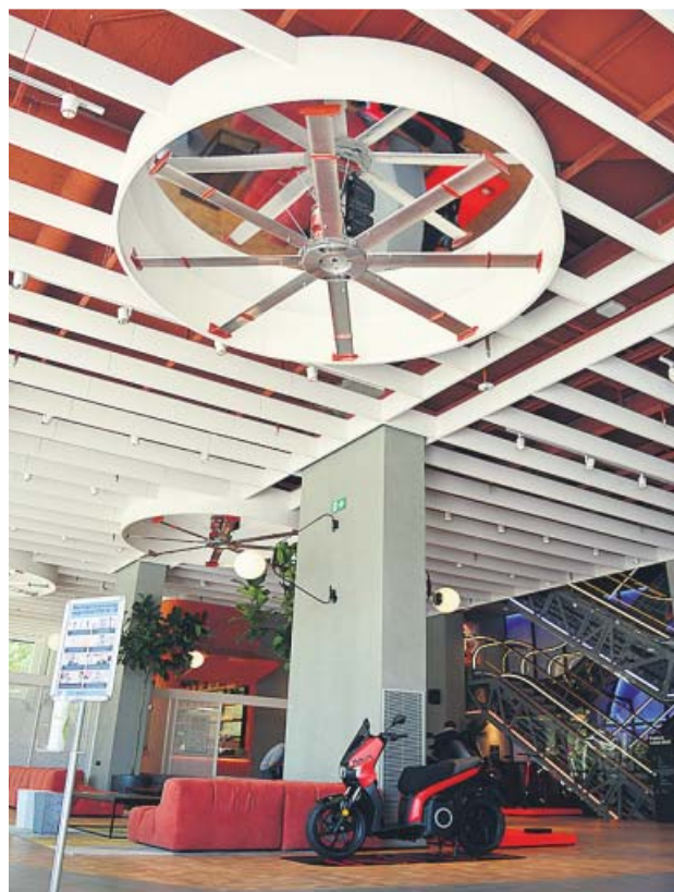
Entrada de Casa Seat y, al fondo, restaurante. ANTONIO HERREROS

En la planta -1 se encuentra el auditorio, un espacio con capacidad para 300 personas (aho-