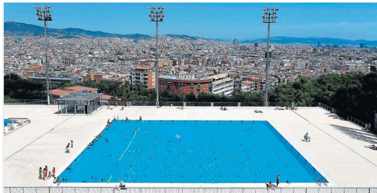
Vista de las piscinas municipales de Montjuïc. En el área de Barcelona los contagios no dejan de aumentar.