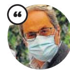
QUIM TORRA President de la Generalitat

«Yo le pedí a la consellera Vergés que había que cambiar lo de los rastreadores y lo de las pruebas PCR»