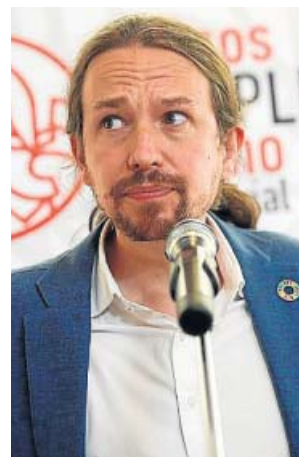
El vicepresidente Pablo Iglesias, hace unos días.

En dicho informe, la empresa se responsabiliza de parte de los daños que presenta la tarjeta, pese a que tampoco pudo acceder a su contenido con los métodos que probó. Cuando recibió el dispositivo, señala la compañía, éste «no tenía cor-