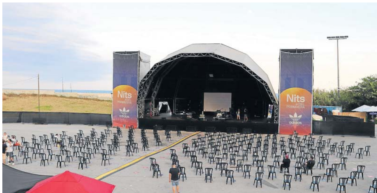
Los promotores musicales piden una investigación interna en el Procicat por la «gestión vergonzosa» del sector cultural.

Salut anunció el miércoles que aumentaría su capacidad de realización de PCR hasta las 30.000 diarias (ahora está en 24.000) y que habilitarían car-