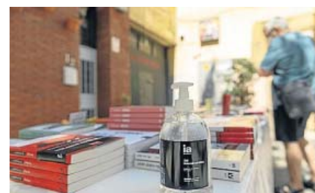
Gel higienizante de manos en un puesto.