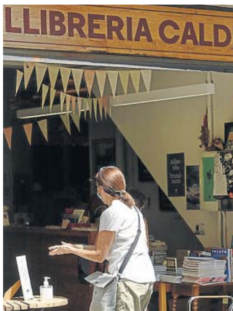
Una cliente siguiendo las normas de higiene.