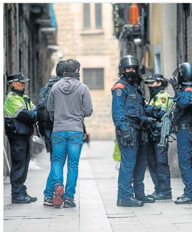
La inseguridad sigue como principal preocupación.

En cuanto a la intención directa de voto, Barcelona en