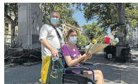
Sant Jordi se celebró con rosas y mascarillas.