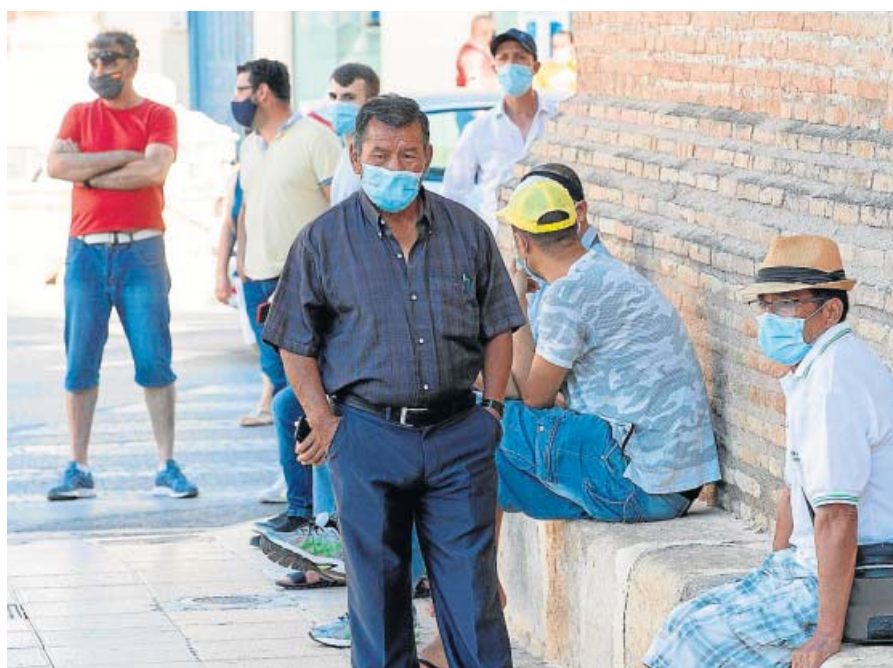
Los habitantes de Totana (Murcia) no podrán salir de su municipio.

ca y los Monegros. Esto se debe al incremento de los nuevos positivos detectados ayer: 422 en toda la autonomía -415, según Sanidad-, de los que 333 fueron en la provincia zaragozana. Las comarcas de la Litera y Cinca Medio, Huesca capital y Barbastro continúan en la fase 2 «flexibilizada» que se decretó hace ya más de una semana.