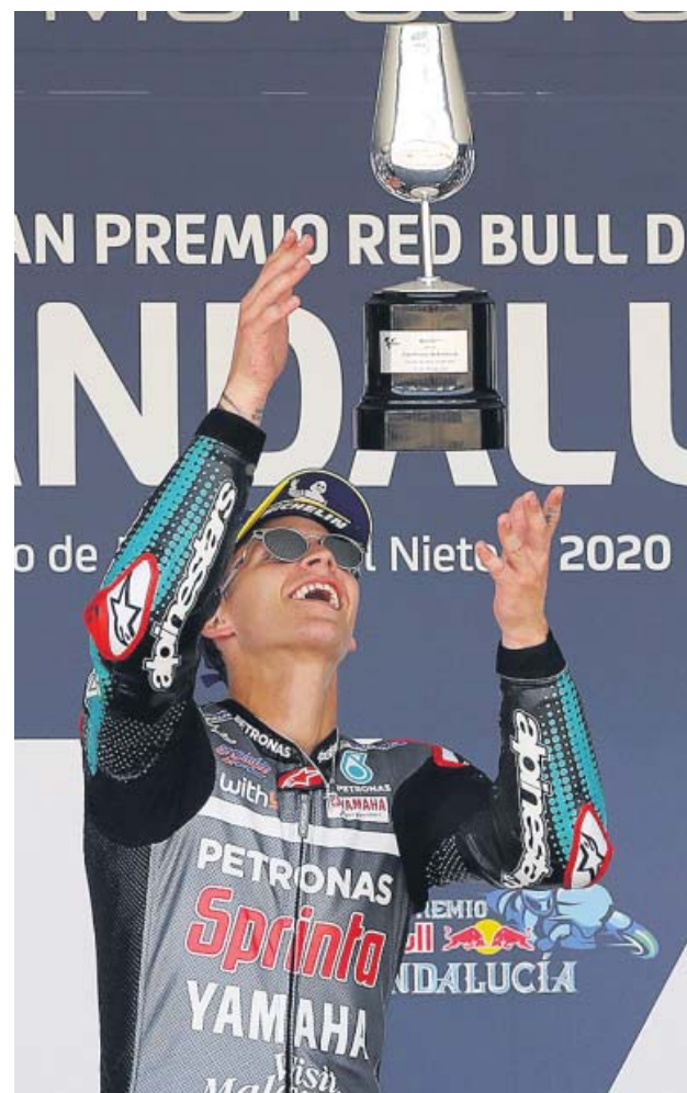
Fabio Quartararo celebrando su victoria en Jerez.