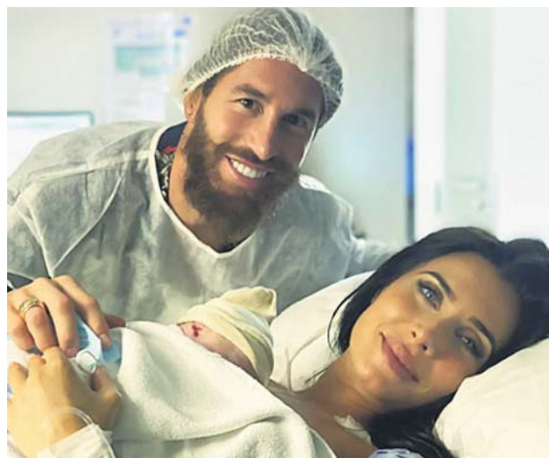
Pilar Rubio y Sergio Ramos junto a su hijo Máximo.

Adriano, ya son cuatro los hijos varones que tiene en común la pareja, que siempre quiso una familia numerosa y una niña entre ellos, aunque esta vez tampoco ha podido ser. El más pequeño llega tras Sergio Junior, que tiene ahora seis años, Marco, de cuatro, y Alejandro, de dos.